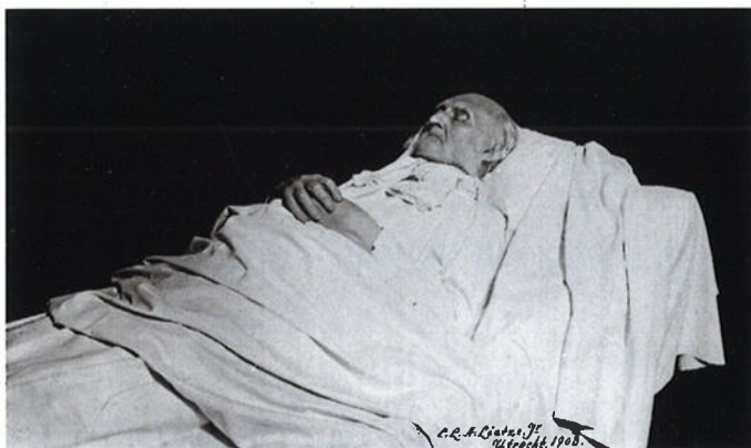
Nicolaas Beets op zijn doodsbed, 1903.

Beets zelf overleed op 13 maart 1903, rond half vijf 's middags, in zijn woning in Utrecht, 88 jaar oud. Zijn dood kwam niet als een verrassing, want sinds het einde van februari – nadat de schrijver getroffen was door een beroerte – hadden veel kranten vrijwel dagelijks over zijn verslechterende toestand bericht.