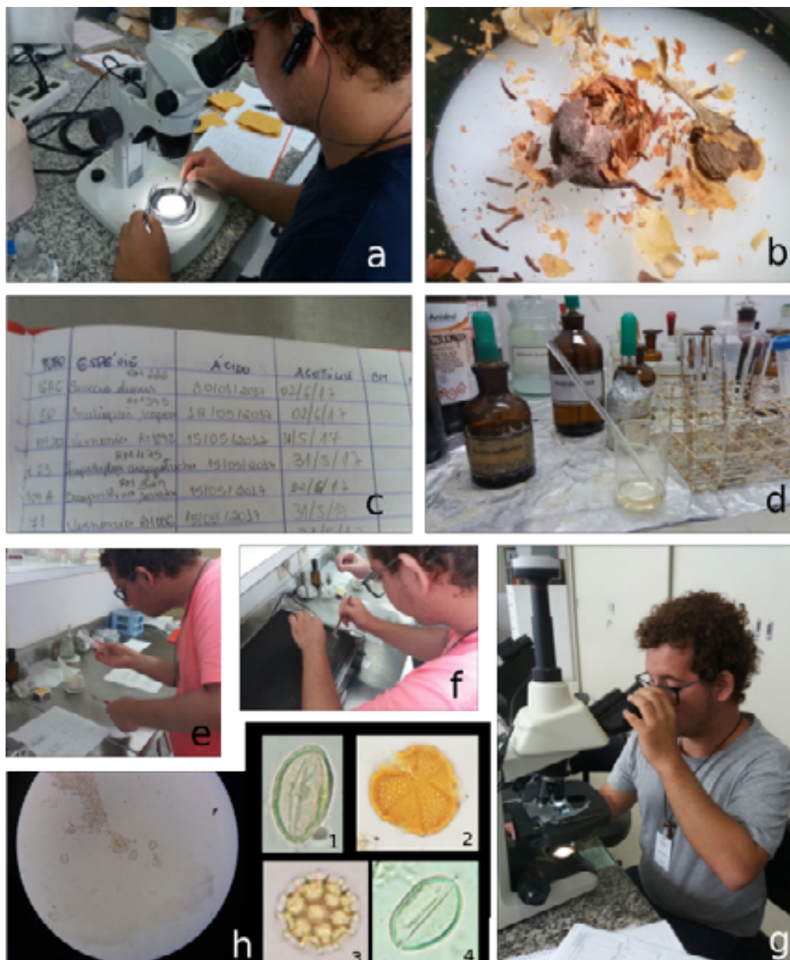
FIGURA 3. MÉTODOS DE PREPARAÇÃO ACTUOPALINOLÓGICA (PÓLEN RECENTE): (A-B) COLETA DAS ANTERAS A PARTIR DOS BOTÕES FLORAIS SELECIONADOS. (C) REGISTRO DAS ESPÉCIES A SEREM ACETOLISADAS. (D-F) PREPARAÇÃO DAS ANTERAS PELO MÉTODO ACETOLÍTICO, PARA A RECUPERAÇÃO DOS GRÃOS DE PÓLEN. (G) OBSERVAÇÃO EM MICROSCOPIA ÓPTICA. (H) FOTOMICROGRAFIAS POLÍNICAS: (1) ASTRONIUM FRAXINIFOLIUM -ANACARDIACEAE. (2) POINCIANELLA BRACTEOSA -FABACEAE-CAESALPINOIDEAE. (3) GOMPHRENA PORTULACOIDES -AMARANTHACEAE. (4) COPERNICIA PRUNIFERA -ARECACEAE. AUMENTO DE 400X.

5. Enrolar o material lavado em disco de filtro de papel. Secá-lo e incinerá-lo em cadinho fechado por 20 minutos. Abrir o cadinho e aquecê-lo por 2h a 800^\circ\text{C} .