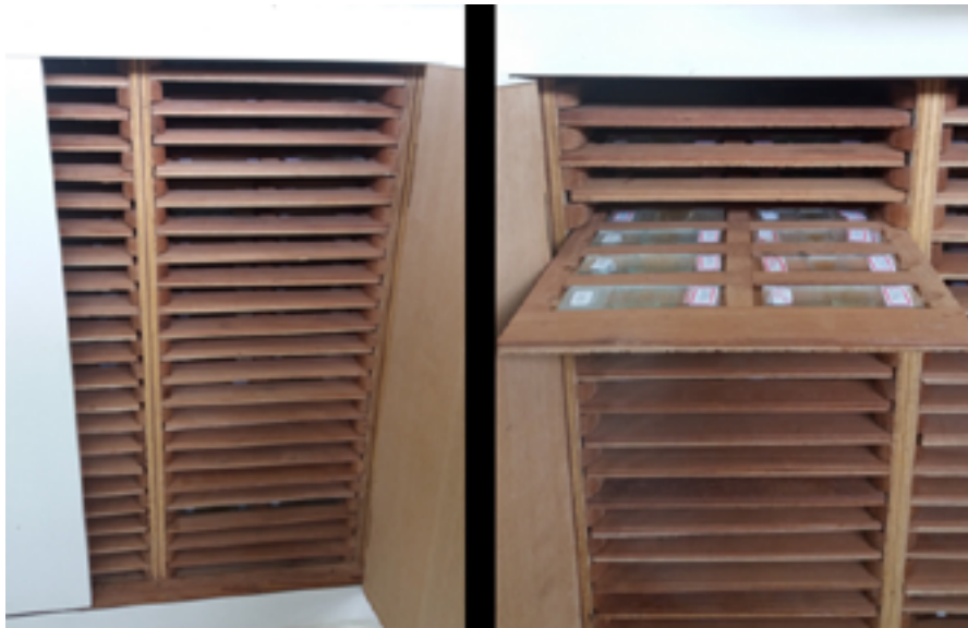
FIGURA 4. MODELO DE ESTRUTURA FÍSICA DE ARMAZENAMENTO DA PALINOTECA DO LABORATÓRIO DE PALINOLOGIA DO DEPARTAMENTO DE BOTÂNICA DO MUSEU NACIONAL/UFRJ.