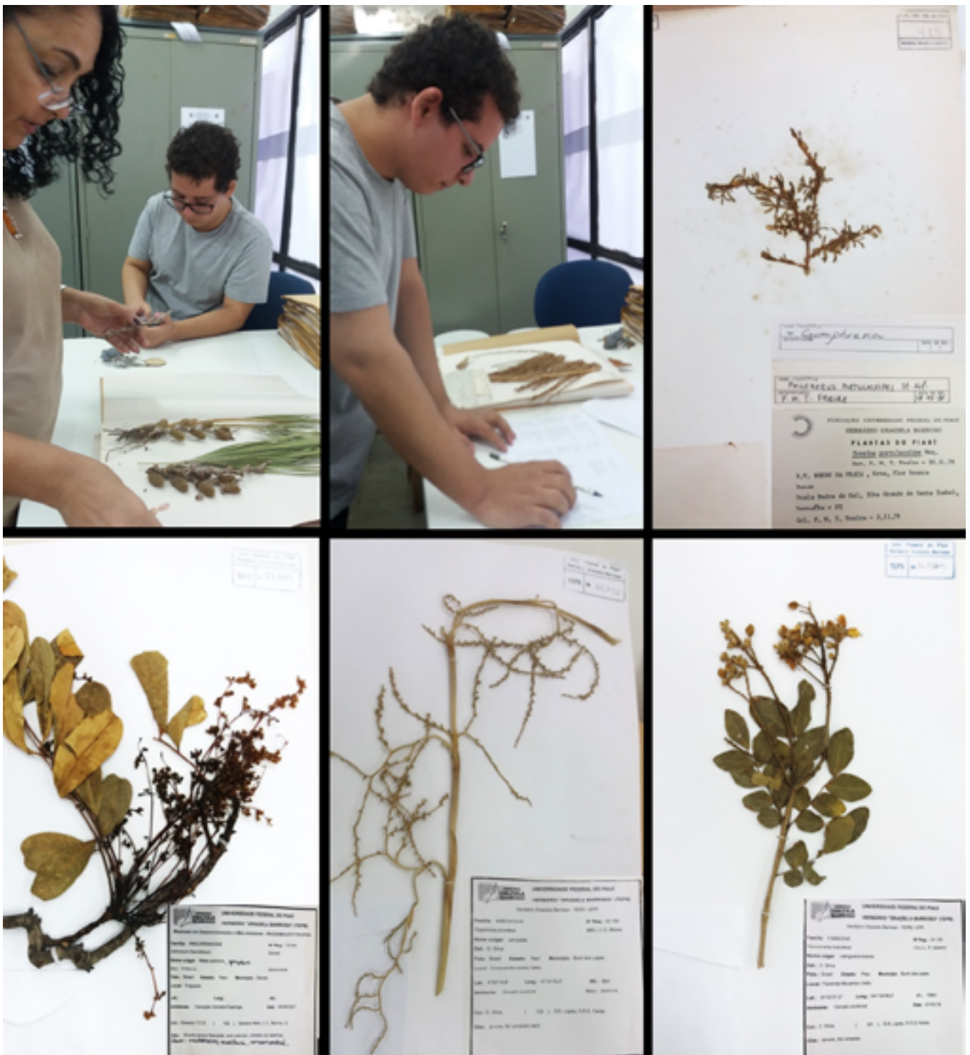
FIGURA 2. COLETA DE ESPÉCIMES EM EXSICATAS NO HERBÁRIO GRAZIELA BARROSO (TEBP/UFPI).

Cada grupo vegetal a ser registrado e tombado (palinoteca, fitoliteca, amidoteca, carpoteca, xiloteca e antracoteca) possuirá um código relacionado ao seu depositório final. A exemplo, a palinoteca, primeiro grupo vegetal em fase de implantação, consiste em um código de tombamento POLENAP, onde POLE se refere ao próprio grupo e NAP (Núcleo de Antropologia Pré-Histórica) o local físico de tombamento, sujeito a deslocamento futuro bem