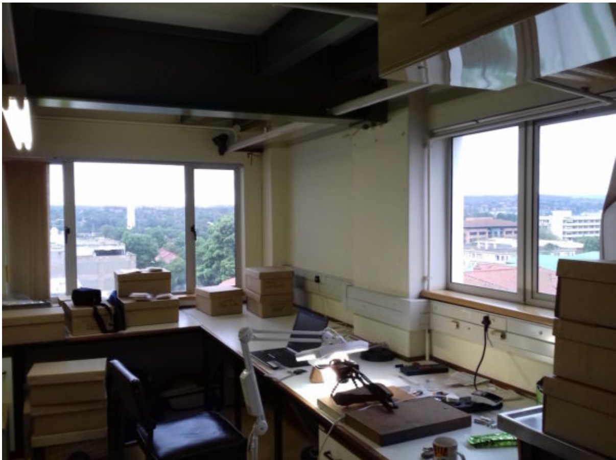
Tijdelijke werkplek in het KwaZulu-Natal Museum.

De vondsten van mijn opgraving zijn opgeslagen in het KwaZulu-Natal Museum in Pietermaritzburg. Hier heb ik een eigen werkruimte gekregen. In mijn eerste analyse let ik op een aantal relatief eenvoudige zaken. Ik meet bijvoorbeeld alle werktuigen met een digitale schuifmaat en sla alle gegevens op in een database. Zo kan ik uiteindelijk zien hoe afmetingen van werktuigen zich door de verschillende opgravingslagen ontwikkelen.