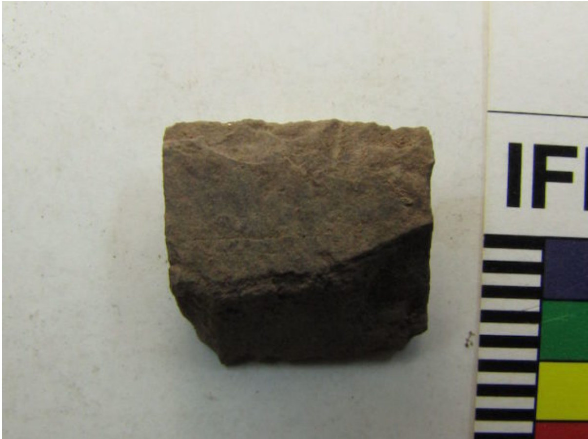
Een stenen "mes" met één zorgvuldig bewerkte (getoucheerde) rand in hornfels

Hoe kom ik er nu achter welke mogelijkheid klopt? Eerst moet ik zoveel mogelijk werktuigen opmeten. Uiteindelijk ga ik kijken of hun afmetingen minder of juist meer worden gestandaardiseerd tijdens die overgang. In het eerste geval geeft dat wellicht aan dat mensen simpelweg minder moeite staken in technologie. Als werktuigen gestandaardiseerd worden of blijven, dan is dat eerder een aanwijzing dat het landgebruik veranderde.