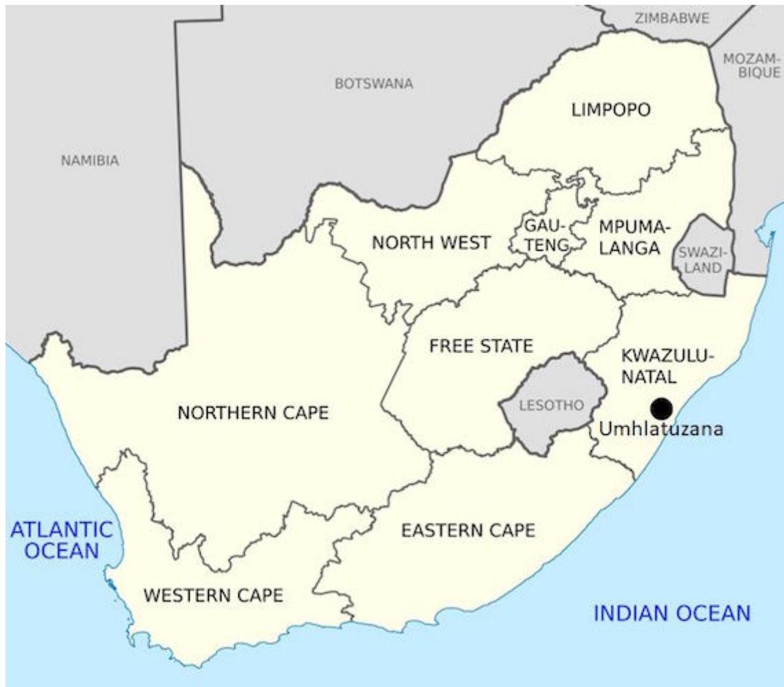
Kaart met de locatie van Umhlatuzana.

Ik kijk ook naar het gebruik van verschillende steensoorten door de tijd heen. In Europa vinden archeologen veel vuurstenen voorwerpen. Vuursteen is heel makkelijk te bewerken. Dat werd vrijwel altijd en overal gebruikt. In Zuid Afrika komt vuursteen niet voor. Mensen moesten hier met veel ongunstigere steensoorten hun werktuigen zien te maken. Op mijn vindplaats, Umhlatuzana, gebruikte men vooral hornfels (hoornrots), kwartsiet en kwarts. Hornfels is het best te bewerken en is samen met kwartsiet favoriet tijdens de Middle Stone Age.