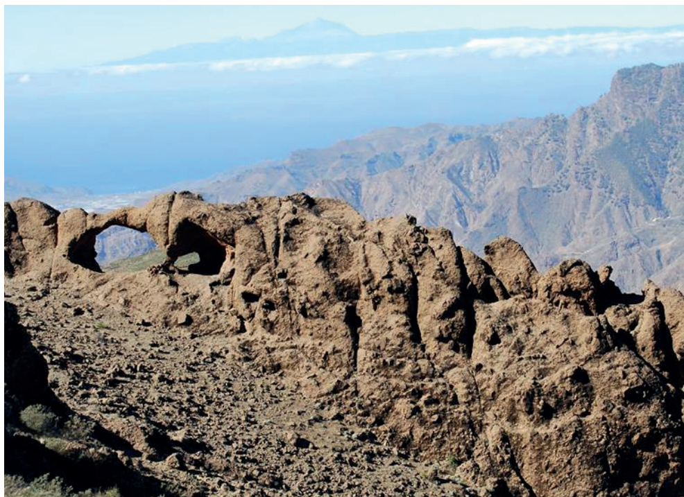
Figura 9. La Ventana del Bentaiga, Lomo del Aserrador, con el Teide de Tenerife al fondo.

la pintura. Las descripciones que las diferentes crónicas hacen de la batalla de Roque Bentaiga (1483) refuerzan las coincidencias en cuanto a los elementos del contexto histórico.