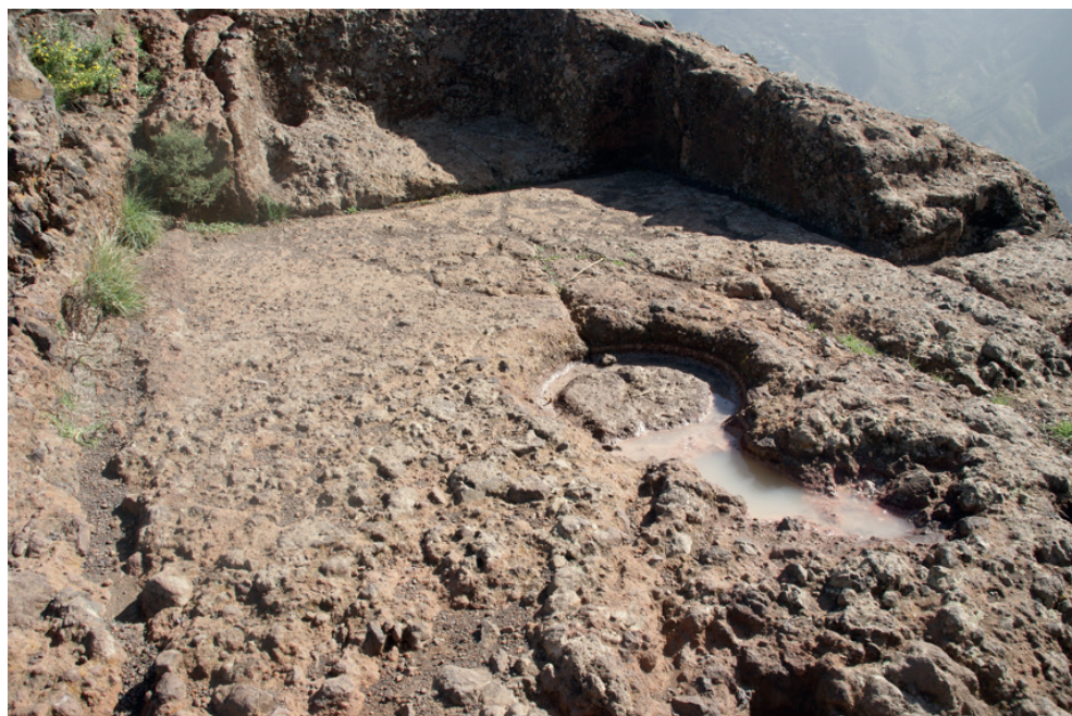
Figura 8. El piso de la casa antigua sobre Roque Bentaiga.

La forma de la casa con los postes le da el aspecto de una jaula pero el detalle de la representación deja muy claro que el anciano no está encerrado en esta casa, sino que está parado en el quicio de la puerta. Más bien avisa a los suyos que ha llegado gente armada, y, gesticulando, los llama a defenderse contra esos invasores.