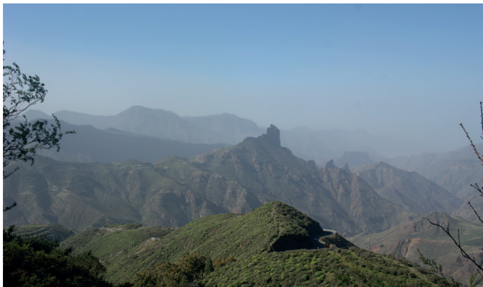
Figura 3. Roque Bentaiga en la Caldera de Tejada.

que el mar que aparece a mano derecha en la pintura es entonces el mar que rodea la isla de Gran Canaria y continúa entonces entre las rocas de la misma isla (que lo tapan) y el perfil del Teide en la distancia.