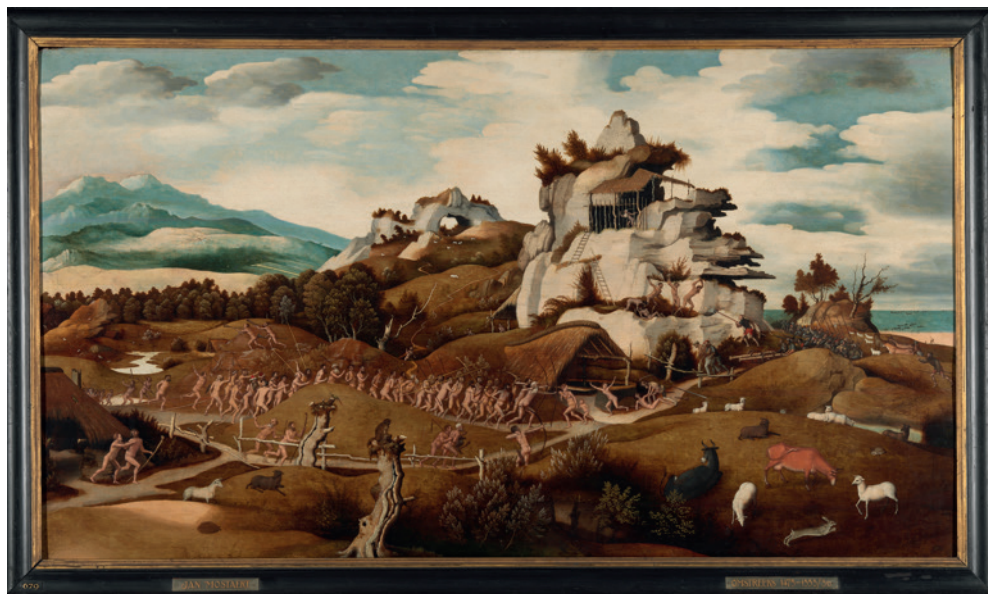
Figura 1. La pintura Paisaje de las Indias Occidentales de Jan Mostaert.

El texto de van Mander demuestra de todas maneras que en el tiempo en que él recopiló sus datos se pensaba que la escena estaba situada en las Indias Occidentales. En primer lugar, esta denominación nos hace pensar en las islas del Caribe, pero en aquel entonces la expresión no se limitaba a las Antillas sino que se refería a las Américas en general. 5