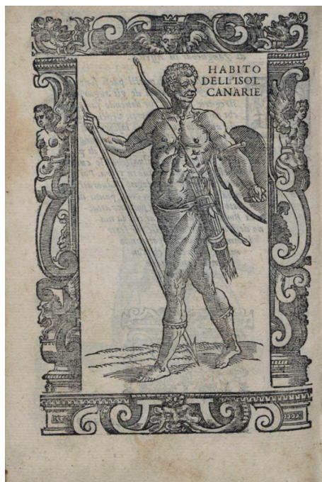
Figura 2. Aspecto de un habitante de las Islas Canarias, según Cesare Vecellio, Habiti antichi et moderni (Venecia, 1590), p. 498v.

Vivían en cuevas y en casas de muros bajos de piedra o postes de madera con techos de palma.