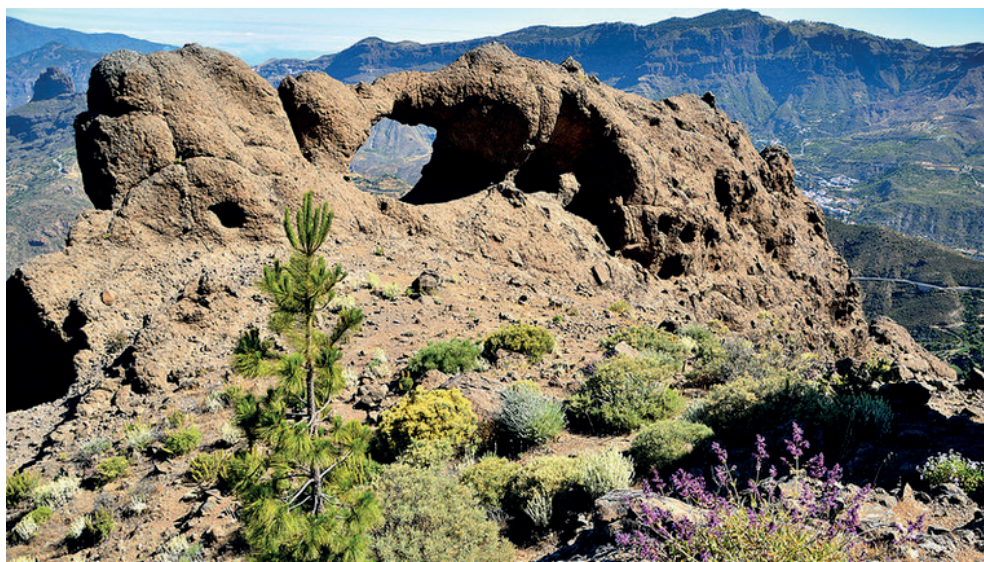
Figura 5. La Ventana del Bentaiga, Lomo del Aserrador.

El Roque Bentaiga domina la Caldera de Tejeda, un paisaje dramático de desfiladeros, que en la pintura se representa de una manera más idílica. Así tenemos que entender el bosque y las aguas en la pintura como una indicación de la gran barranca donde se ubica. En la pintura vemos a un lado de la roca que identificamos como Roque Bentaiga otra montaña con un llamativo arco de piedra; una vereda lleva allí, cruzando la barranca. Por su forma característica identificamos este arco de piedra como la 'Ventana del Bentaiga', una roca que efectivamente tiene esta forma y que está situada encima de una montaña a unos kilómetros al sur del Roque Bentaiga: desde allí hay una vista impresionante sobre Roque Bentaiga y otra roca igualmente emblemática, el Roque Nublo.