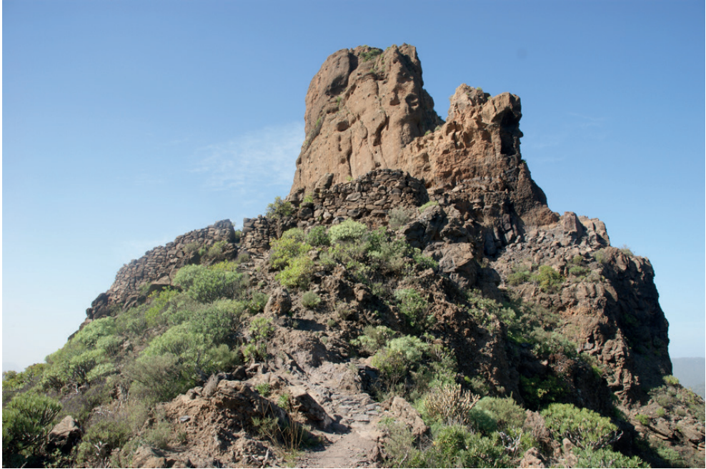
Figura 6. Roque Bentaiga con el muro antiguo.

La forma indica que la vista al Roque Bentaiga es aproximadamente desde el sureste. La sección frontal con las escaleras de madera es la parte donde hasta hoy los visitantes pueden subir (sobre una rústica escalera de piedra recién construida). Luego observamos que la casa de postes con techo de palma o paja, que está sobre una parte plana, con la cima de la roca al fondo, corresponde precisamente a donde está el piso de una estructura antigua, excavado en la roca.