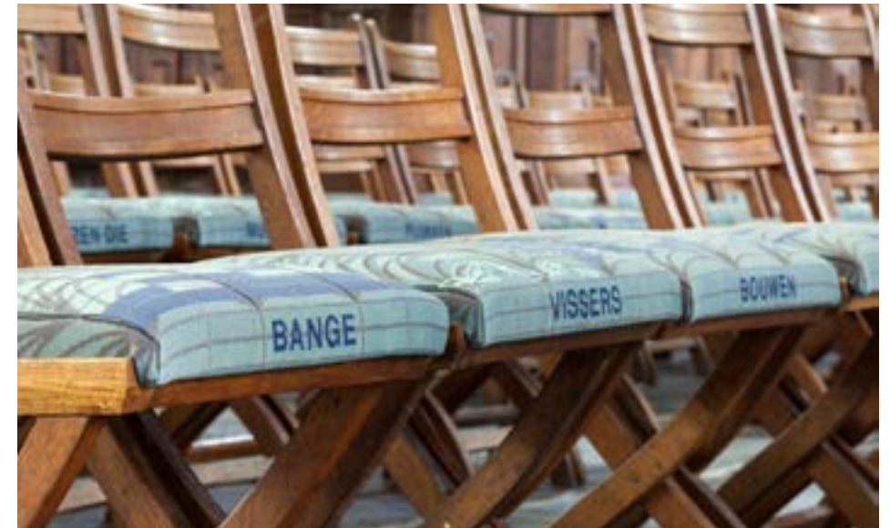
Afbeelding 3.9 Stoelzittingen met tekst.

In de vorm van een educatief programma worden tijdens het borduurproces in de kerk lezingen gehouden over borduren in verleden en heden door diverse textielkunstenaars. De lezingen waren toegankelijk voor zowel de borduursters als andere geïnteresseerden. De kunstenaar zelf houdt de laatste lezing onder de titel 'Stof tot Nadenken', waarin ze reflecteert op het gezamenlijke proces en de betekenis voor haar eigen participatieve kunstenaarspraktijk.