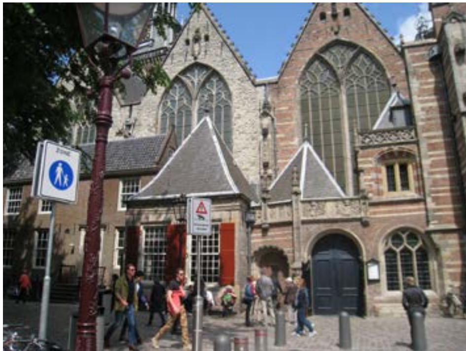
Afbeelding 3.2 De Oude Kerk in Amsterdam.

De Oude Kerk in Amsterdam bevindt zich anno 2014 op een scheidslijn van twee wegen. Na ruim vijftig jaar restaureren wil de kerk het contact met de omgeving herstellen om, net als vroeger, de rol van de 'Huiskamer van Amsterdam' 77 te kunnen vervullen. Stichting de Oude Kerk wil door middel van zorgvuldig gekozen moderne kunst de dialoog aangaan met burgers over de waarden van de Kerk. De kunstpraktijk 'Stof tot Nadenken' is het eerste project waarmee deze nieuwe richting wordt ingezet.