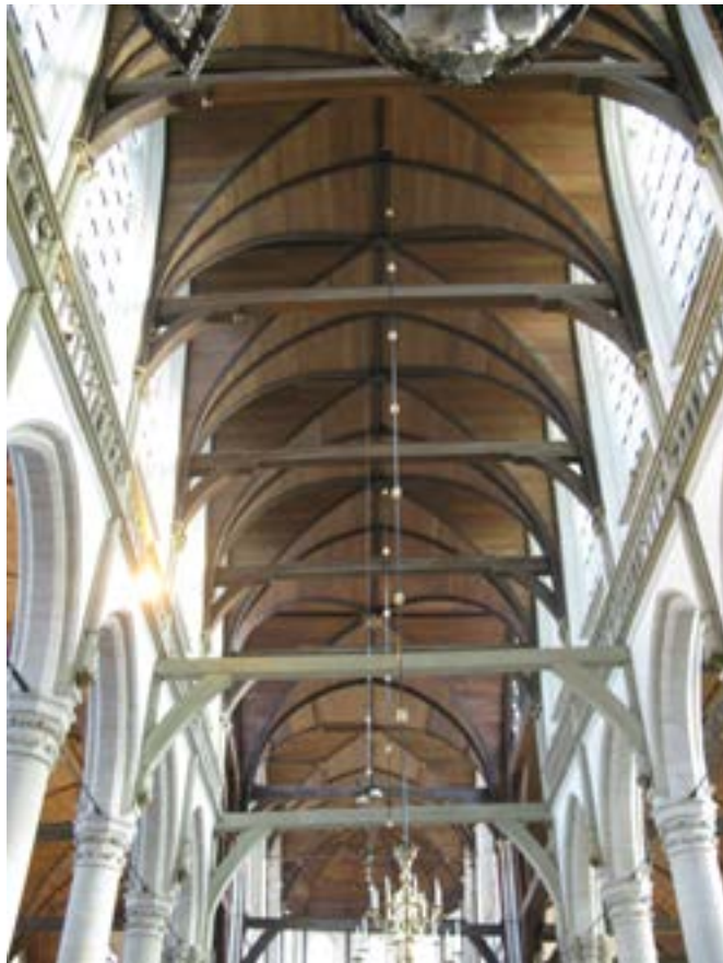
Afbeelding 3.5 Gewelf Oude Kerk. Foto: Sara Vrugt 2014

In totaal worden meer dan honderdtwintig verhalen, anekdotes en gedichten opgehaald. Het geeft de kunstenaar een rijk beeld van zowel de geschiedenis van de kerk als de waarden en betekenis die eraan toegekend worden. Het hierdoor opgeroepen 'beeld' van de kerk wordt door de kunstenaar gebruikt voor het ontwerp van de stoelzittingen. (Grandjean, tenVoorde, and Serrano 2014, 158)