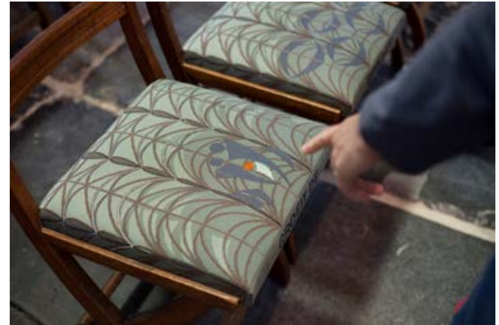
Afbeelding 3.10 Stoelzittingen uit het project 'Stof tot nadenken'.

De deelnemers ervaren het werken in het atelier als gemeenschapsvormend en contemplatief. Het refereert aan de kerkateliers in vroegere tijden. Tijdens de duur van kunstpraktijk worden in kerk verschillende lezingen gegeven over de rol en functie van borduren door de eeuwen heen. Daarmee wordt benadrukt dat het ambacht ook in deze moderne tijd nog steeds actueel en innovatief kan zijn. Met deze participatieve kunstpraktijk wordt de verbinding gemaakt met de hedendaagse samenleving.