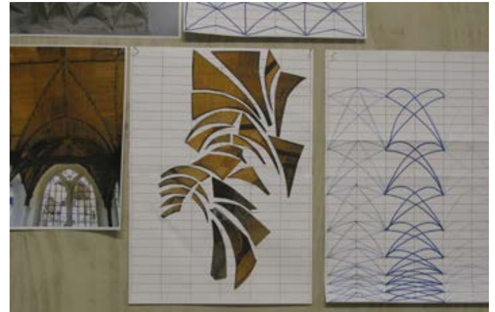
Afbeelding 3.6 Ontwerp voor stoelbekleding.

Van het gewelfpatroon heeft de kunstenaar een tekening gemaakt die in verschillende stukjes wordt geknipt. Daarvan maakt ze 118 verschillende patronen die aansluiten op een van de persoonlijke verhalen: boot, grafstenen, munten. (Grandjean, ten Voorde, and Serrano 2014, 159) Stadsdichter Anna Enquist heeft op verzoek de verzamelde verhalen samengevat tot een stuk proza van 118 woorden.