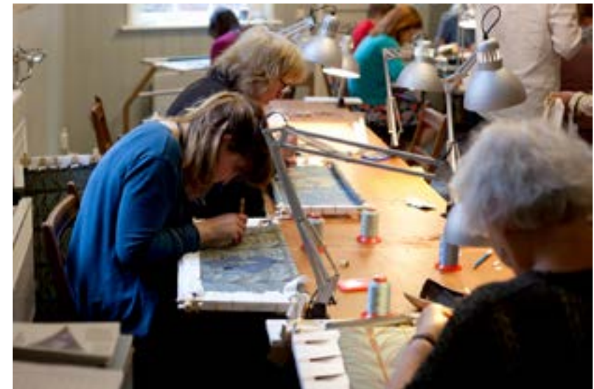
Afbeelding 3.8 Het borduuratelier.

[...] samen met anderen in het atelier werken vond ik heerlijk om te doen. De concentratie en het werk van al die mensen gaf het eindresultaat een extra dimensie. (dd12)