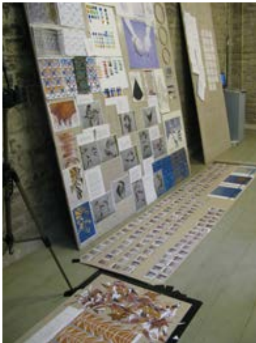
Afbeelding 3.4 Ontwerpen voor de stoelzittingen.

In de eerste fase van het proces schrijft de kunstenaar in overleg met de opdrachtgever het projectplan voor 'Stof tot Nadenken'. Daarnaast bepaalt ze de randvoorwaarden voor de praktische uitvoering van de kunstpraktijk. Het projectplan omvat eveneens een communicatieplan, een activiteitenplanning, een begroting en een dekkingsplan.