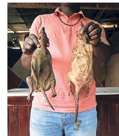
'Bushmeat', wilde dieren uit het oerwoud, zijn belangrijke verspreiders van ziekten. In Ivoorkust biedt een stroper gerookte ratten aan.

Het gevaar dat zoogdiervirussen overslaan op mensen is het meest acuut in delen van de wereld waar van nature een grote biodiversiteit is en waar tegelijkertijd veel mensen