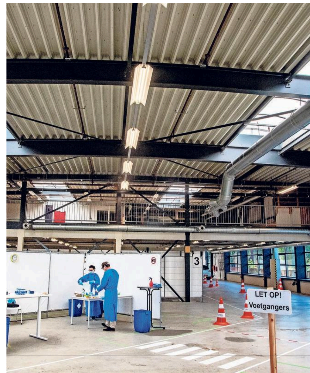
De teststraat in Schiedam.

Het RIVM kan de afgenomen vraag evenmin verklaren. „Of er een verband is met minder corona, is lastig te zeggen”, zegt Coen Berends.