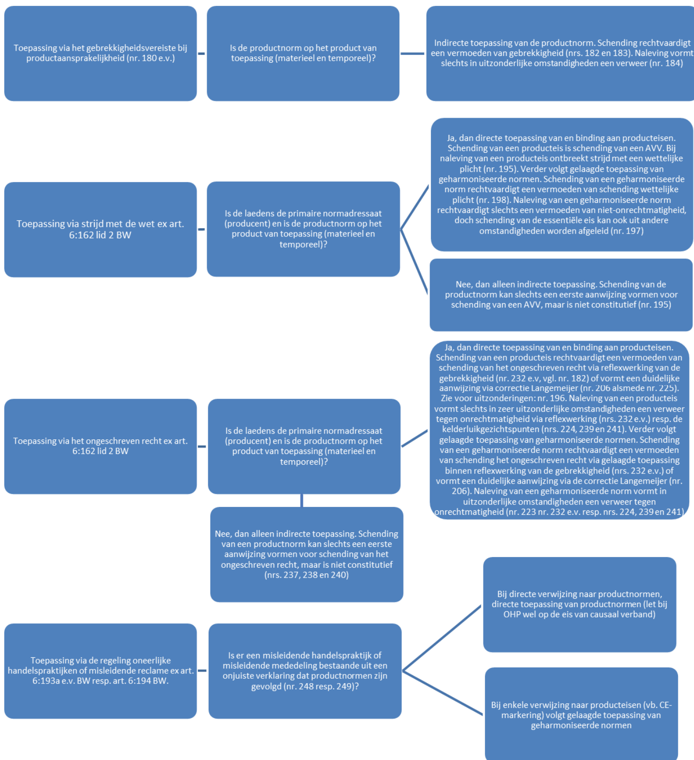
Figuur 2 Wijzen waarop productnormen betekenis krijgen voor buitencontractuele normstelling (zie voor concrete gezichtspunten, paragraaf 8.5)