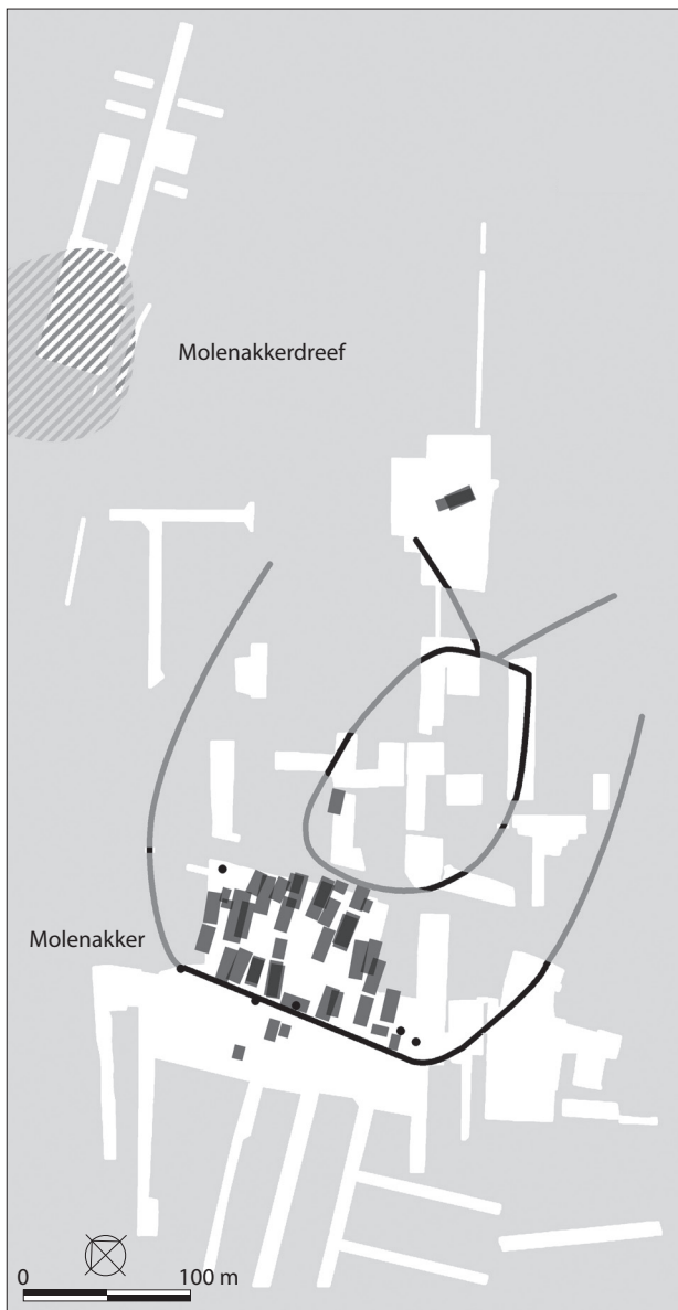
Figuur 45. Overzicht van de nederzetting Molenakker en het grafveld Molenakkerdreef in Weert. Naar tol 1998a, 3, fig. 1.2.