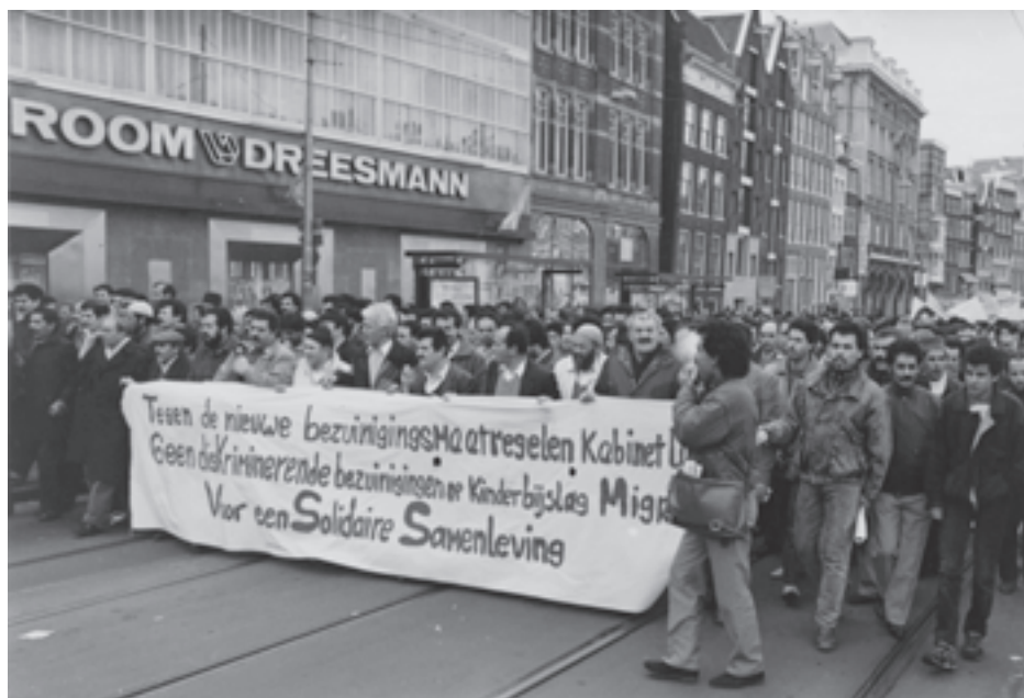
In Amsterdam gingen Marokkanen de straat op om te demonstreren tegen de in hun ogen discriminerende kinderbijslagregeling, ca. 1980.