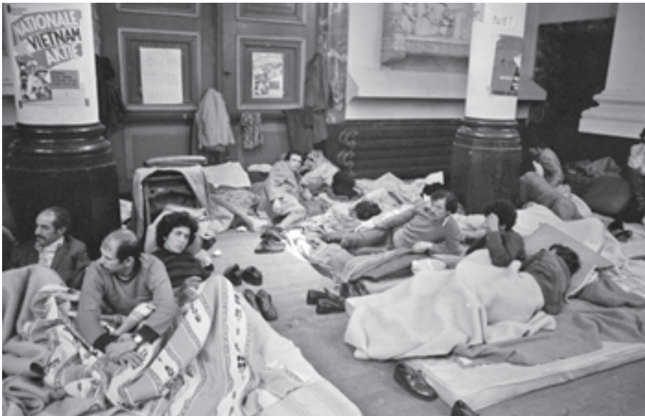
Marokkanen in Mozes en Aäronkerk in Amsterdam, 16 november 1975.

Het verblijf van de Marokkanen in de kerk trok veel politieke aandacht en belangstelling van de media. Maandenlang domineerde de actie in de Mozes & Aäronkerk de voorpagina's van de kranten. De hongerstakers in de kerk wilden een generaal pardon, geen uitwijzingen, geen razzia's in de pensions en bestraffing van de koppelbazen. En ze wilden, schreef de Volkskrant , dat de 'Nederlandse regering een eind maakt aan de praktijken van de Marokkaanse organisatie Amicales, de vertegenwoordiger van de politieke terreur, die hen van huis uit tot hier achtervolgt'. 56 De actie breidde zich uit. Twintig illegale Marokkanen gingen in hongerstaking in de Utrechtse Monikakerk, 57 en in de Haagse Gerardus Marjellakerk nog eens dertig. 58 Van der Lek (PSP) en Van der Heem (PPR) zetten zich in de voor de groep in de Mozes & Aäronkerk omdat ze vreesden dat deze Marokkanen bij terugkeer in hun moederland 'bijzonder hard' zouden worden aangepakt. Het regime van Marokko zou hen verdenken van 'linkse sympathieën'. 59 Op 11 oktober 1975 demonstreerden bijna tweeduizend buitenlanders en Nederlanders op het Haagse Binnenhof tegen het regularisatiebeleid. Ze eisten een generaal pardon voor alle buitenlandse arbeiders die in onzekerheid leefden. 60 De buitenlandse arbeiders in het algemeen en de kerk-Marokkanen in het bijzonder, kregen veel steun van progressieve politieke partijen, en van maatschappelijke en kerkelijke organisaties.