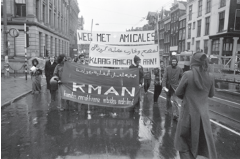
Op 20 november 1977 organiseerde het KMAN een manifestatie tegen de onderdrukking van het Marokkaanse regime en zijn handlangers in Nederland.

Later in dat jaar, in september 1977, was de oprichting van een afdeling van het KMAN in Rotterdam aanleiding voor een vijandige confrontatie tussen de beide organisaties. In Rotterdam, waar ook een consulaat gevestigd was, hadden sinds jaar en dag de Amicales een sterke greep op de Marokkaanse arbeiders. In samenwerking met de Stichting Hulp Buitenlandse Werknemers Rijnmond organiseerde het KMAN op 17 september in de Rotterdamse De Doelen een feest ter gelegenheid van het einde van de vastenmaand Ramadan. Nog voor het feest begon maakten de Amicales de bezoekers wijs dat in het toneelstuk, dat die avond opgevoerd zou worden, iemand van het Polisario zou optreden. Bezoekers en leden van de muziekgroep die ook zou optreden werden bedreigd en geïntimideerd.