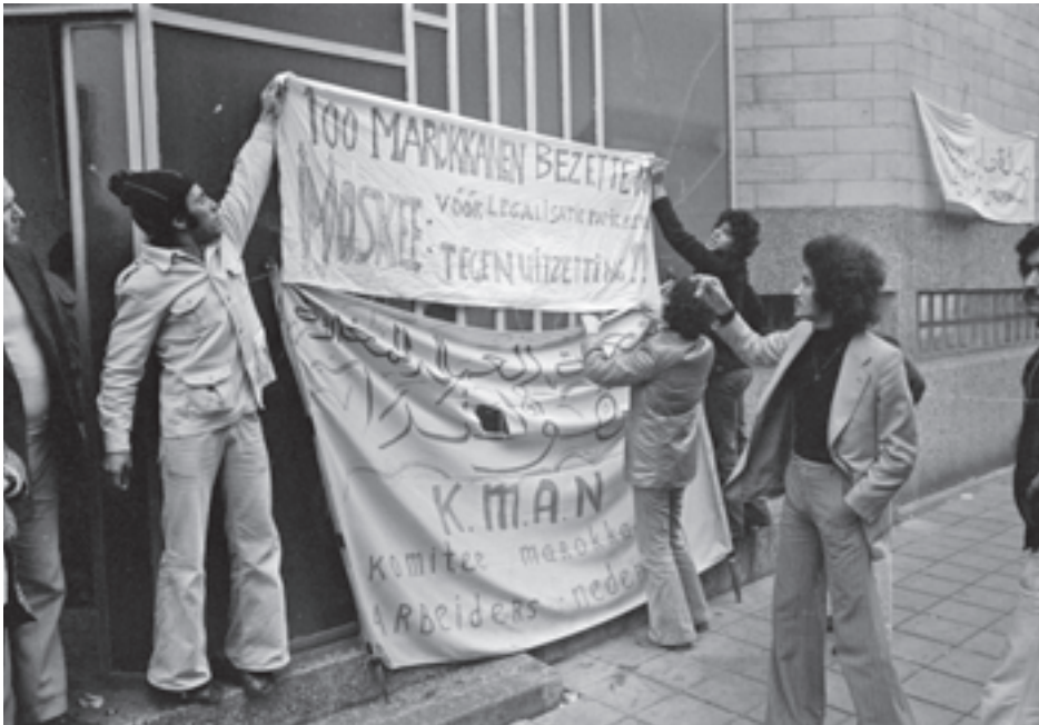
Islamitische moskee in Amsterdamse Van Ostadestraat bezet door Marokkanen uit protest tegen uitwijzing, 3 november 1975.

In 1975 kondigde de Nederlandse regering haar besluit aan om het illegale verblijf van buitenlandse arbeiders te legaliseren. Daarvoor dienden de arbeiders in het bezit te zijn van een geldig paspoort, voor 1 november 1974 naar Nederland te zijn gekomen en sindsdien ook in Nederland te hebben gewoond en gewerkt. Ze moesten voor 1 november 1975 hun legalisering in orde krijgen. Op basis van deze maatregel ontvingen bijna 15.000 buitenlandse arbeiders een verblijfsvergunning, maar dat gold niet voor iedereen. 48 De eerste voorwaarde – een geldig paspoort – vormde het grootste probleem voor Marokkaanse arbeiders. Velen waren met een vals paspoort naar Nederland gekomen en dit werd uiteraard niet erkend door het Marokkaanse consulaat. Voor Marokkaanse arbeiders was het vrijwel onmogelijk om aan een verblijfsvergunning