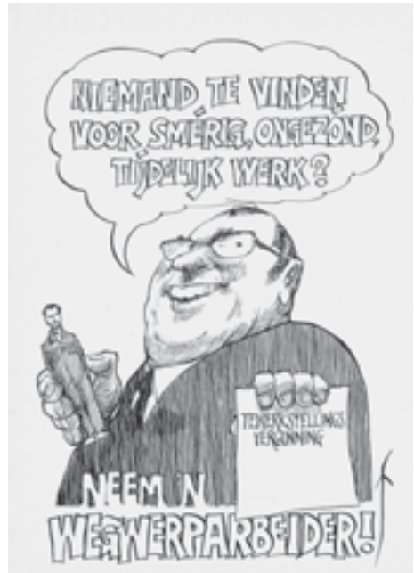
De kerk-Marokkanen protesteerden tegen de slechte werkomstandigheden van buitenlandse arbeiders (Frits Müller/ Motief , november 1975).