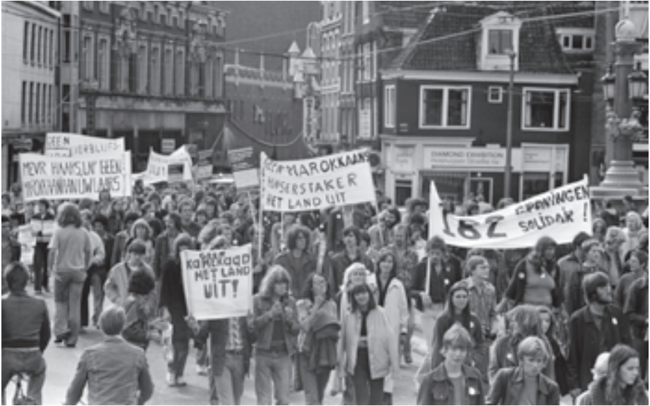
Demonstratie en manifestatie ter ondersteuning van de 182 met uitzetting bedreigde Marokkanen, 26 augustus 1978.