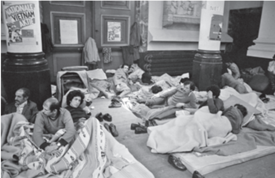
Marokkanen in Mozes en Aäronkerk in Amsterdam, 16 november 1975.