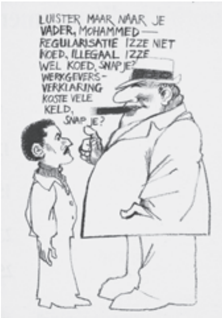
De kerk-Marokkanen protesteerden onder andere tegen de koppelbazen die weigerden een werkgeversverklaring uit te geven ( Motief , september 1975).