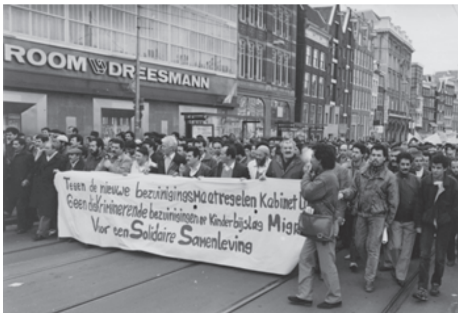
In Amsterdam gingen Marokkanen de straat op om te demonstreren tegen de in hun ogen discriminerende kinderbijslagregeling, ca. 1980.