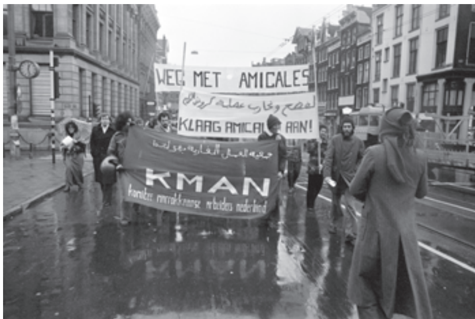
Op 20 november 1977 organiseerde het KMAN een manifestatie tegen de onderdrukking van het Marokkaanse regime en zijn handlangers in Nederland.

Later in dat jaar, in september 1977, was de oprichting van een afdeling van het KMAN in Rotterdam aanleiding voor een vijandige confrontatie tussen de beide organisaties. In Rotterdam, waar ook een consulaat gevestigd was, hadden sinds jaar en dag de Amicales een sterke greep op de Marokkaanse arbeiders. In samenwerking met de Stichting Hulp Buitenlandse Werknemers Rijnmond organiseerde het KMAN op 17 september in de Rotterdamse De Doelen een feest ter gelegenheid van het einde van de vastenmaand Ramadan. Nog voor het feest begon maakten de Amicales de bezoekers wijs dat in het toneelstuk, dat die avond opgevoerd zou worden, iemand van het Polisario zou optreden. Bezoekers en leden van de muziekgroep die ook zou optreden werden bedreigd en geïntimideerd.