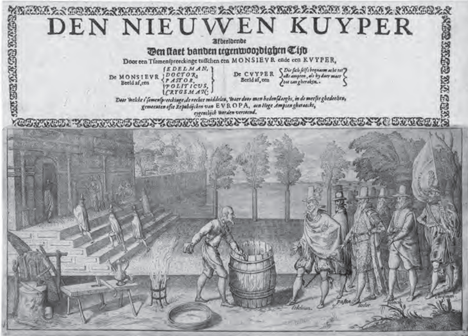
Afb. 5 Allegorische voorstelling bij het gedicht 'Den Nieuwen Cuyper' van J.J. Starter uit 1626, over het ambtsbejag van zijn tijd. Een kuiper spreekt met een edelman, een pastor, een doctor, een politicus en een krijgsmann. Links gaan lieden die door middel van kuipen een ambt hebben verworven de trap op naar een regeringsgebouw.

Staten) door een monistische 132 (de Staten werden zowel 'regering' als soevereine 'volksvertegenwoordiging'). Juist deze combinatie van ingrijpende veranderingen had verstrekkinge gevolgen. Met eigen én vorstelijk gezag bekleed, hadden de Staten absoluter macht dan menige, zo niet iedere vorst. Tot dan toe hadden stadhouders en Hof als vertegenwoordigers van de landsheer de ambtenaren benoemd, maar nu was deze benoemingsmacht gekomen aan de Staten, een vergadering van een groot aantal volmachten, die allen een stem in het kapittel hadden. Met andere woorden: de volmachten vormden niet alleen samen de sollicitatiecommissie, maar konden elk voor zich ook sollicitant zijn. En aangezien er altijd meer gegadigden dan ambten waren, gaf deze omstandigheid aanleiding tot ingewikkelde factievorming en 'kuiperijen'. Daarbij moest een gegadigde voor een ambt – bijvoorbeeld het felbegeerde ambt van Gedeputeerde Staat – de stemmen van 'vrienden' verzamelen, zoals een kuiper duigen samenbrengt om een vat te kunnen maken. 133 De