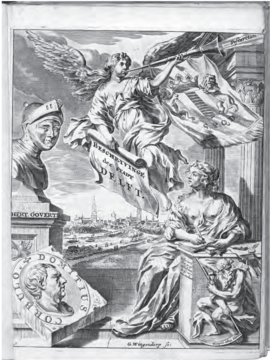
Afb. 34 Titelpagina van Dirck van Bleyswijcks beschrijving van Delft (1667).