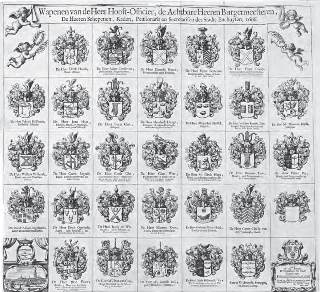
Afb. 24 Wapenkaart van de bestuurders en hoge ambtenaren van Enkhuisen die hoorde bij Gerard Brandts geschiedenis van die stad (1666).