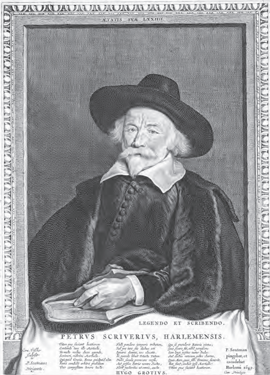
Afb. 26 Portret van Petrus Scriverius (1576-1660) op 74-jarige leeftijd door Pieter Soutman (1649).