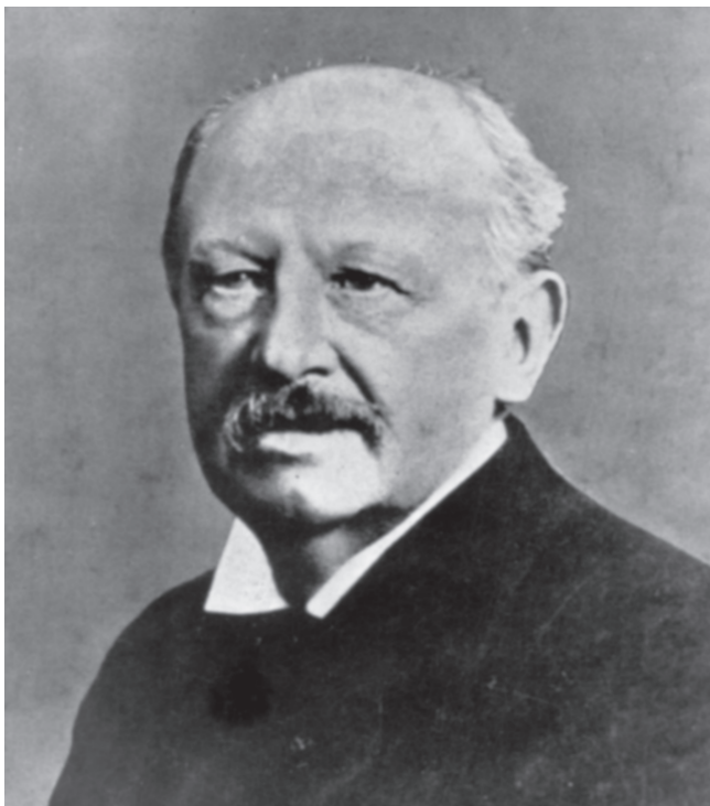
Foto rond 1900 van Hendrik Goeman Borgesius (1847-1917), jarenlang liberaal Kamerlid, minister van Binnenlandse Zaken (1897-1901), in 1905 kabinetsformateur en ten slotte voorzitter van de Tweede Kamer (1913-1917). Vooraanstaand liberaal politicus, na 1893 fractieleider van de vooruitstrevende liberalen in de Tweede Kamer. Als Kamervoorzitter vermaard vanwege zijn versprekingen.

In de daaropvolgende jaren werd er in de Tweede Kamer niet meer gesproken over het gewijzigde reglement van orde. 74 Drie jaar later, in 1904, stond echter in het voorlopig verslag over de begroting voor 1905 dat enkele leden bezwaar hadden tegen de instelling van een permanent voorzitterschap van de ministerraad. Het bezwaar luidde dat ‘allicht de Minister die voorzit, grooteren invloed en eene hoogere positie verkrijgt dan de andere Ministers’. Andere leden hadden echter opgemerkt dat een permanente voorzitter juist bevorderlijk was voor een goede gang van zaken en dat het in de regel wel de kabinetsformateur zou zijn die het beleid zou coördineren. 75