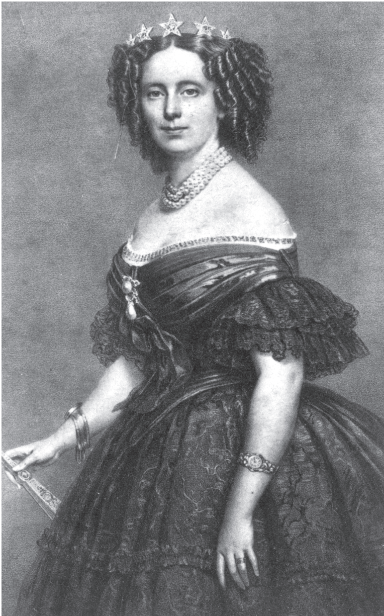
Een foto uit 1868 van koningin Sophie (1818-1877), eerste gemalin van koning Willem III. Haar beide zonen overleden niet lang na hun moeder (in 1879, resp. 1884) en brachten daardoor de monarchie aan het wankelen.