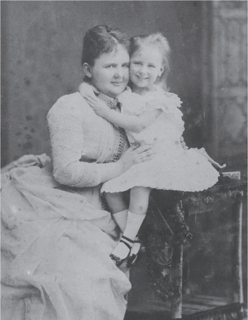
Koningin Emma (1858-1934) en prinses Wilhelmina (1880-1962) in 1884 samen op de foto. In dit jaar werd voorzien in een vrouwelijke troonopvolging. De jonge Duitse Emma had koning Willem III toch nog een nakomeling weten te schenken en daarmee leek de continuering van het Huis van Oranje veiliggesteld.