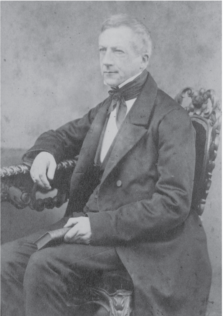
Foto van Guillaume Groen van Prinsterer (1801-1876), Tweede Kamerlid van 1849 tot 1866 en een belangrijk leider van de antirevolutionairen. Groen van Prinsterer ging behoedzaam om met de onrust in 1853 onder de orthodoxe protestanten.