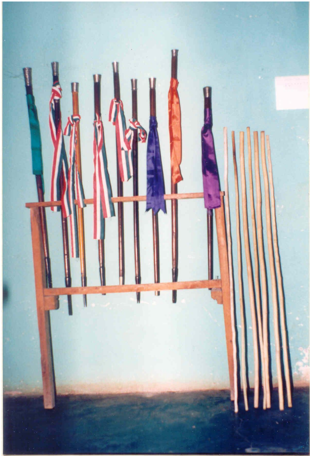
Bastones de las autoridades