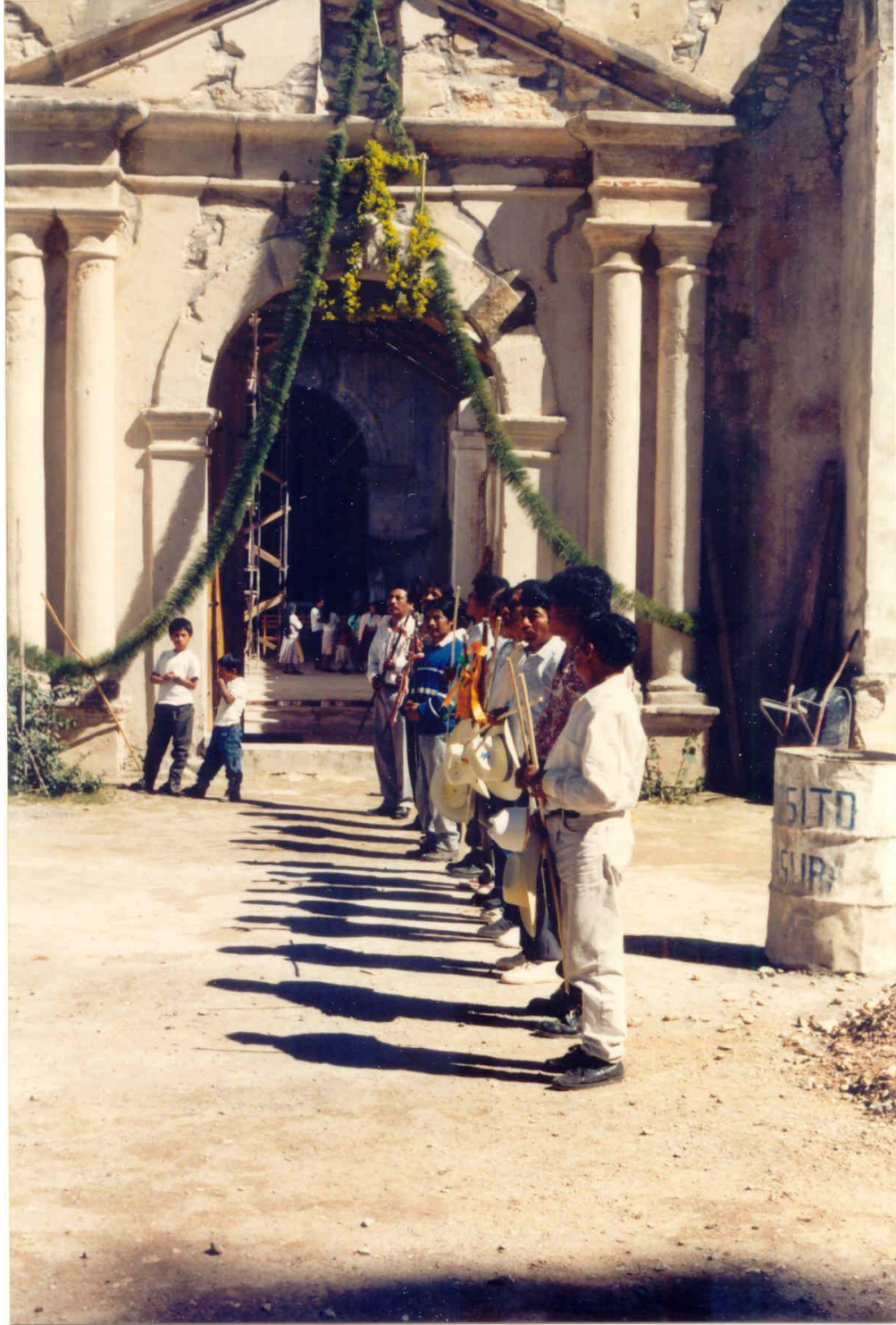
Autoridades de Apoala frente a la iglesia