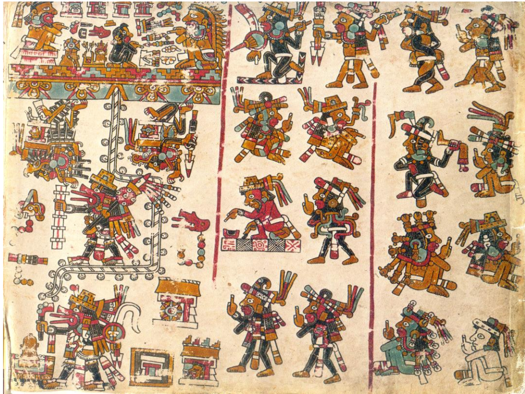
Códice Yuta Tnoho (Vindobonensis), p. 48: Señor 9 Viento desciende del cielo.