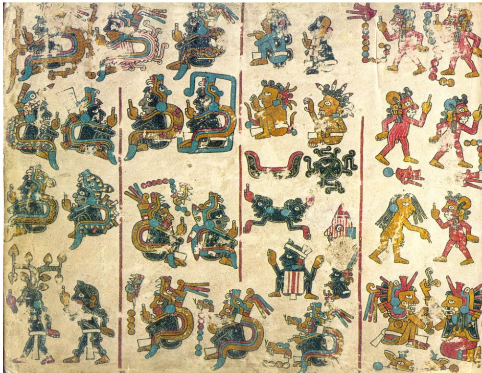
Códice Yuta Tnoho (Vindobonensis), p. 51: los primeros seres.