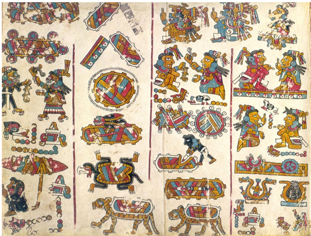
Códice Yuta Tnoho (Vindobonensis), p. 49: nacimiento del Señor 9 Viento.