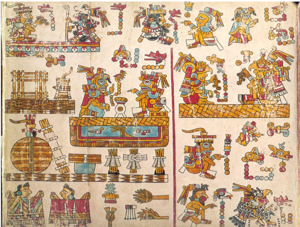
Códice Yuta Tnoho (Vindobonensis), p. 35: matrimonio en Apoala.