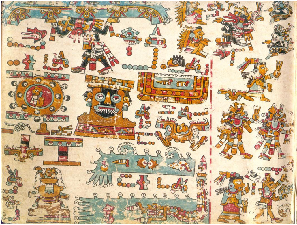
Códice Yuta Tnoho (Vindobonensis), p. 47: Señor 9 Viento reparte el agua del cielo a los pueblos de la Mixteca.