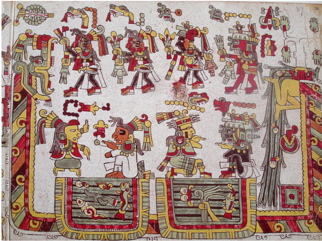
Códice Tonindeye (Nuttall), p. 36: valle de Apoala