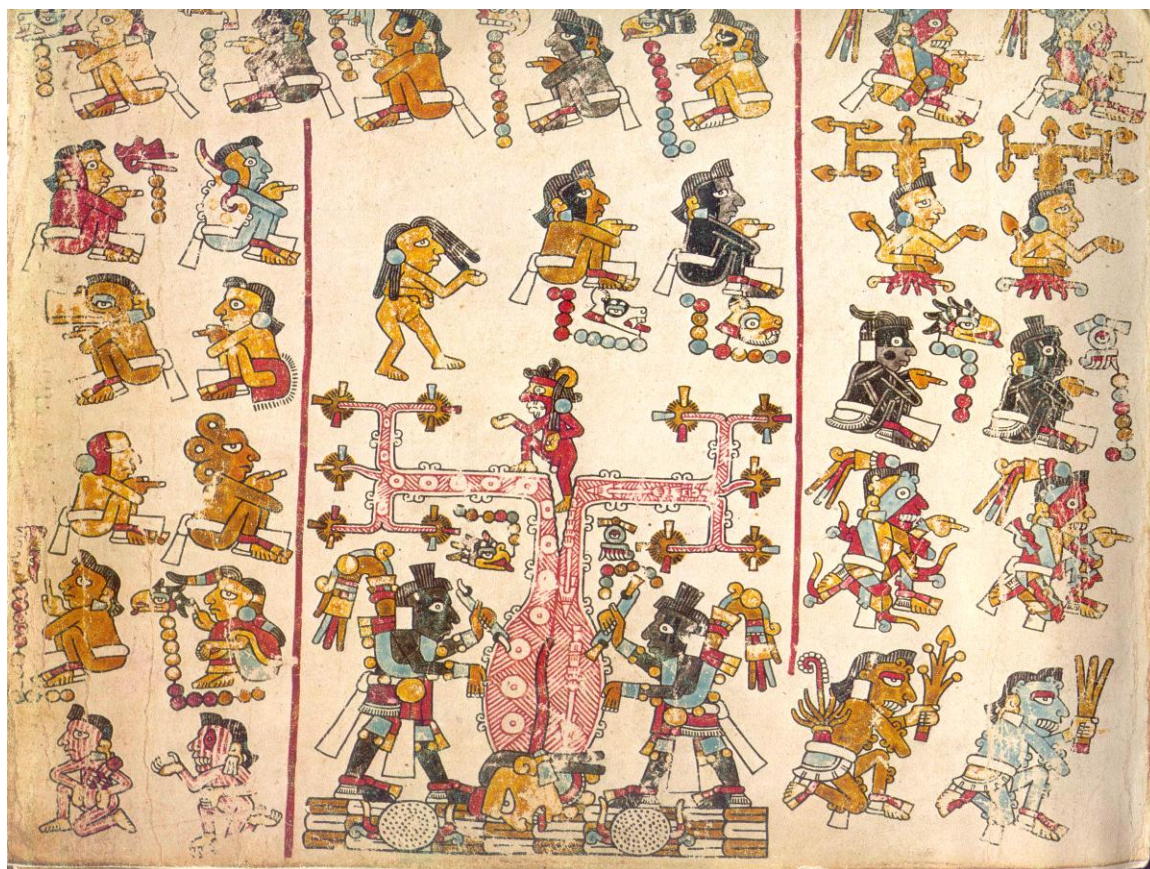
Códice Yuta Tnoho (Vindobonensis), p. 37: el árbol de Apoala.