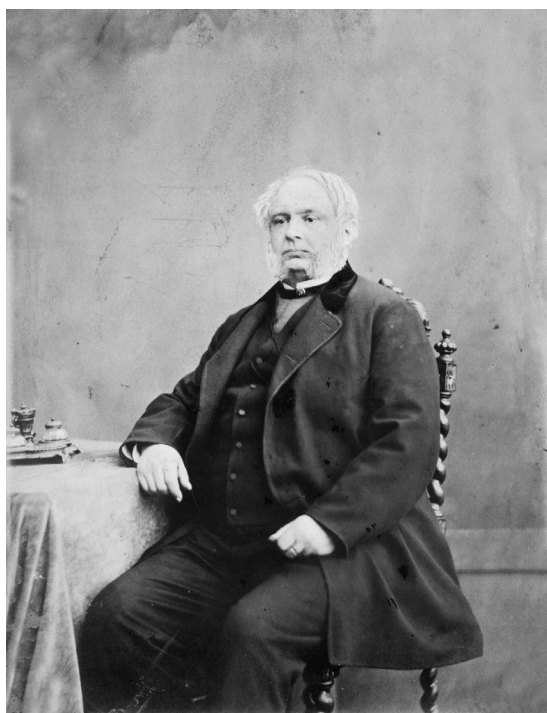
Boven: A.E.J. Modderman (1838-1885), hoogleraar strafrecht en minister van Justitie.