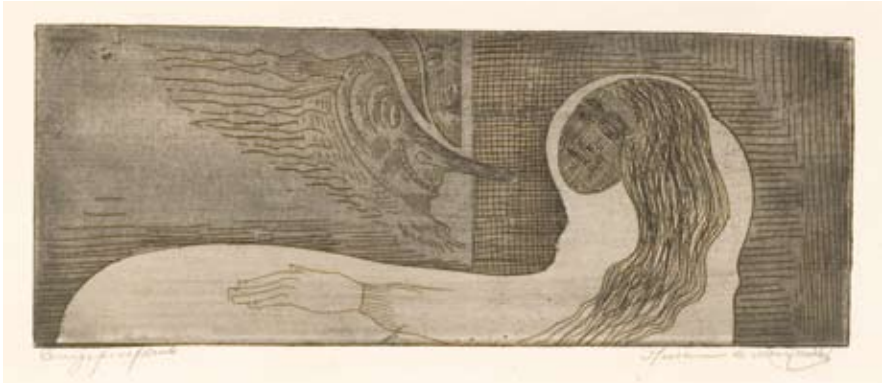
Afb. 62 Fantasie: angstig kijkende man , 1915 litho 240 x 300 mm L 011