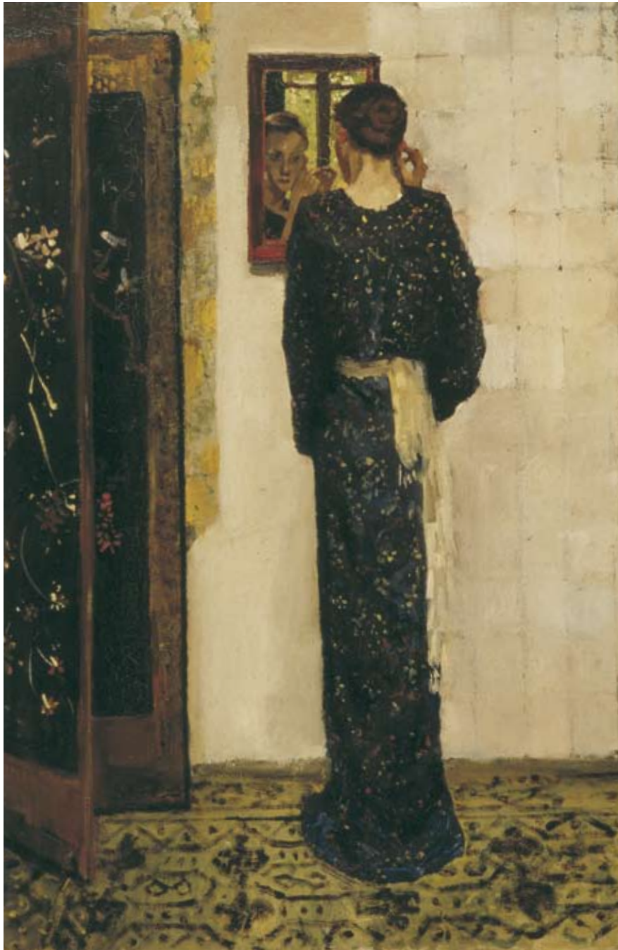
Afb. 37 G.H. Breitner, Het oorringetje , 1893 olieverf op doek 845 x 575 mm