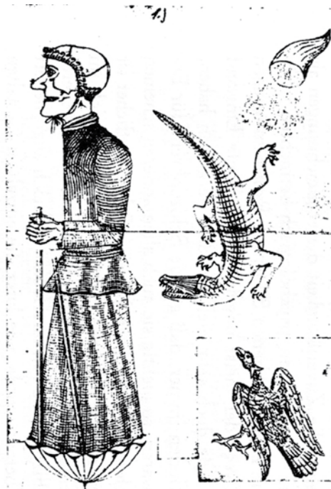
Afb. 67 Afbeelding van een tekening uit 'Bildeneri der Geisteskranken' August Neter, Heks met adelaar , potlood, 200 x 250 mm