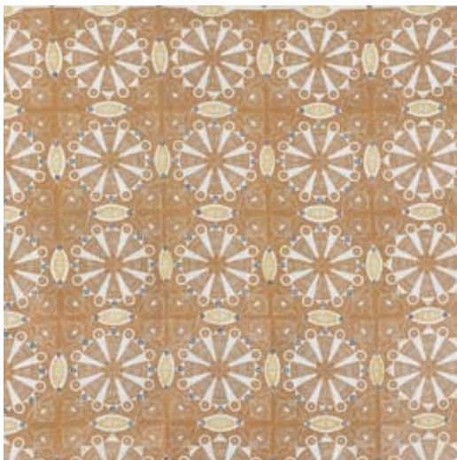
Afb. 43 Tafelkleed , 1899 met houtblok en stempels bedrukt linnen, 1150 x 1380 mm