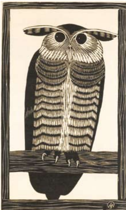
Afb. 53 Hoornuil , 1915, houtsnede, II/II 372 x 224 mm, H 072