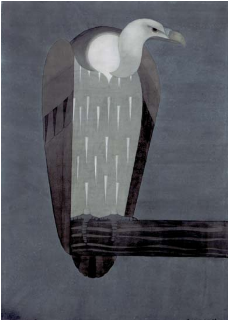
Afb. 58 Gier, 1927 waterverf 574 x 422 mm