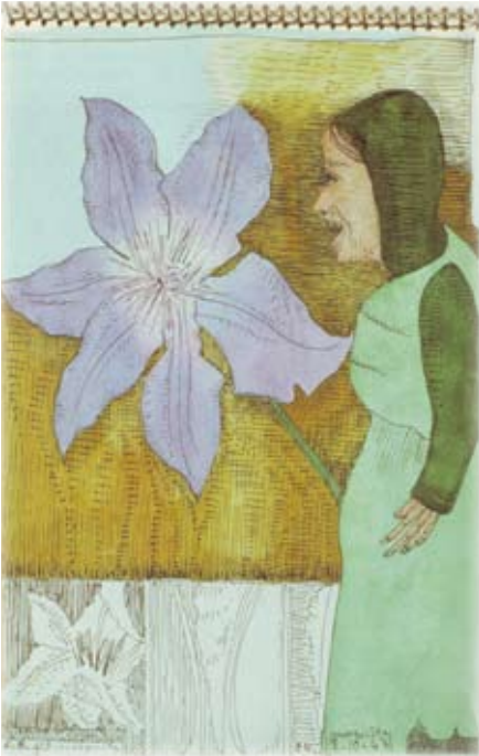
Afb. 66 Schetsboekblad met vrouwengestalte en clematis , 6 juni en 8 oktober 1943, pen en inkt, waterverf op papier 228 x 149 mm