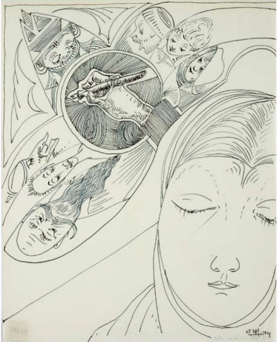
Afb. 65 Schetsboekblad met hoofd en teke- nende hand, 27 maart 1942 pen en blauwe inkt op papier 260 x 208 mm