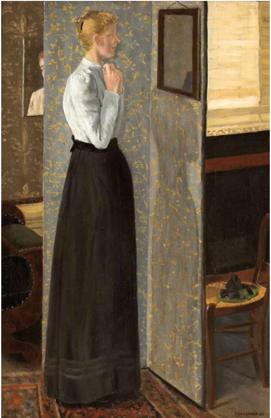
Afb.36 Voor de spiegel, 1894 olieverf op doek 600 x 385 mm