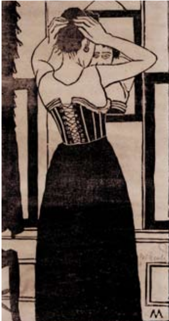
Afb. 41 Voor de spiegel , circa 1899 houtsnede, gewas- sen met waterverf of inkt, 270 x 142 mm H 015