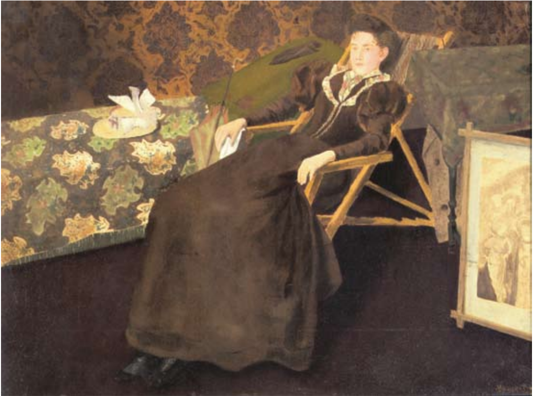
Afb. 38 Vrouw in ligstoel, circa 1895 olieverf op paneel 455 x 620 mm