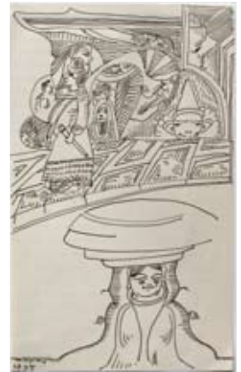
Afb. 64 Negen bladen uit een schetsboek, 1941 pen en inkt op gelinieerd papier elk blad: 205 x 126 mm