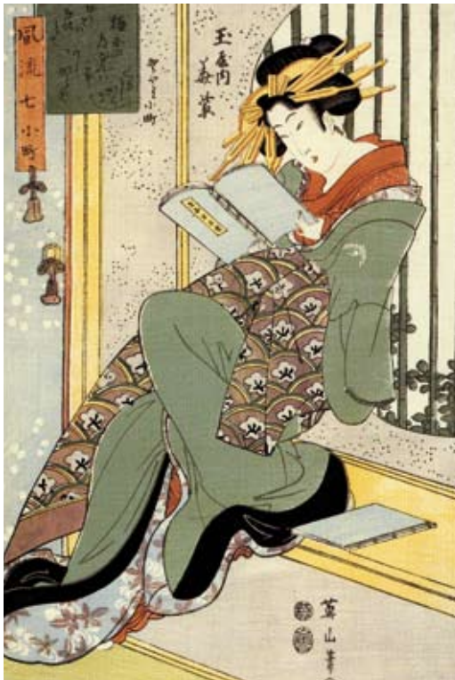
Afb. 39 Kikugawa Eizan (1787-1867), Komachi op de stupa - De courti- sane Hanashiba uit het huis Tamaya, circa 1812 houtsnede 375 x 248 mm