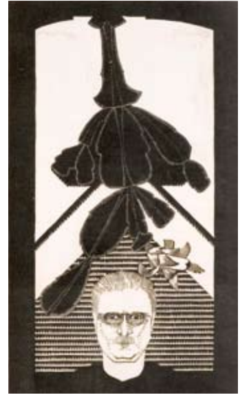
Afb.33 Cactus met zelfportret , 1926-1929 houtsnede, II/VI, 381 x 216 mm, H 120