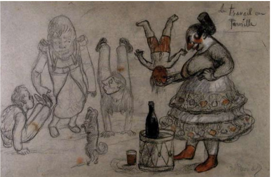
Afb. 68 Pierre Puvis de Chavannes, Le travail de famille , niet gedateerd zwart en rood krijt, met wit gehoogd, op grijs Ingres-papier, 302 x 469 mm