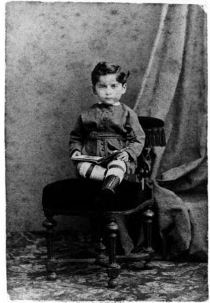
Afb. 27 Samuel Jessurun de Mesquita, circa 1871