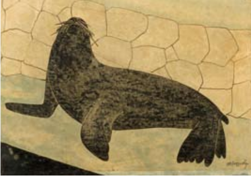
Afb. 10 Zeeleeuw , circa 1912, zwarte inkt en waterverf op transparant papier, opgeplakt op karton, gedeeltelijk geschuurd, 198 x 287 mm