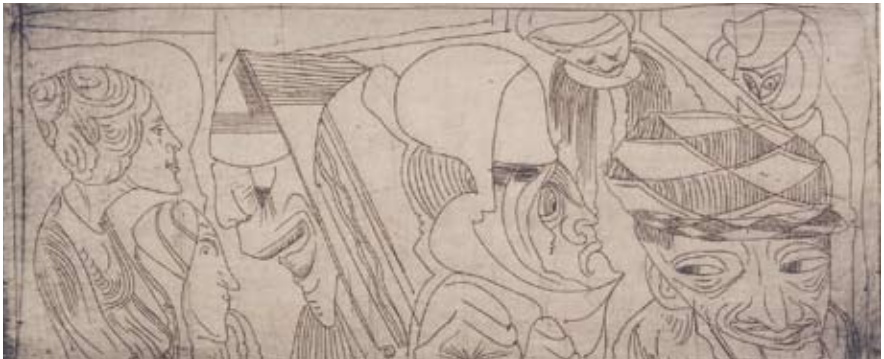
Afb. 17 Fantasie: diverse figuren, 1927 ets, 99 x 234 mm D 120

De Mesquita's etsen hebben zeker in de beginjaren soms een meer schetsmatig karakter, waarbij naast de lijn ook gradaties van tonen van belang zijn ( afb. 16 ). Maar ook in de etsen gaat gaandeweg de heldere, strakke lijn domineren boven arceringen en plaattoon. Parallel aan deze verandering ontstaan na 1917 nog maar weinig dieren, mensen en planten en bloemen in de etstechniek. De ets is vanaf dan voornamelijk voorbehouden aan de gefantaseerde voorstellingen ( afb. 17 ).