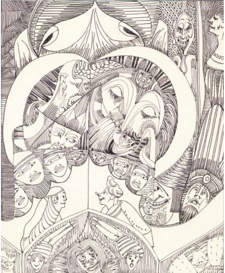
Afb. 14 en 15 Twee bladen uit een schetsboek, oktober-november 1942, pen en inkt 264 x 215 mm

In de laatste nacht van januari 1944 werden De Mesquita, zijn vrouw en zoon uit hun bed gelicht en op transport gesteld. Samuel en Betsie werden waarschijnlijk direct na aankomst in het concentratiekamp Auschwitz naar de gaskamers gebracht. De precieze datum van hun overlijden is niet bekend. Hun zoon Jaap stierf op 30 maart 1944 in Theresienstadt.