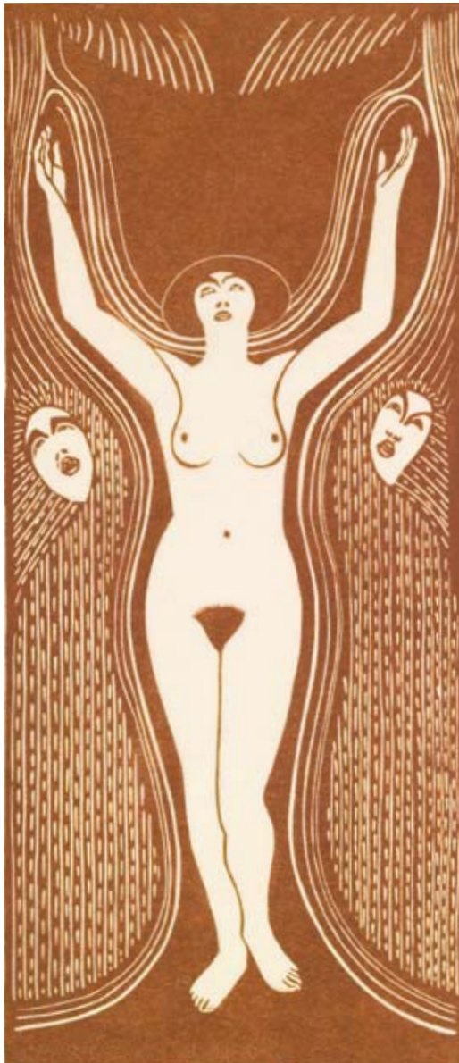
Afb. 30 Extase , 1922 houtsnede, V/II 320 x 138 mm H 102

deel is een werk van hem afgebeeld: de prent Extase , in de catalogus gedateerd in 1914, maar waarschijnlijk ontstaan in 1922, is opgenomen in de sectie 'Zielestaten' (afb. 30). 44 Kunstenaren der idee maakt inzichtelijk hoe weinig specifiek en hoe onbepaald het beeld van Jessurun de Mesquita dertig jaar geleden was. Het beeld dat wordt gegeven van zijn contacten met andere kunstenaars is zeer vaag en algemeen gehouden: "Werkt samen met Toorop, Roland Holst, Thorn Prikker en Van Konijnenburg." Het zijn vier van de belangrijkste kunstenaars van rond 1900 die hier worden genoemd. 45 De Mesquita zal deze kunstenaars en/of hun werk zeker hebben gekend maar van een specifieke samenwerking met hen is mij weinig tot niets gebleken. Namen van collega-kunstenaars die in relatie tot zijn