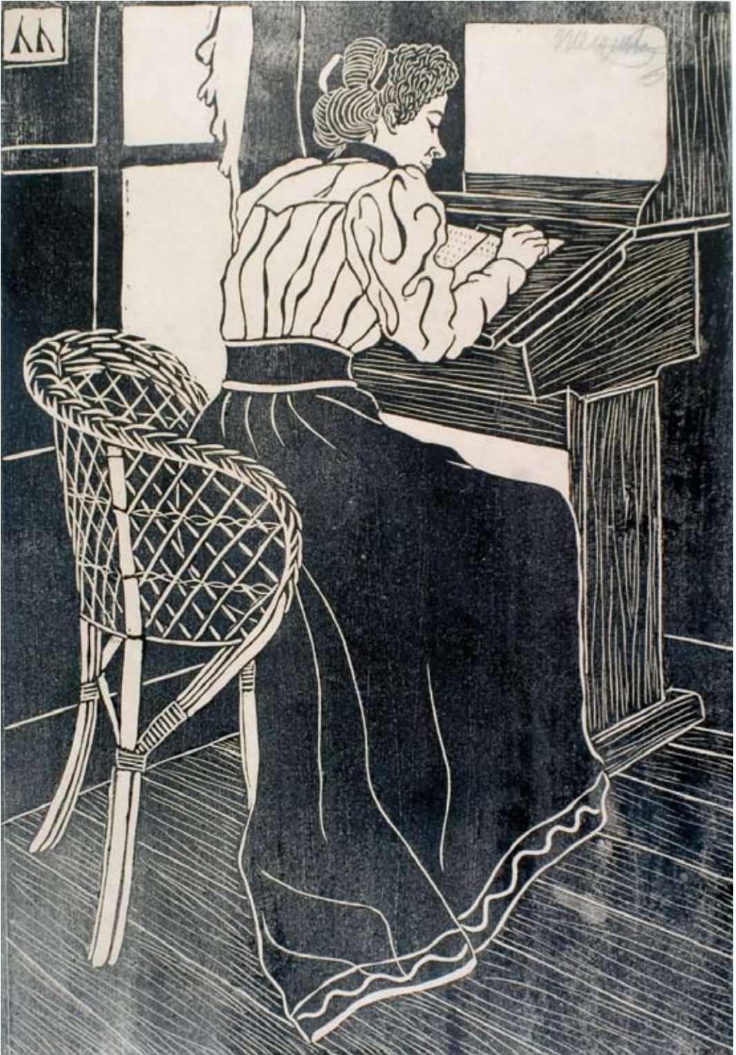
Afb. 31 Brieffschrijven (aan 't bureau), circa 1899 houtsnede, 354 x 247 mm, H 016