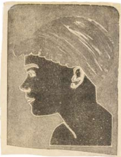
Afb. 22 Profiel naar links , circa 1900 litho via hoogdruk en mogelijk cliché 305 x 223 mm, A 021