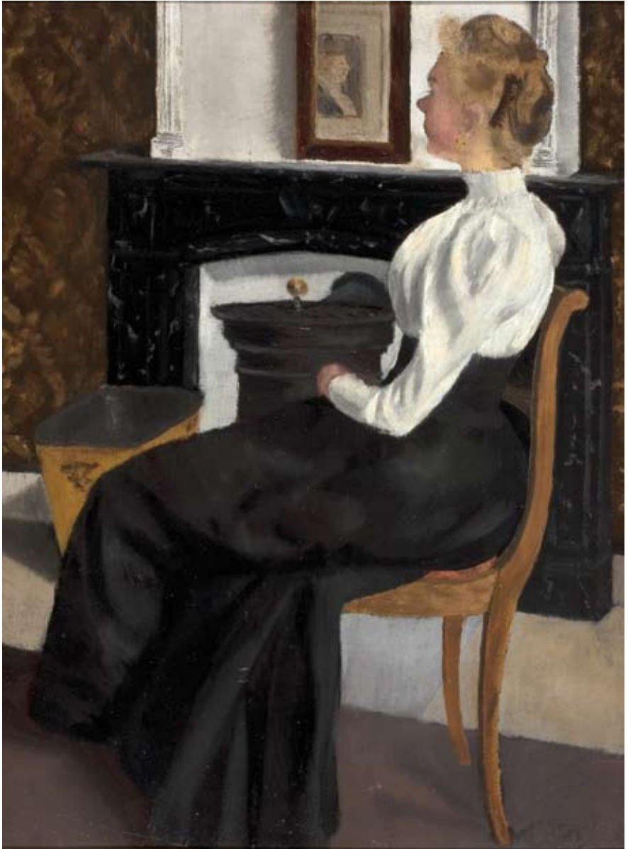
Afb. 6 Zittende vrouw, circa 1898 olieverf op paneel 395 x 285 mm