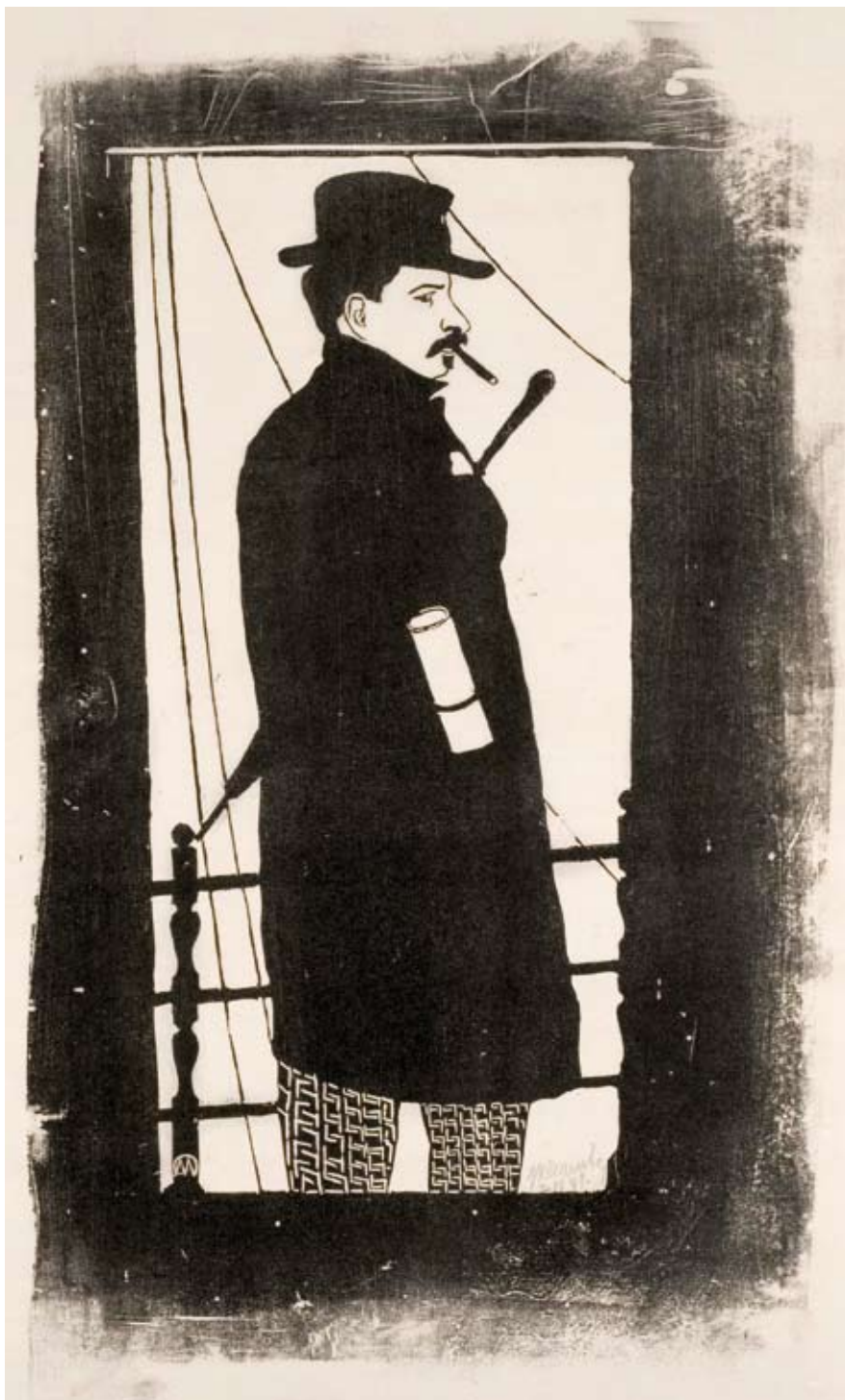
Afb. 1 Zelfportret met jas en hoed , circa 1897 houtsnede, II/II 383 x 183 mm (beeldmaat) H 003