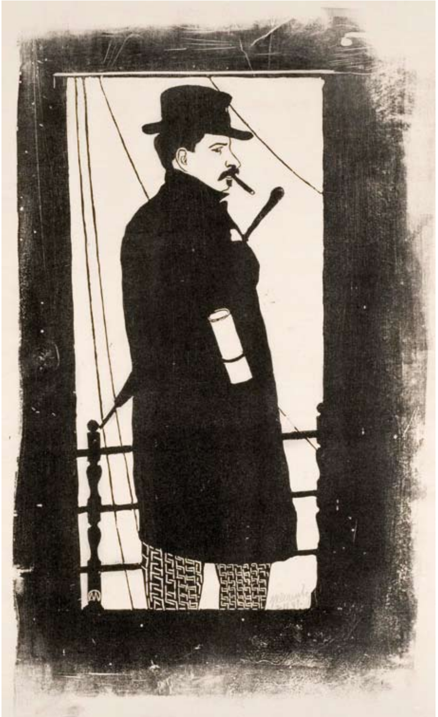
Afb. 1 Zelfportret met jas en hoed , circa 1897 houtsnede, II/II 383 x 183 mm (beeldmaat) H 003