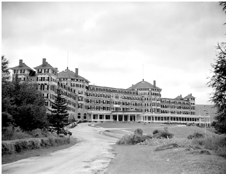
Mount Washington Hotel in Bretton Woods.