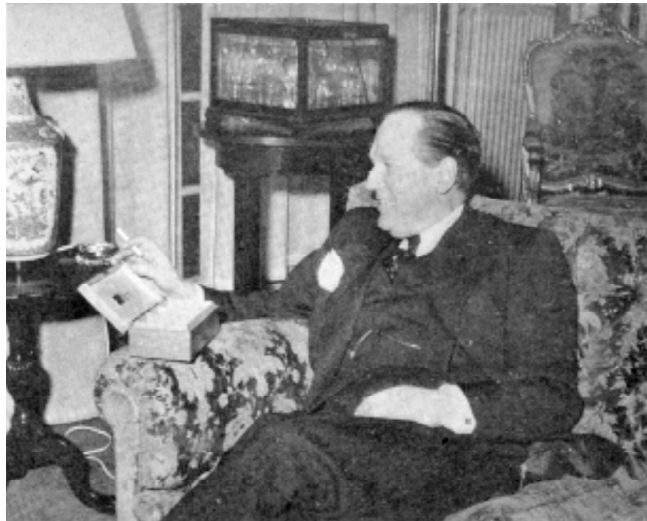
Beyen met sigarettenkistje gemaakt van hout uit de bossen bij Bretton Woods.

in een advies om zelfmoord te plegen. 372 Hoe diep de kwestie van het voortbestaan van de BIS hem had geraakt, blijkt uit zijn autobiografie, die veelbetekenend eindigt met een lofprijzing van de ze internationale bankinstelling als centrum van samenwerking tussen centrale banken, ook na de Tweede Wereldoorlog. 373