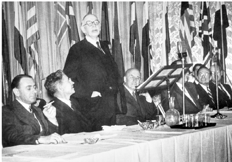
Keynes tijdens de conferentie van Bretton Woods.

van Duitsland. Hij was bovendien niet vergeten hoe de BIS had meegelopen bij de roof van het Tsjechoslowaakse goud nadat de Duitsers Praag waren binnengemarcheerd. De BIS moest dus verdwijnen, vond de Amerikaan, en snel ook. 364