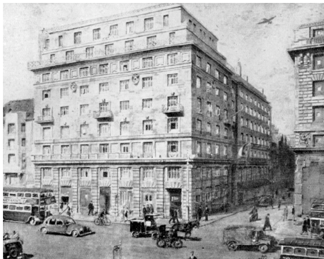
Stratton House, de zetel van de Nederlandse regering in ballingschap in Londen.

toekomst van het naoorlogse Nederland en van Europa richtte.