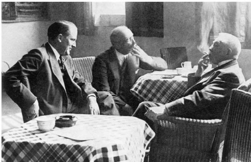
Beyen met Trip (midden) en Colijn op de Londense conferentie van 1933.