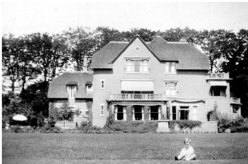
De villa die Beyen eind jaren dertig liet bouwen in Heemstede.

gekend diepe economische crisis overwonnen zou kunnen worden.