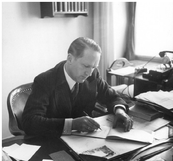
Beyen als president van de Bank voor Internationale Betalingen in Bazel in 1937.

tegen de zomer niet meer aan haar financiële verplichtingen voldoen. Dit was niet zo maar een bank, maar een financiële draaischijf voor de kredietverlening van West- aan Centraal-Europa. De deconfiture van de Credit Anstalt, die nauwe banden onderhield met grote banken in West-Europa (onder meer in Nederland) en in de Verenigde Staten, had daarom een verstreckende betekenis. 25