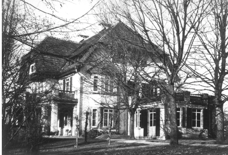
‘Zum weissen Segel’, de villa van de Beyens in Arlesheim bij Bazel.

hij heel goed dat hij de BIS niet alleen met commerciële ogen moest bekijken. Niet voor niets onderschreef hij dat de taak van de BIS “als knooppunt der circulatiebanken [...] de belangrijkste, de natuurlijkste en ook de meest hoopvolle is”. Maar de bancaire functie die de instelling ook had – en zelfs moest hebben, al was het maar wegens de “standing” – baarde hem als voormalig handelaar zorgen. De inkomsten uit de goudtransacties, waar de bancaire kant van de BIS toen van afhankelijk was, konden de kosten van het apparaat bij lange na niet dekken. Zelfs de noodzakelijke inkrimping van de staf zou de banktransacties nog niet lonend maken. Beyen zag het uitbreiden van de “natuurlijke business” als een van zijn eerste taken. Want zou het eenmaal tot een regeling voor internationale valutastabilisatie komen, dan zou dit de activiteiten van de BIS als bank direct raken en deze fors uitbreiden. Tegelijkertijd maakte hij zich sterk voor de ontwikkeling van de BIS als economische en monetaire databank, waarvan de aangesloten centrale banken profiteerden. Het is voor een belangrijk deel aan hem te danken dat de BIS zich op dit punt gezaghebbend ontplooië. 354