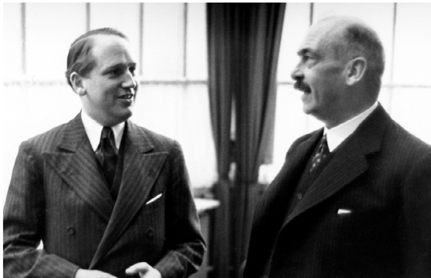
Beyen (links) met Trip.

L.J.A. Trip, de toenmalige thesaurier-generaal en latere president van De Nederlandsche Bank. Beyen werd in november 1918 zijn assistent. Ze deelden een Utrechtse achtergrond, hoewel de families Beyen en Trip elkaar slechts oppervlakkig gekend zullen hebben. Trip, toen begin veertig, was afkomstig uit een welvaarend rooms-katholiek milieu van kooplieden in bouwmaterialen. De familie – er is geen relatie met de invloedrijke protestantse Amsterdamse Trips – had zich begin negentiende eeuw in Utrecht gevestigd. Nog afgezien van het verschil in geloofsovertuiging, dat er zeker in Utrecht in het sociale verkeer nog lang toe deed 20 , gingen hoge ambtenaren en kooplieden in het algemeen niet vriendschappelijk met elkaar om. Wel zal men van elkaar hebben gehoord.