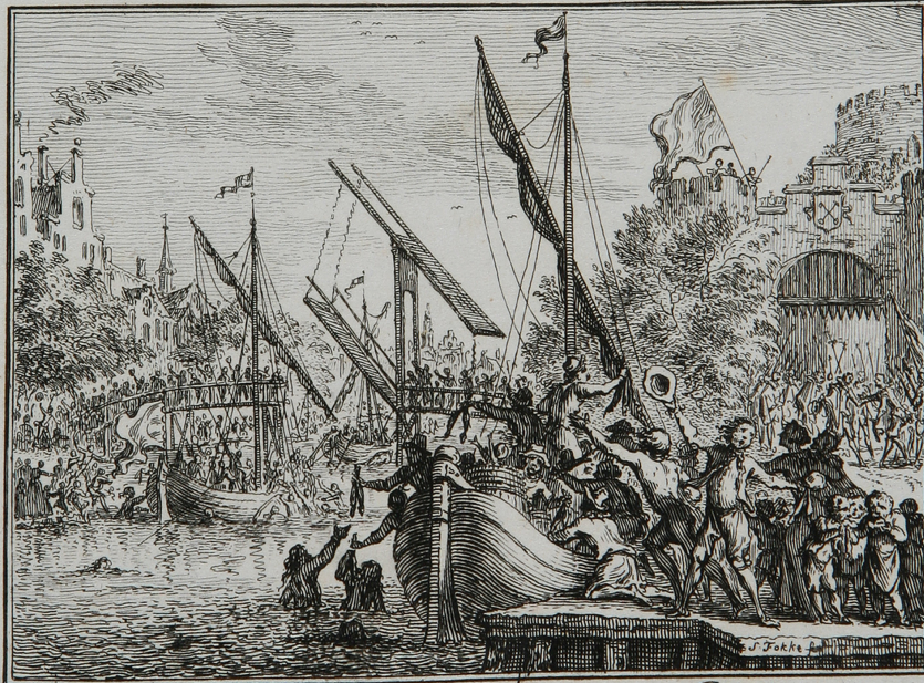
Ontzet van Leyden, den 3 Oct. 1574. Bladz. 65.

Leidens ontzet (1574). Afbeelding opgenomen in Te Waters De Vaderlandsche historie van den heere J. Wagenaar verkort.