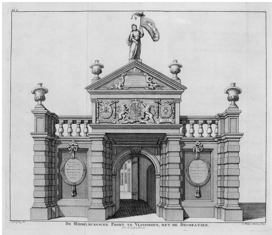
De Opstand als vrijheidsstrijd verbeeld in een erepoort (1772), de speciaal voor de gelegenheid versierde Middelburgse poort, één van de Vlissingse stadspoorten. Boven de poort een vrouwenfiguur die de Vrijheid uitbeeldt, met bovenop haar speer een hoed, het 'aloude ereteken van vrygelaten slaven'. De beginregel van het gedicht op de medaillons luidde: 'Hier dreef men Vyand uit en haalde Vrijheid in'. Deze afbeelding werd door Brahé opgenomen in zijn Vlissings eeuw-vreugde (1773).