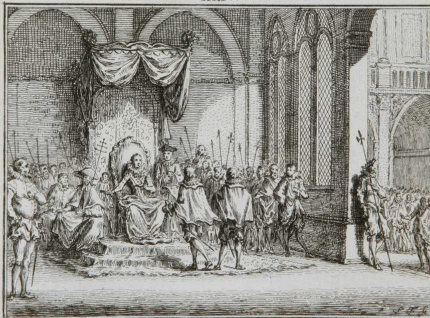
Overlevering in't Smeekschrift der Edelen, 1566. Pl. 188.

De edelen overhandigen hun Smeekschrift aan Margaretha van Parma. Afbeelding opgenomen in Te Waters De Vaderlandsche historie van den heere J. Wagenaar verkort.