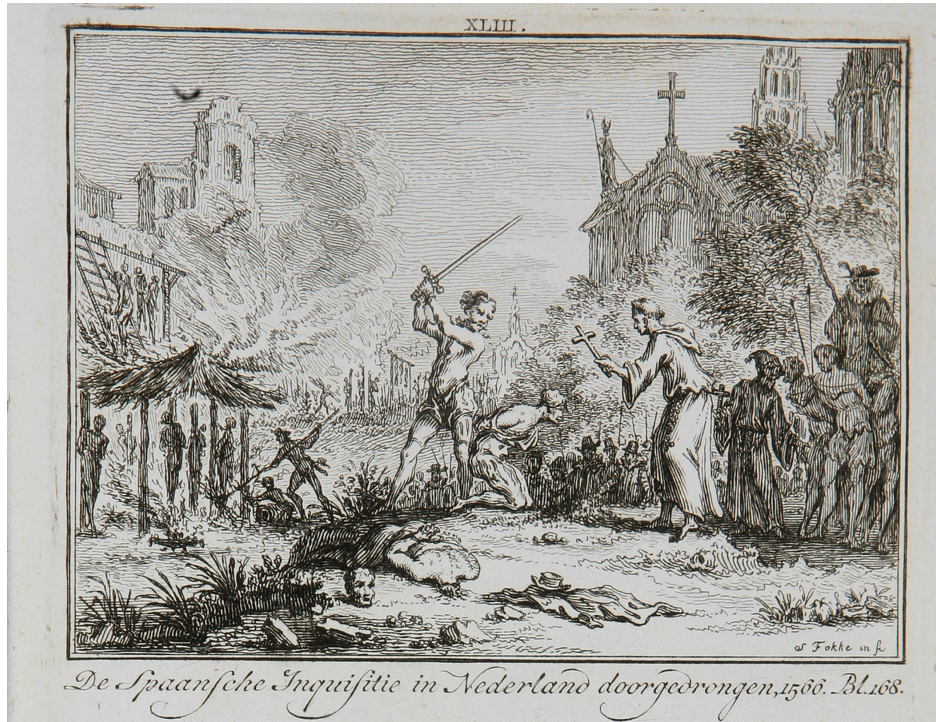
De Spaanse Inquisitie. Afbeelding opgenomen in Te Waters De Vaderlandsche historie van den heere J. Wagenaar verkort.