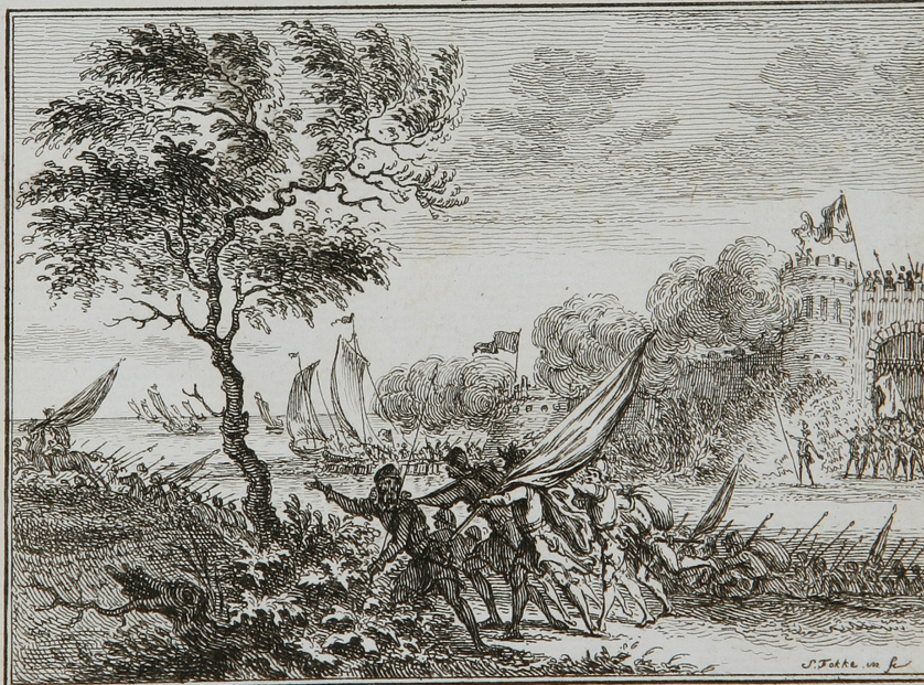
De Spaansche bezetting uit Vlissingen verdreven, 1572. Bladz. 326.

Bevrijding van Vlissingen (1572). Afbeelding opgenomen in Te Waters De Vaderland- sche historie van den heere J. Wagenaar verkort.