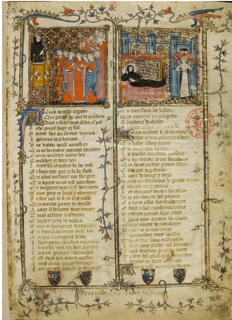
Die Pilgerfahrt zum Himmlischen Jerusalem

de negende trap verwijst naar de Engelen en het be kroonde leven in de Hemel, de beloning als liefdesgave. De tiende laag, die van chrysopraas, geeft het voortploeteren van de mens aan in zijn pogingen om het aardse leven op te geven terwille van het eeuwige. De elfde trede, die van hyacint, staat voor de lering van de gelovigen door priesters en theologen, die de mens van ijdele gedachten en depressie verlost. Tenslotte verwijst het amethyst van de twaalfde trap naar het purper van het pas vergoten bloed van Christus, de ultieme liefdedaad, de wijn van de Eucharistie en de martelaren die zo tot het gezelschap van de engelen zijn toegelaten.