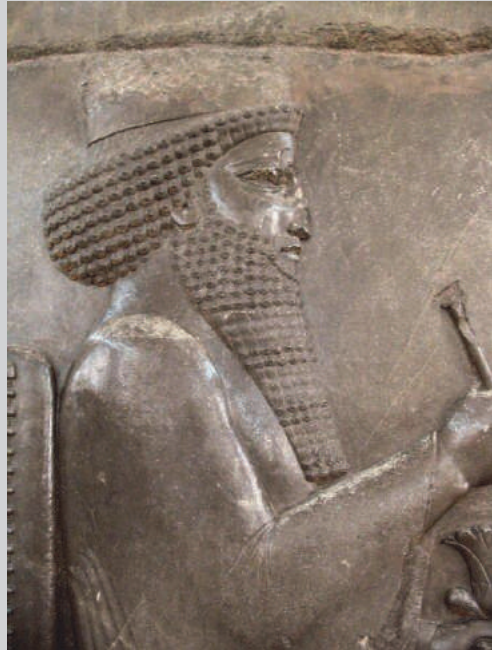
Afb. 3 Darius, afgebeeld op een reliëf-plaat in het paleis van Persepolis.

“verhalen” en gebeurtenissen, die klassieke auteurs volledig of ten dele onbekend waren. Deze ontdekkingen nodigen ons uit de politieke, sociale en culturele geschiedenis van het Perzische Rijk opnieuw te schrijven en een betere balans te vinden tussen externe en interne gezichtspunten. Daar waar de postkoloniale wending van de jaren '80 uitging van oudhistorici met een veelal klassieke opleiding, is de opwaardering van de lokale corpora als bron voor de Perzische geschiedenis een reactie uit (of misschien beter, een voortzetting door) de archeologie en een aantal vakgebieden met een traditioneel filologisch karakter, zoals de semitistiek, de papyrologie, de iranistiek, de assyriologie en de egyptologie.