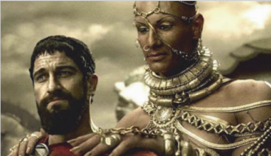
Afb. 1 Xerxes en Leonidas in de film 300 (Warner 2007).

Van alle Perzische koningen kwam Xerxes op de meest dramatische wijze met de Griekse wereld in conflict en het is Herodotus die van dat conflict de meest invloedrijke literaire verbeelding biedt. Mede door de Europese schooltraditie is dat beeld tot de dag van vandaag vertrouwd. Dit wil zeggen dat lang vóór assyriologen de opstand in Babylonië op het spoor kwamen in kleitabletten (vanaf de eerste helft van de 20 e eeuw), er al een idee bestond over wat voor koning Xerxes was.