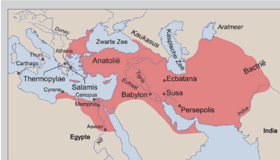
Afb. 2 Het Perzische Rijk tijdens de regering van Xerxes I.

Ook moet men zich realiseren dat Herodotus eeuwenlang gold als voornaamste bron over het Perzische Rijk, samen met andere klassieke schoolauteurs zoals Xenophon en Plato. De autoriteit van de Griekse auteurs was vanzelfsprekend en natuurlijk. Het was normaal om naar de Perzen te kijken door de ogen van omstaanders. Het was evident hen te beschrijven met de woorden van auteurs die in de marge van dit machtige rijk leefden, in vrees of bewondering ervoor, óf zelfs vele eeuwen later vanuit een eigen culturele en literaire beleving.