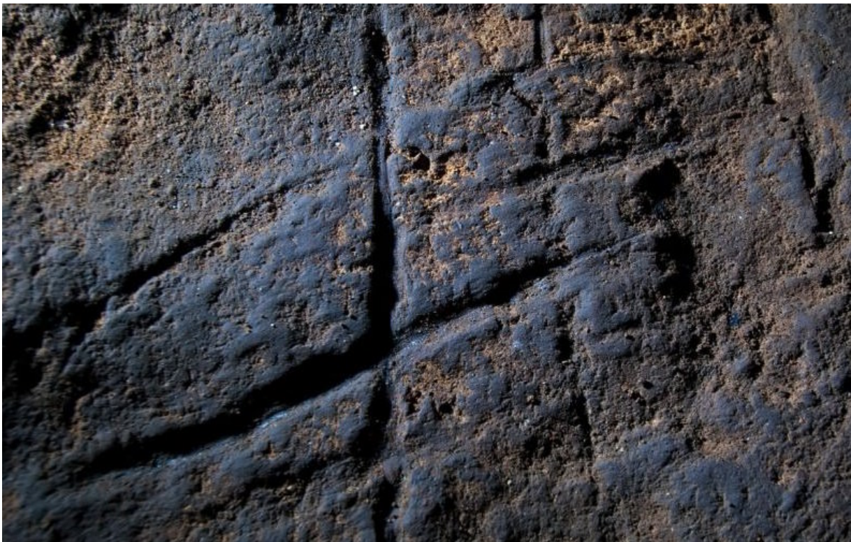
Neanderthaler 'hashtag' uit Gorham's Cave, Gibraltar.

In Gibraltar vonden archeologen in 2011 een gravure in de vorm van een hashtag . De gravure was bedekt door aardlagen die Neanderthaler-werktuigen bevatten. Dit betekent dat de gravure ouder is dan die aardlagen. Omdat moderne mensen zoals wij Gibraltar pas later bereikten, moet de hashtag door Neanderthalers zijn gegraveerd. Maar dit is er slechts één. Dus is het heel goed mogelijk dat het hier niet om kunst gaat, maar om willekeurige krassen.