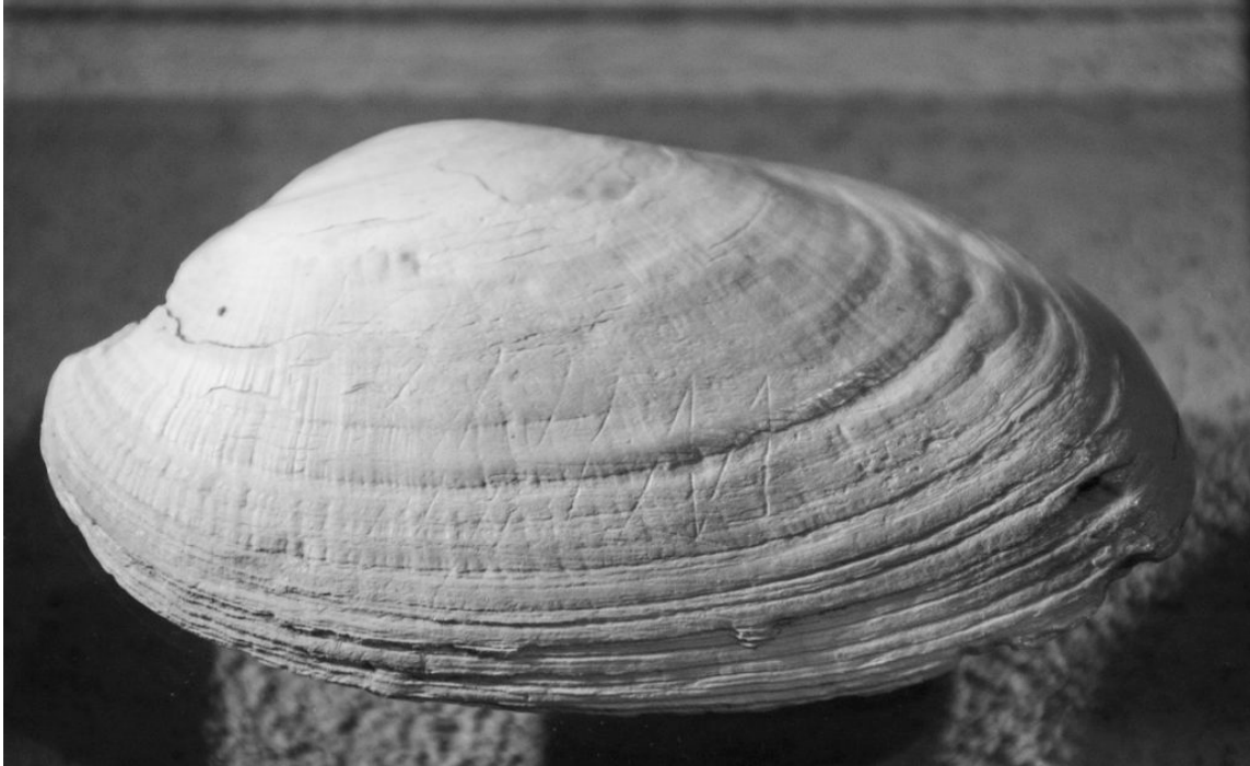
Door Homo erectus gegraveerde schelp met geometrische lijnen.

Die schelp was in de negentiger jaren van de negentiende eeuw verzameld in Indonesië door de ontdekker van Homo erectus , Eugène Dubois. Vooralsnog is dit echter een eenzame uitzondering. Misschien is er dus geen sprake van kunst, maar van verveeld krassen. Maar of deze vondst een uitzondering blijft, durf ik niet te voorspellen.