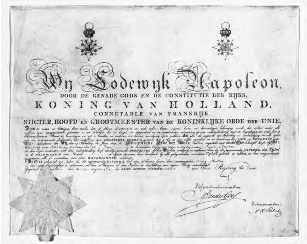
Diploma Grootkruis Orde van de Unie met handtekeningen van Lodewijk, Van der Goes en A.R. Falck