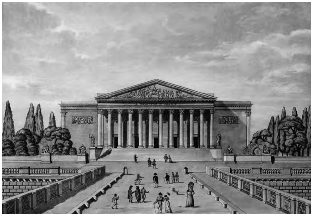
Gebouw van het Corps Législatif, ca. 1810