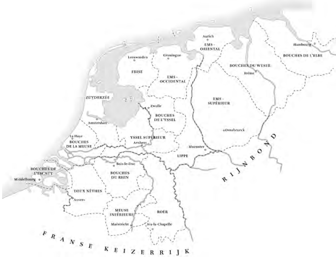
Nederland als deel van het Franse keizerrijk 1810-1813