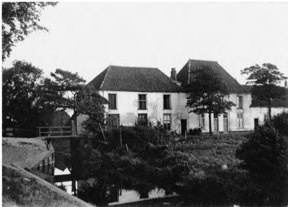
Buitenplaats Oostbroek, Loosduinen, toestand 1929