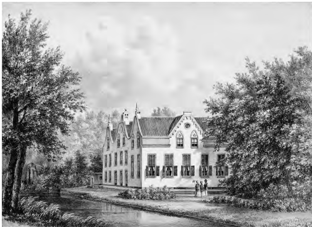
Huis Ter Noot aan de Bezuidenhoutseweg, ca. 1855. Hier woonde Van der Goes na zijn terugkeer uit Parijs tot zijn dood in 1826