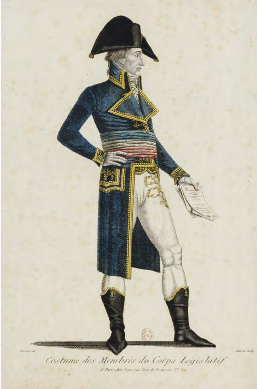
Costume des Membres du Corps Législatif.

A Paris chez Jean, rue Jean de Beauvais N° 32.