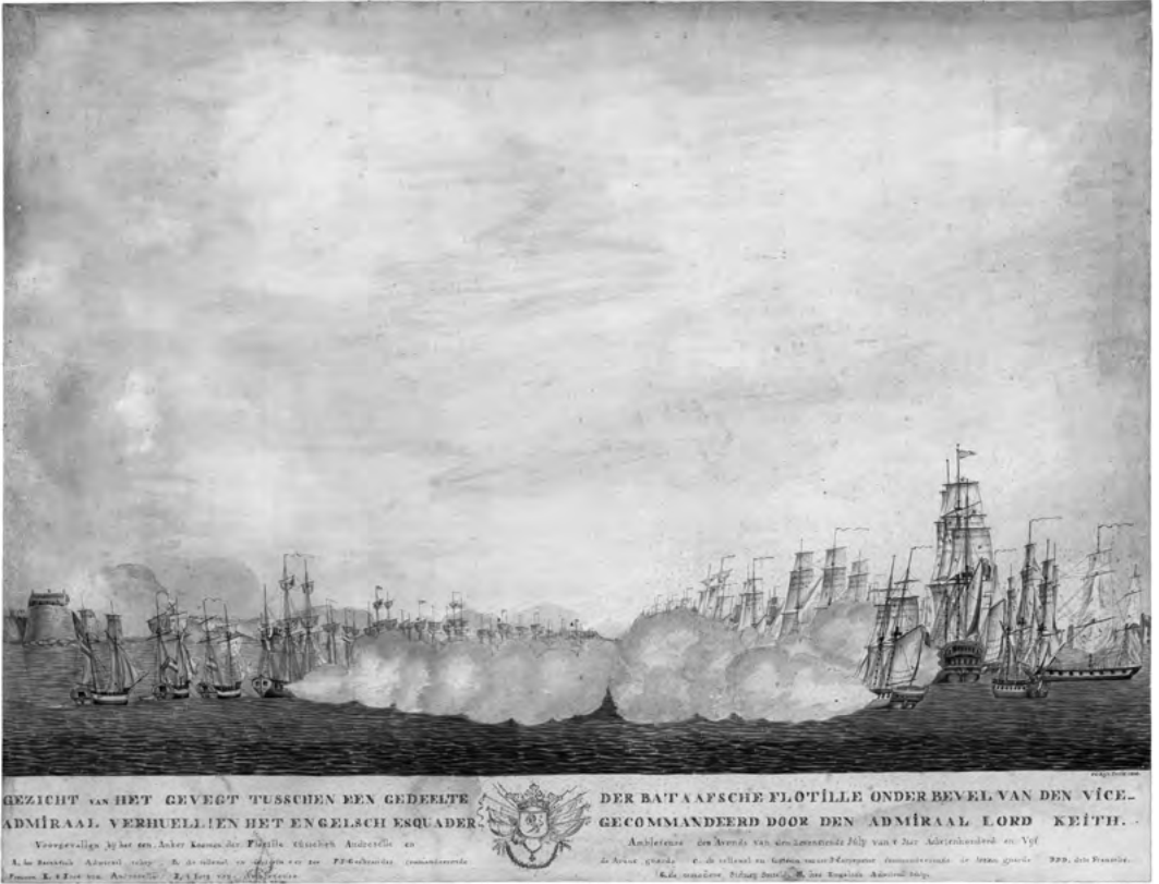
Gezicht van het gevecht tussen een gedeelte van het Bataafs flottielje onder bevel van viceadmiraal Carel Ver Huell en een Brits eskader onder commando van admiraal Lord Keith tussen Audreselle en Ambleteuse op 17 en 18 juli 1805. Tekening in gewassen Oost-Indische inkt door Julius Constantijn Rijk, 1806