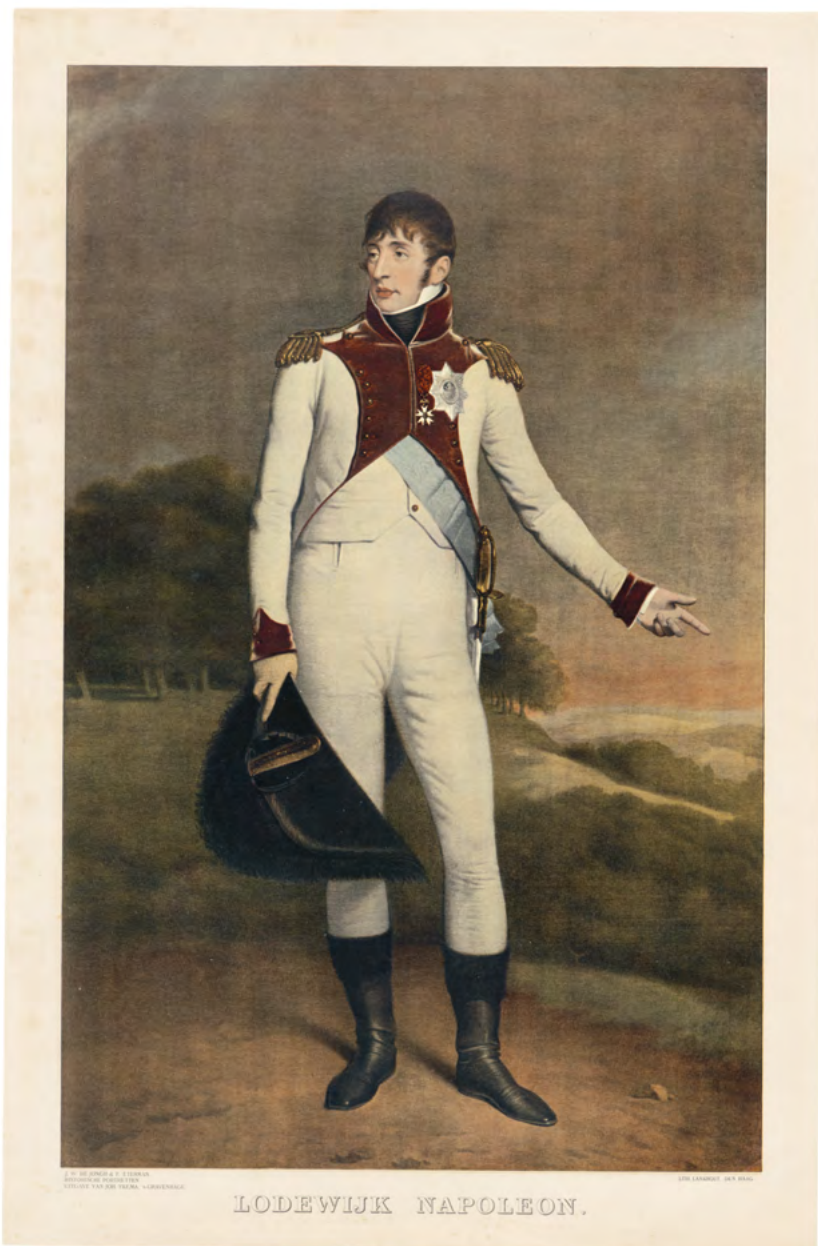
Lodewijk Bonaparte (1778-1846), koning van Holland. Schilderij door Charles Howard Hodges, 1809