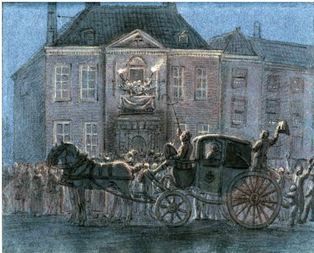
Het huis Kneuterdijk 6: de soevereine vorst op het balkon van het huis van (toen) Collot d'Escury bij de Haagse acclamatie in de avond van 2 december 1813. Krijttekening vermoedelijk van N.L. Penning, 1813