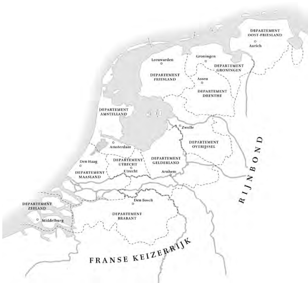
Het koninkrijk Holland in 1807