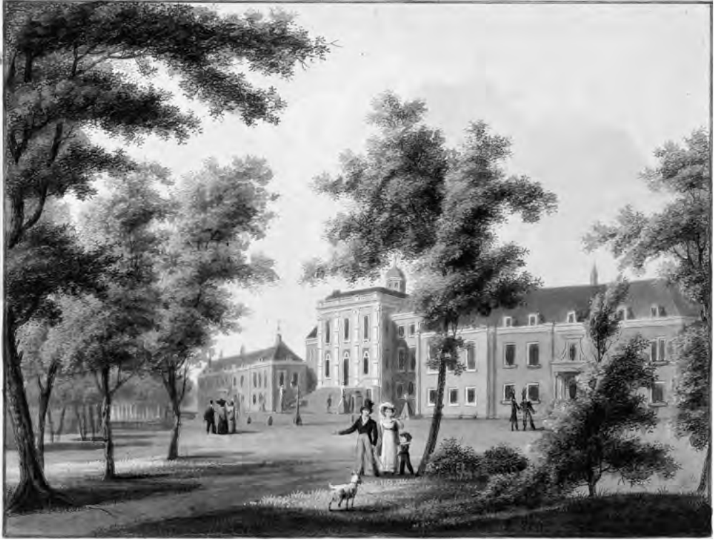
Huis ten Bosch rond 1805