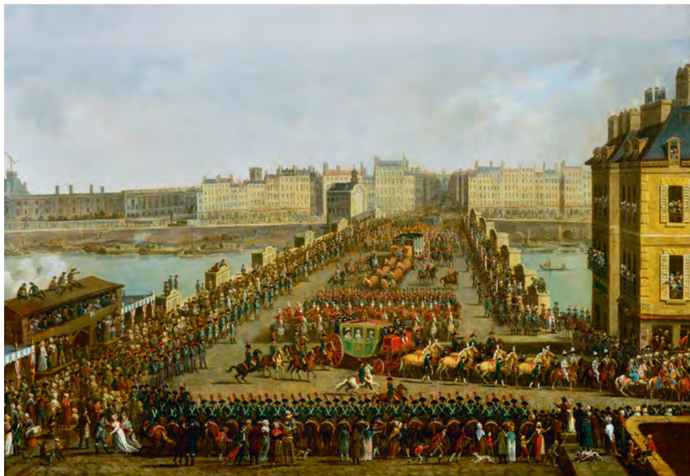
Napoleon op weg naar de keizerskroning op 2 december 1804, schilderij door Jacques Bertaux