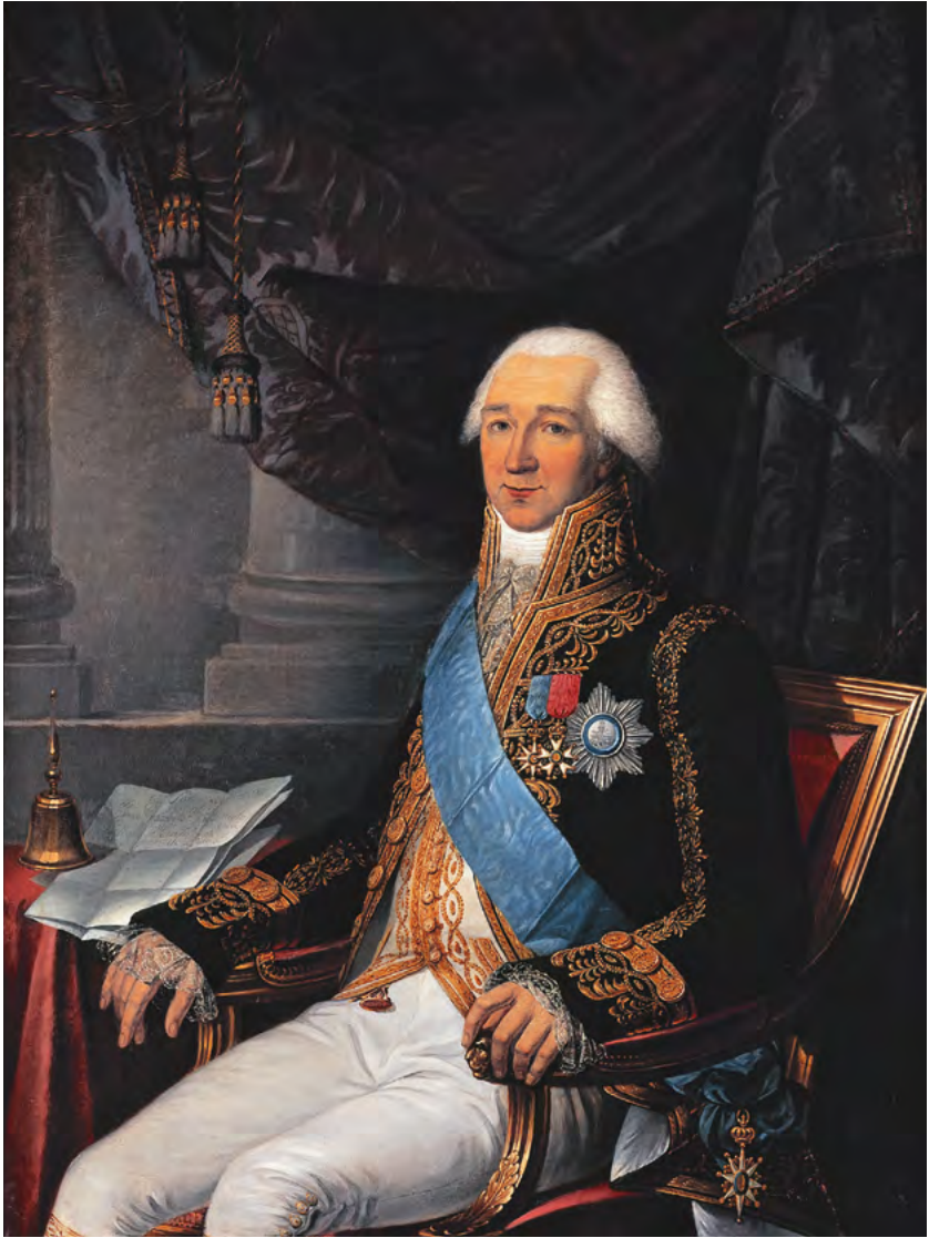
Gerard Brantsen (1735-1809), lid van het Staatsbewind en later ambassadeur in Frankrijk. Hij draagt de versierselen van Grootkruis van de Orde van de Unie. Schilderij door Benjamin Wolff