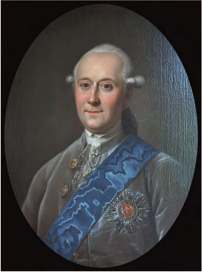
Andreas Peter Graaf von Bernstorff (1735-1797), door Jens Juel, ca 1790. Eerste minister van Denemarken en 'leermeester' van Van der Goes