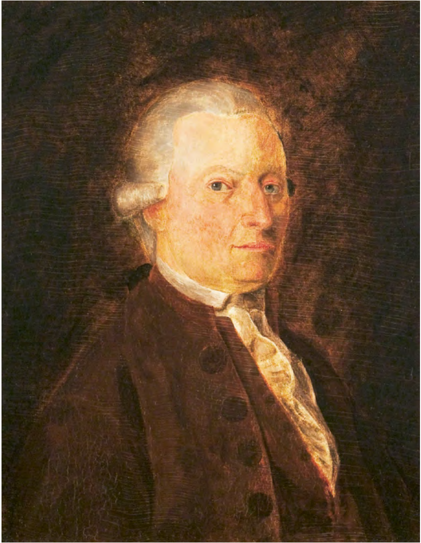
Laurens Pieter van de Spiegel (1737-1800), de laatste Raadpensionaris van de oude Republiek en 'leermeester' van Van der Goes