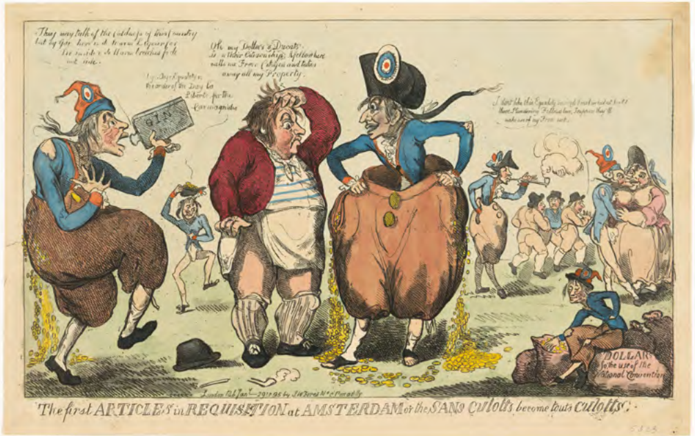
The first articles of requisition, Engelse spotprent op het Haags Verdrag van 16 mei 1795 waarbij de Bataafse Republiek verplicht werd enorme financiële vergoedingen te betalen voor de 'bevrijding' , door Isaac Cruikshank, 1795