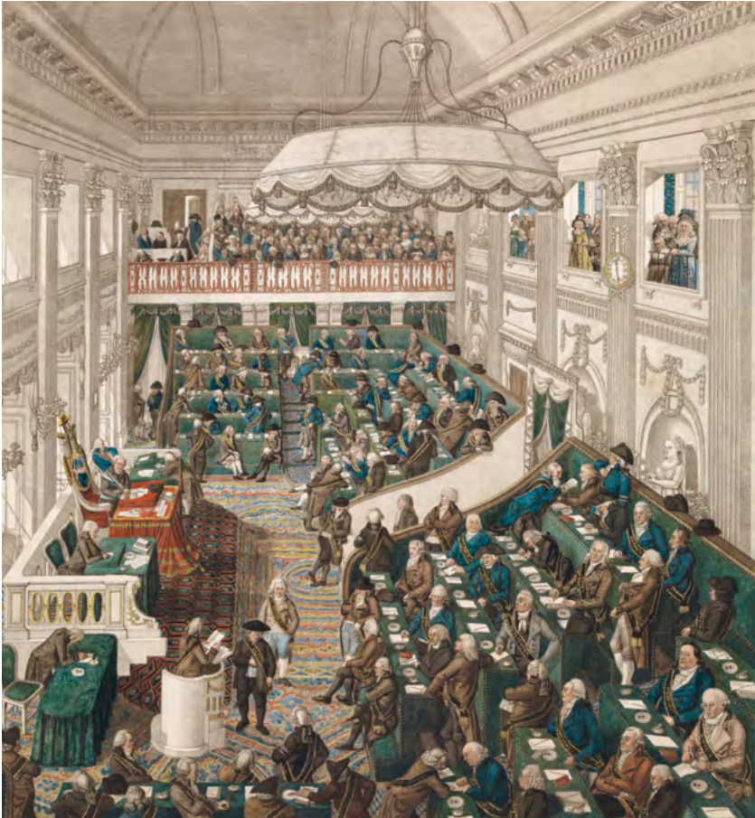
De Nationale Vergadering in 1797 door George Kockers