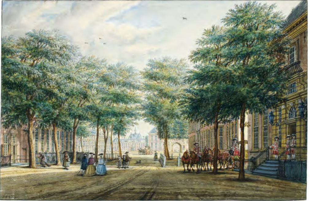
Gezicht op de Kneuterdijk met rechts het huis waar Van der Goes woonde en kantoor hield, het huidige Johan de Witthuis. Tekening door J.E. la Fargue