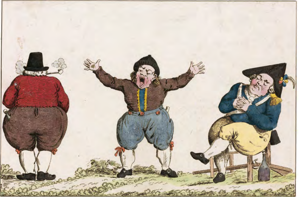
Caricatures Hollandaises, Franse spotprent op de Hollandse laksheid in de behartiging van het landsbelang , ca. 1795