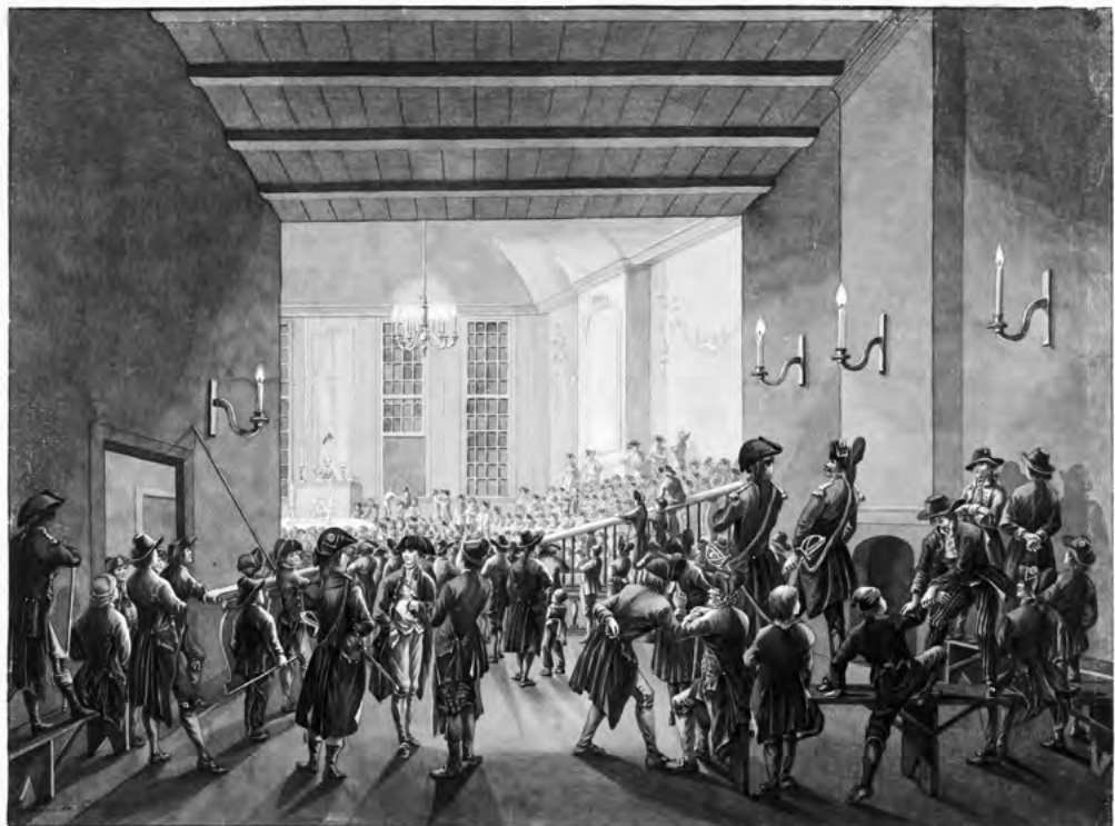
Bijeenkomst van een patriotse sociëteit of club, waarschijnlijk in de Oude Doelen op het Tournooiveld in Den Haag. Tekening door Johan Daniël de Gijsselaar, ca. 1795