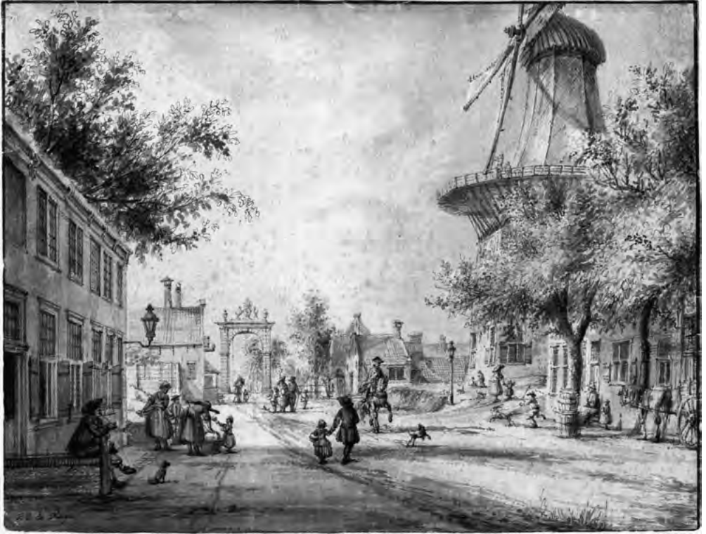
Het Westeinde te Den Haag, gezien naar de Loosduinse brug, door Jacob Elias la Fargue, 1770