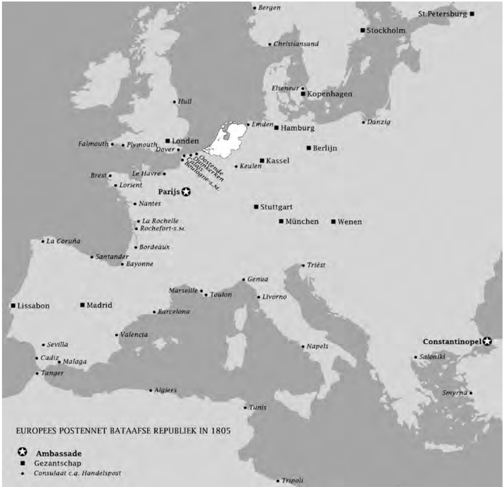
Kaart van het Bataafse diplomatieke postennet in Europa rond 1805