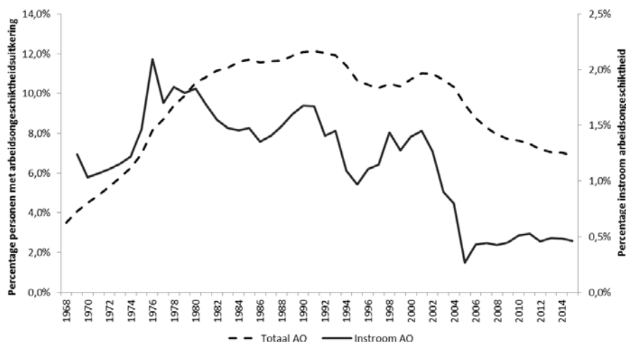
Figuur 1 Aandeel personen met een arbeidsongeschiktheidsuitkering en instroom in de arbeidsongeschiktheid in de beroepsbevolking, 1968-2015