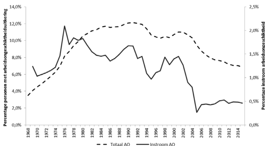
Figuur 1 Aandeel personen met een arbeidsongeschiktheidsuitkering en instroom in de arbeidsongeschiktheid in de beroepsbevolking, 1968-2015