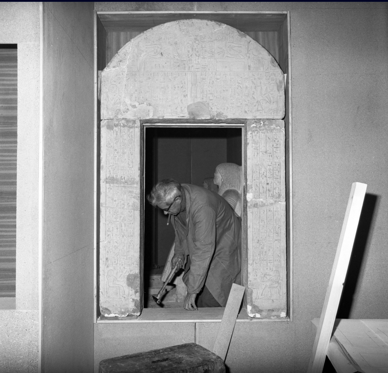
Afb. 3 Voltooien van het doorkijkje op de twee zitbeelden van Ptahmose 1975.