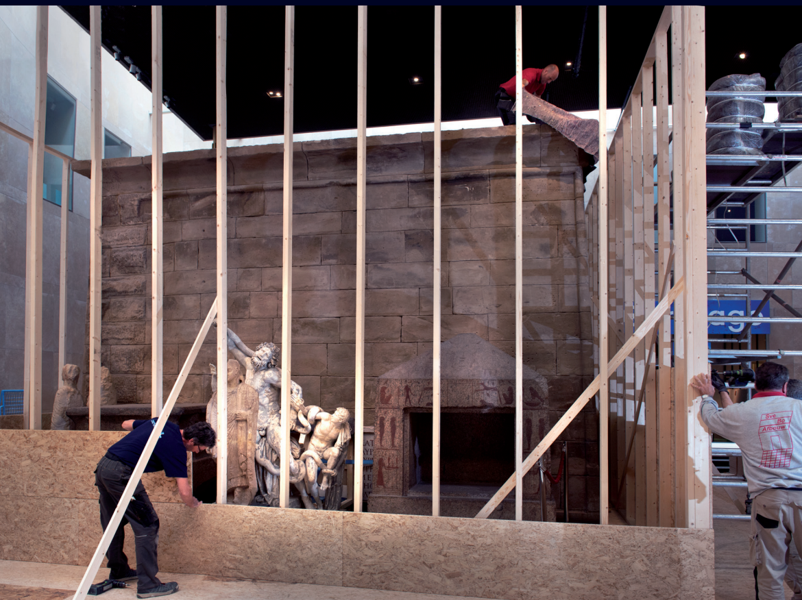
Afb. 5 'Inpakken en wegwezen', bouw van de beschermende installatie van de Taffeh-tempel, zomer 2015.