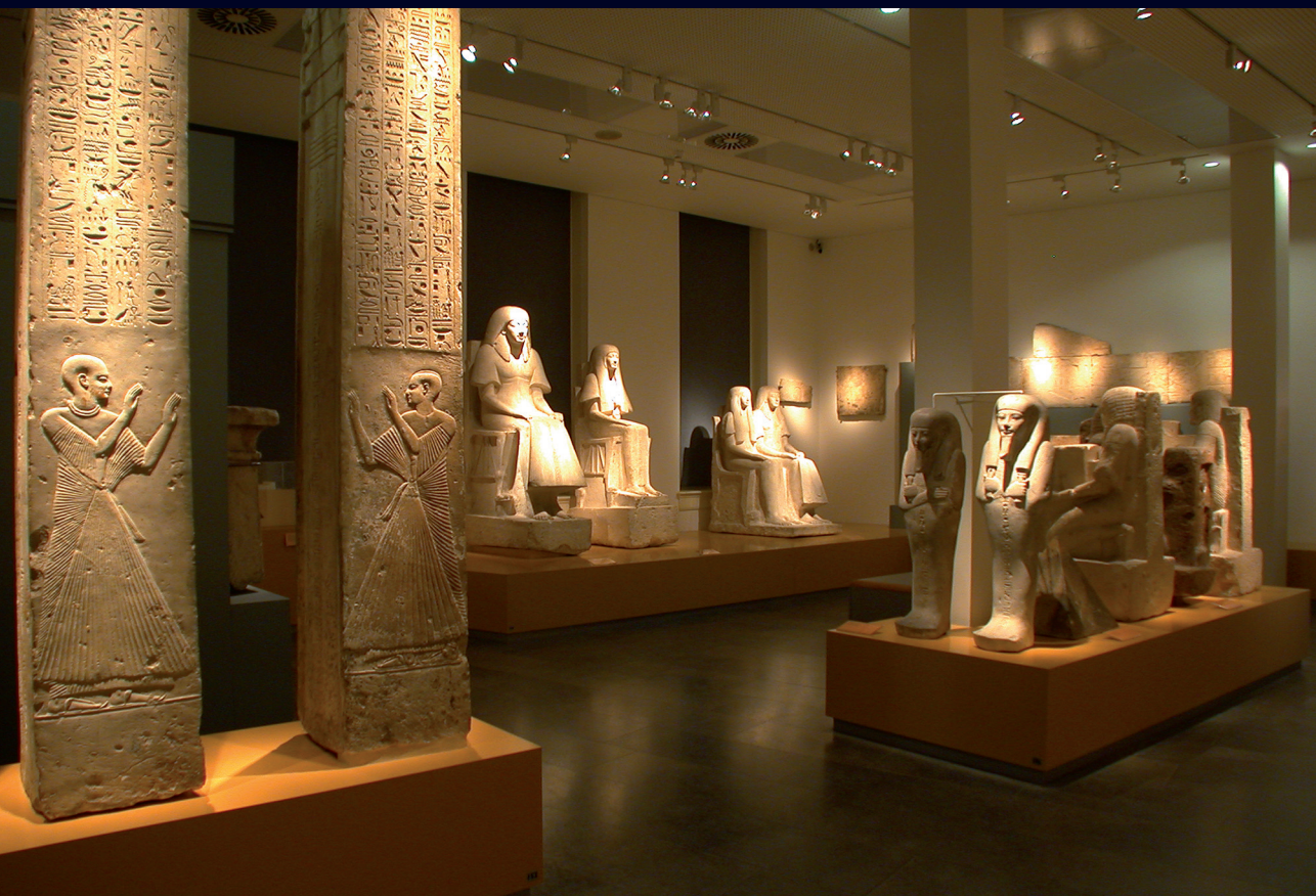
Afb. 1 De vertrouwde zaal met beelden, reliëfs en architectuurfragmenten uit Nieuwerijks Sakara.