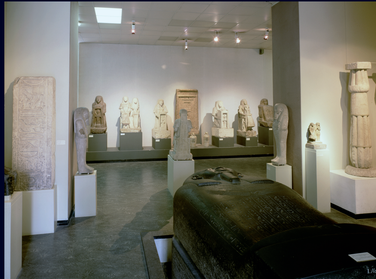
Afb. 18 De sculpturenzaal van het Nieuwe Rijk, 1975.