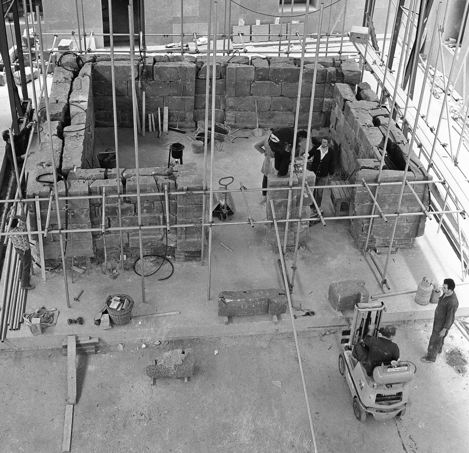
Afb. 13 De bouw van de Taffeh-tempel in volle gang, eind jaren 1970.