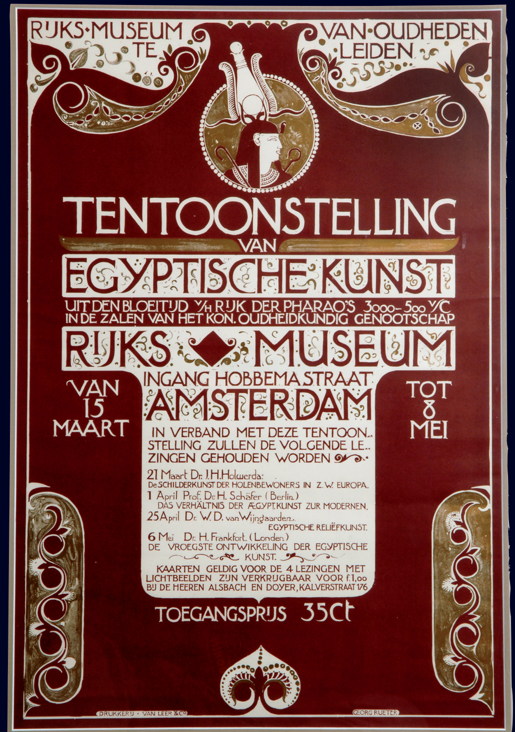
Afb. 36 Het oudste in het museumarchief aanwezige affiche met de aankondiging van de tentoonstelling van Egyptische kunst uit het RMO in Amsterdam, inclusief lezingenprogramma, 1927.