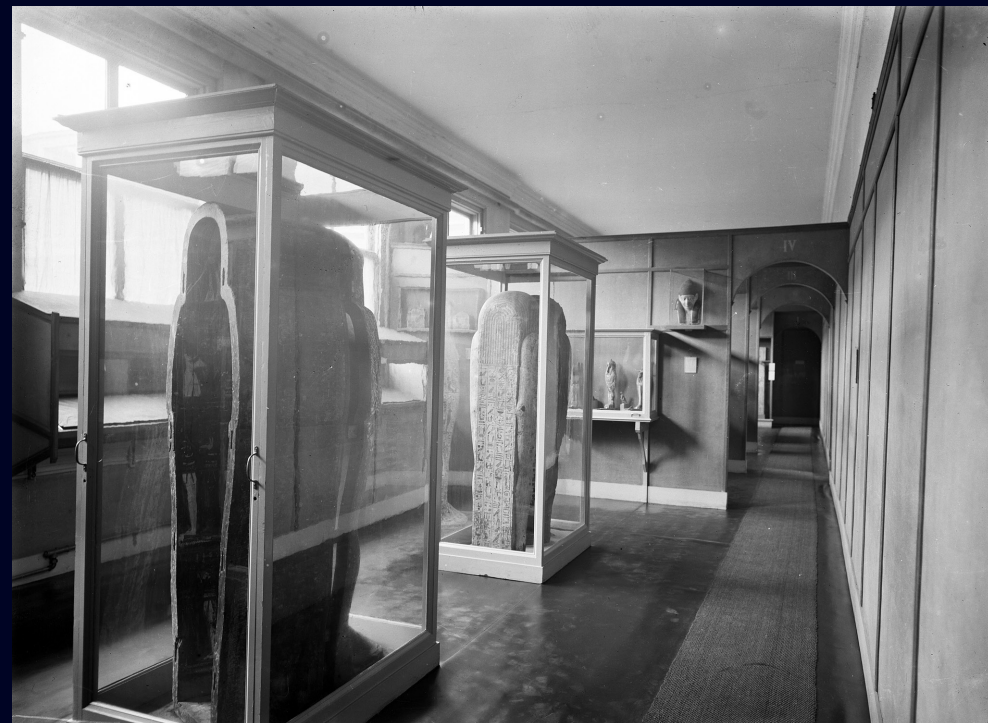
Afb. 31 Kleine objecten en stèles in zaal II, Breestraat, na 1904.