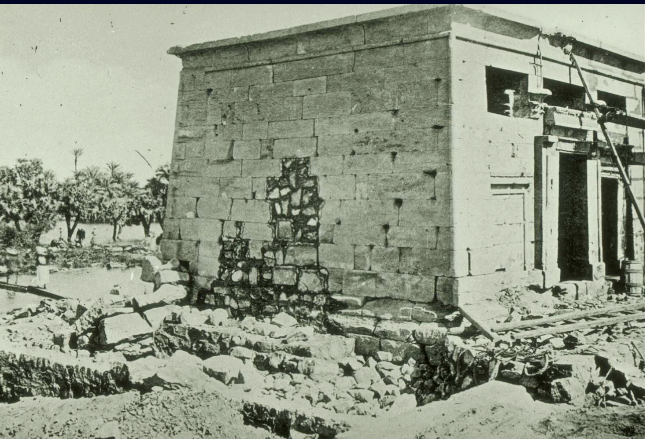
Afb. 7 De tempel van Taffeh in Nubië, nabij het Romiense fort Taphis (Taffeh), jaren 1960.