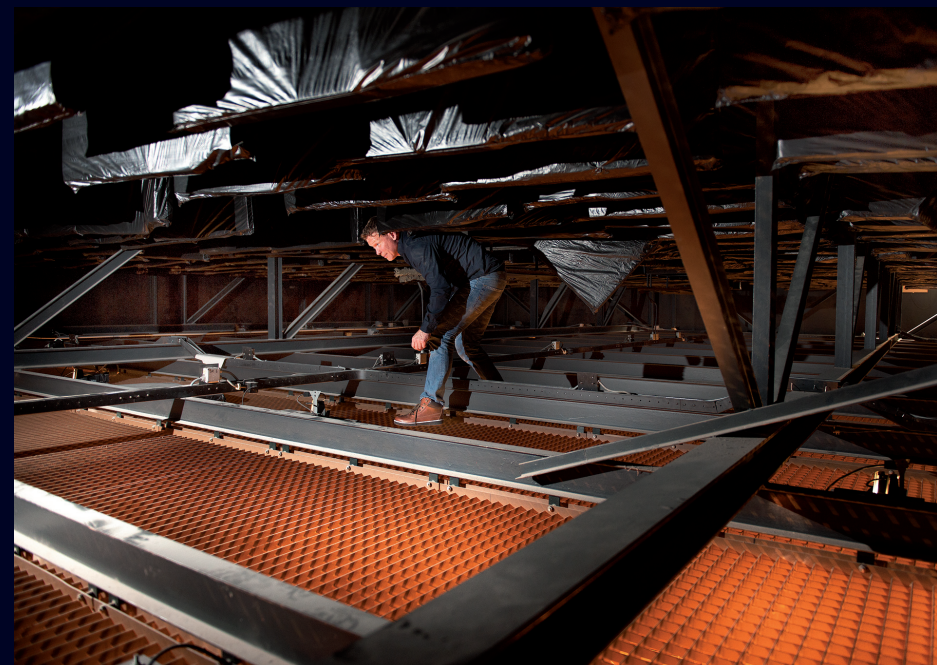
Afb. 12 'Spin in het web': de ruimte boven de Tempelzaal 2015.