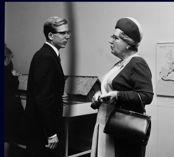
Afb. 23 Krantenbericht over de heropening van het gemoderniseerde museum. Het Vrije Volk , dinsdag 5 november 1968.

Ter gelegenheid van het jubileum en de opening is door de leiding van het museum een boek samengesteld 'Artefact' genaamd. Hierin zijn 150 foto's van F. G. van Veen opgenomen. Bovendien heeft men een jubileumpenning laten gieten in zilver en brons. De eerste exemplaren ervan werden koningin Juliana aangeboden.