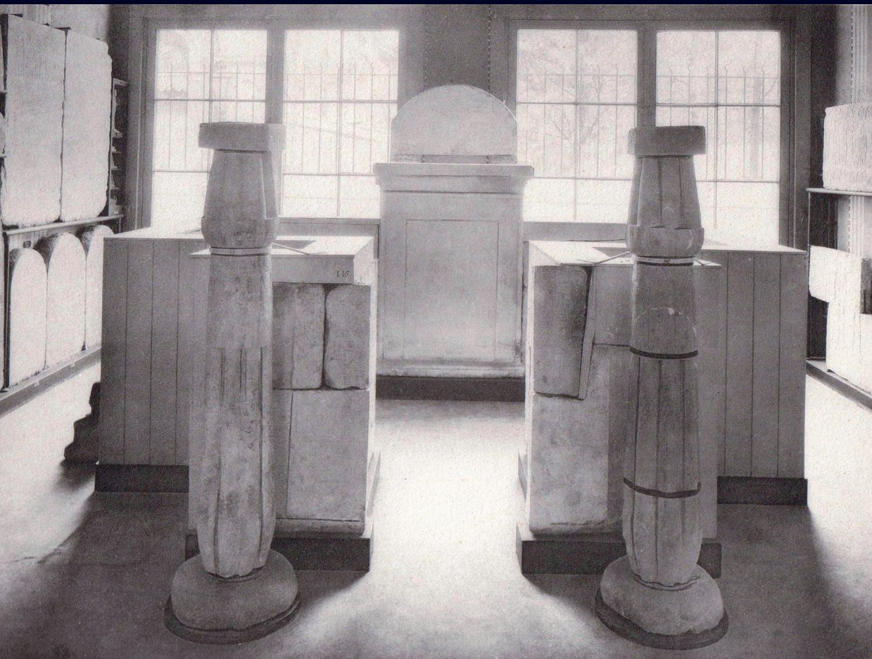
Afb. 32 De afdeling zware objecten uit het Nieuwe Rijk, met de grafkapel van Paätonemheb uit Sakkara, Breestraat, na 1904. Uit: P.A.A. Boeser, Beschrijving IV (Den Haag, 1911) pl. 38, fig. 2.