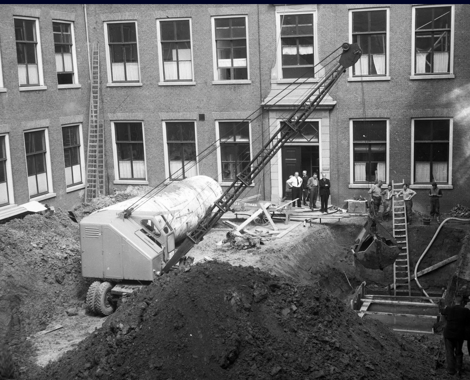
Afb. 10 De fundering voor de Taffeh-tempel wordt gelegd, jaren 1970.