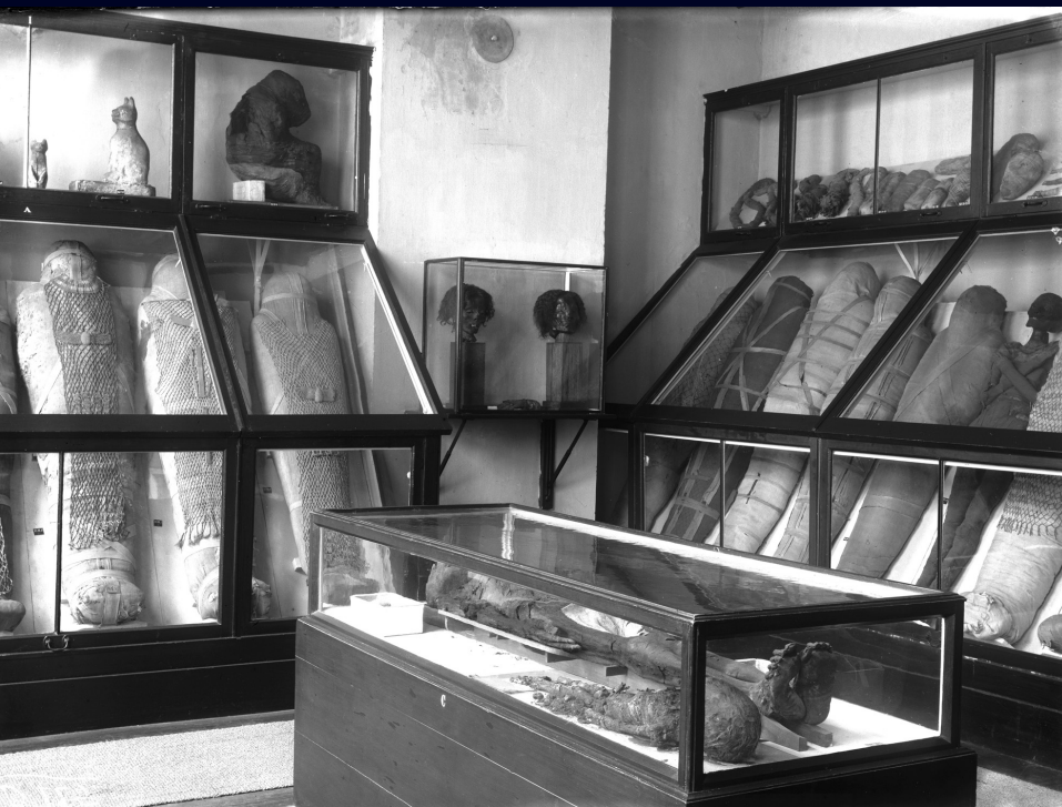
Afb. 34 De mummiezaal van het museum aan de Breesstraat, circa 1900.