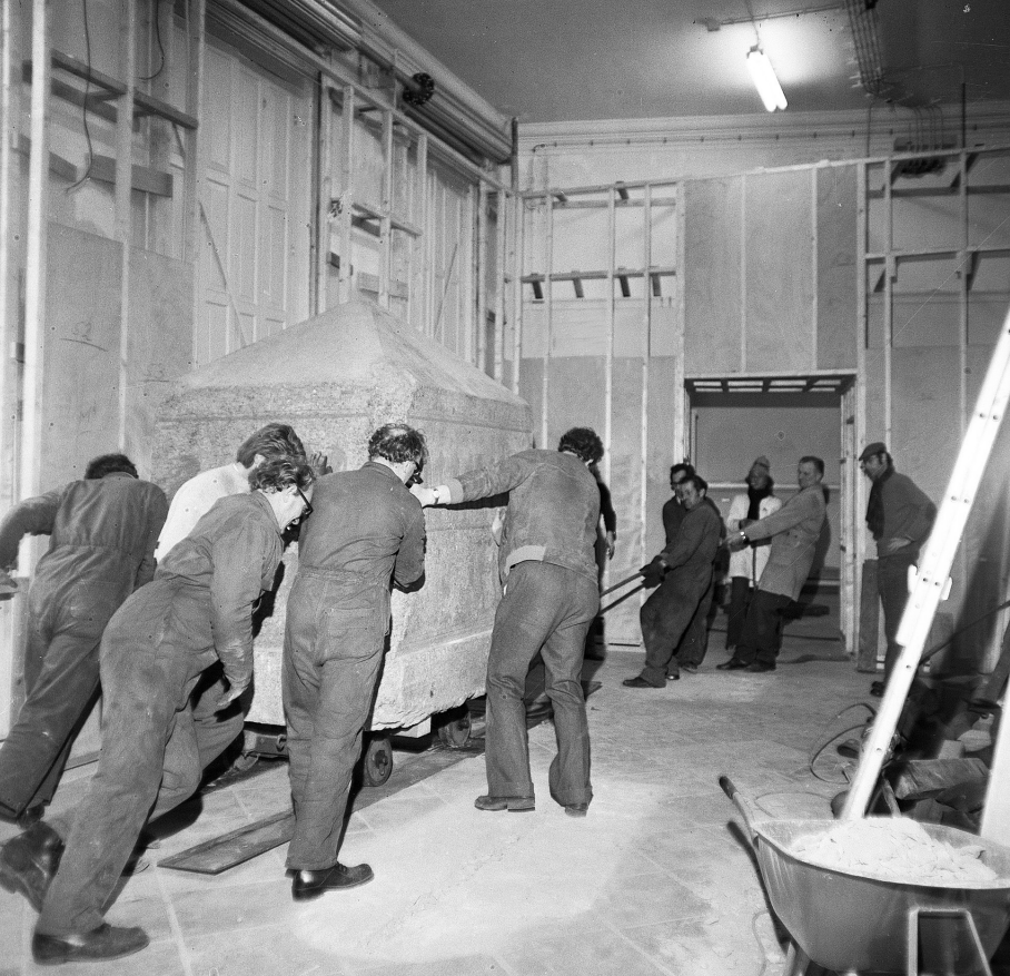
Afb. 16 De roodgranieten naos uit de tijd van farao Amasis wordt op een bijna Oudegyptische wijze verplaatst, voor de heropening van 1975.