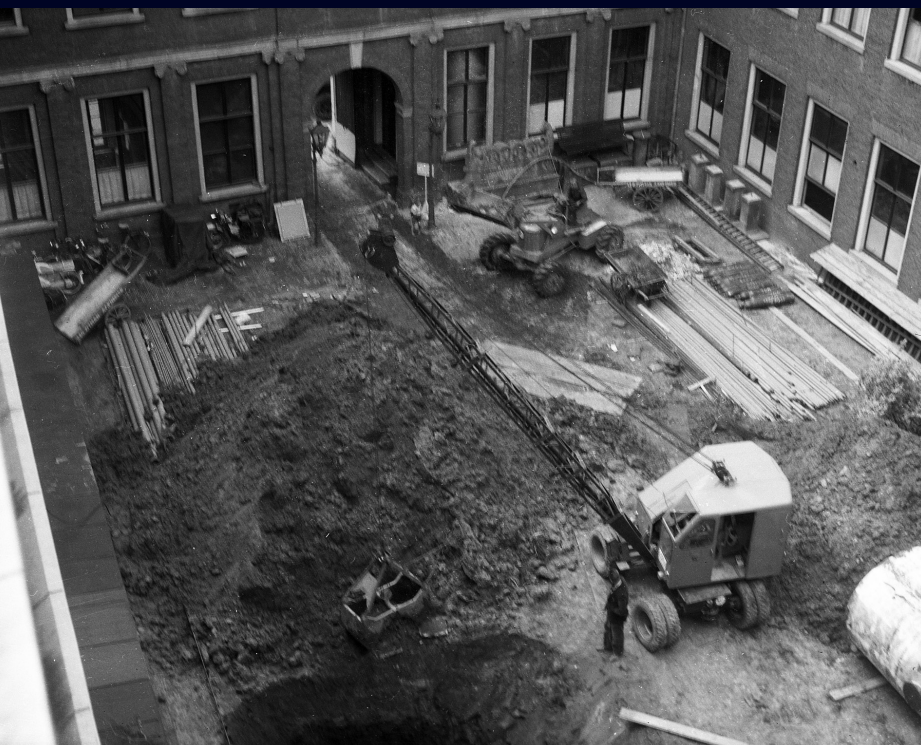
Afb. 9. Zicht op de werkzaamheden in de toekomstige entreehal van het museum, begin jaren 1970.