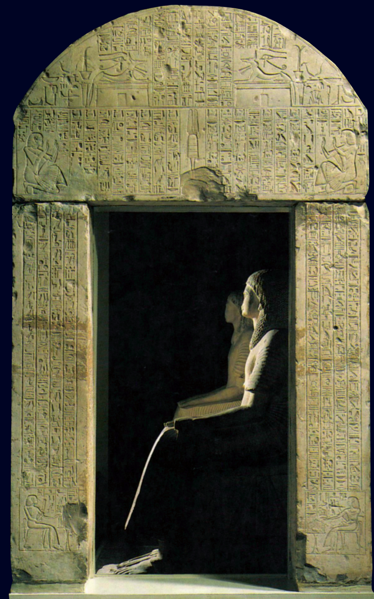
Afb. 4 De twee zitbeelden van Ptahmose achter de kapelfaçade van Oeserhat Hatiay, 1975.