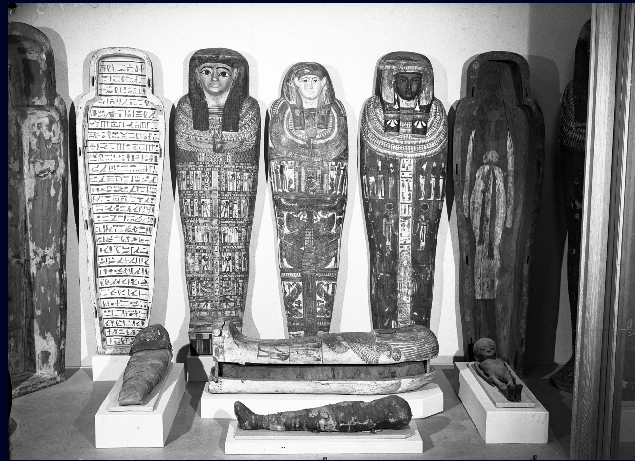
Afb. 20 Vitrine met mummies uit de Late Tijd, 1975.