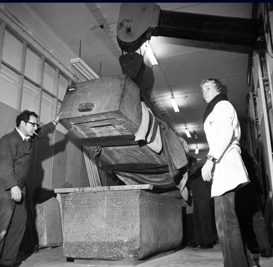
Afb. 17 Het deksel van de sarcofaag van Ahmose wordt van z'n plaats getakeld, voor de heropening van 1975.