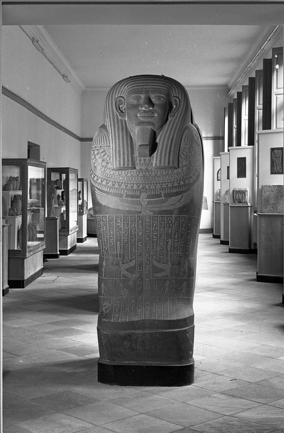
Afb. 21 De basalten sarcofaag van Wahibre-emachet in zaal III, 1968.