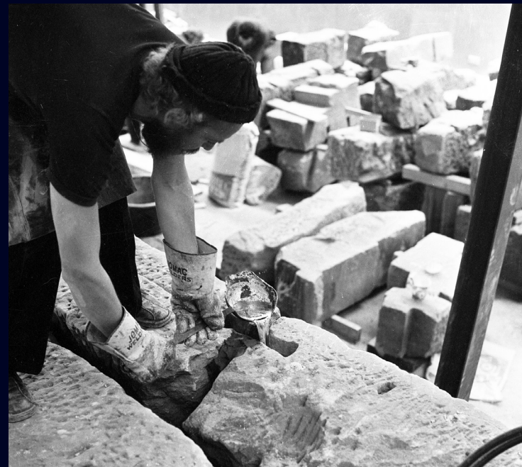
Afb. 14 Twee tempelblokken worden vakkundig aan elkaar bevestigd, eind jaren 1970.