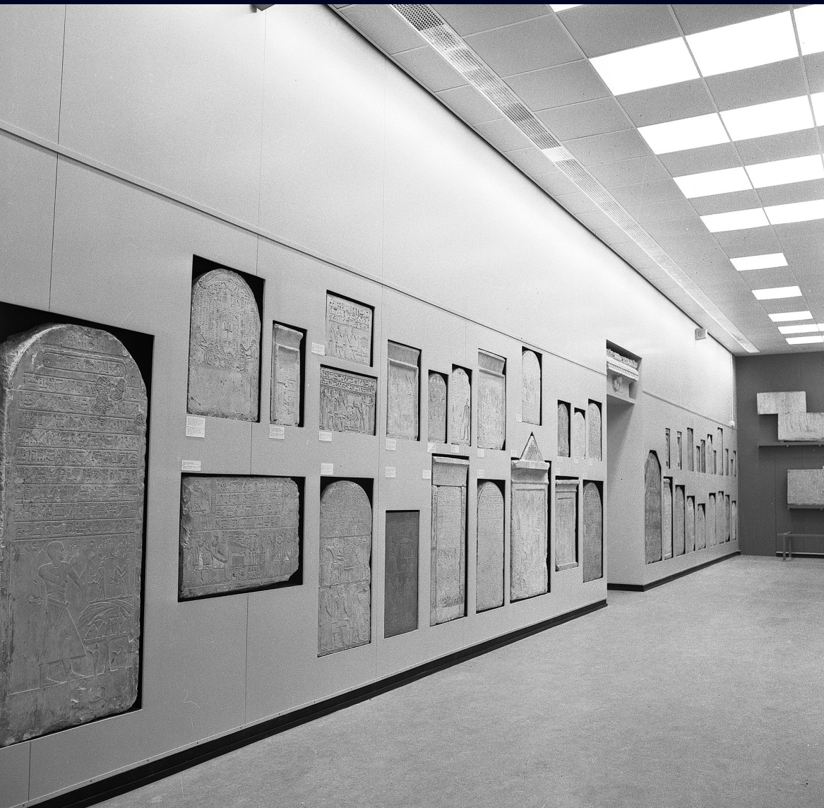
Afb. 19 Muur met stèles uit het Midden- en Nieuwe Rijk, 1975.