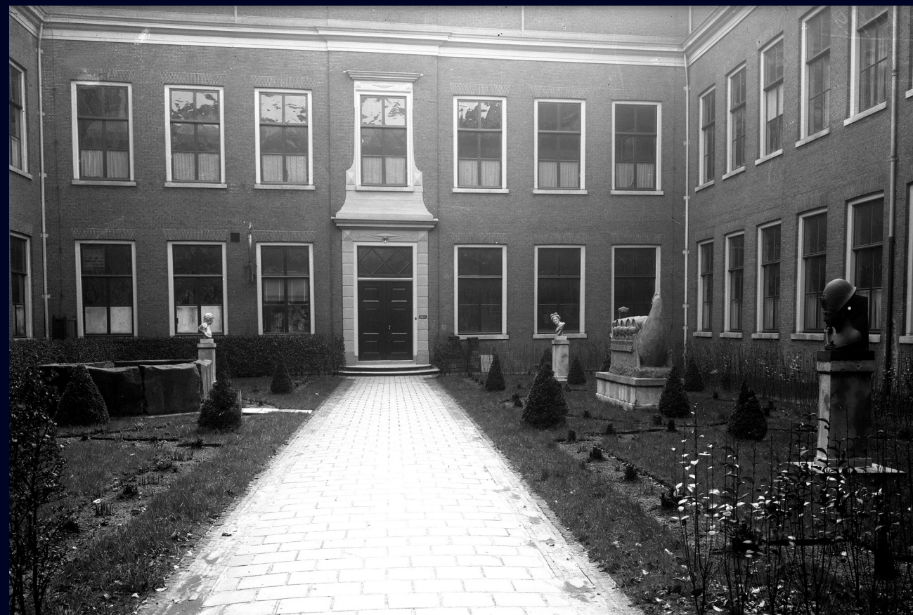
Afb. 6 De binnentuin van het Rijksmuseum van Oudheden aan het Rapenburg, voor de komst van de Taffeh-tempel.