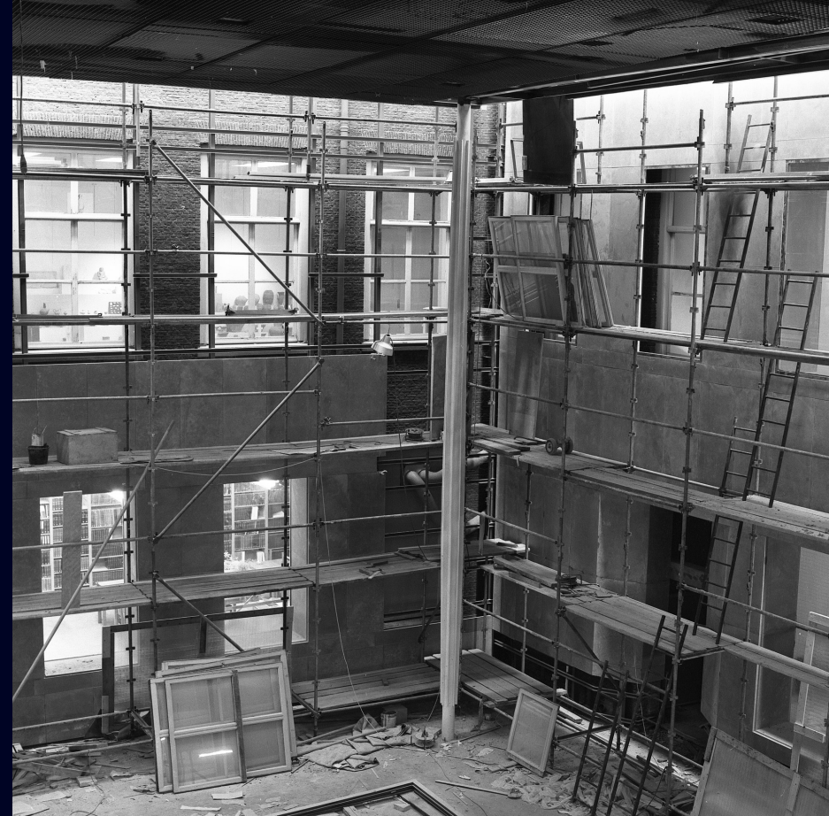
Afb. 11 De entreehal is overdekt en een nieuwe wand van stenen platen wordt opgetrokken tegen de monumentale muren, jaren 1970.