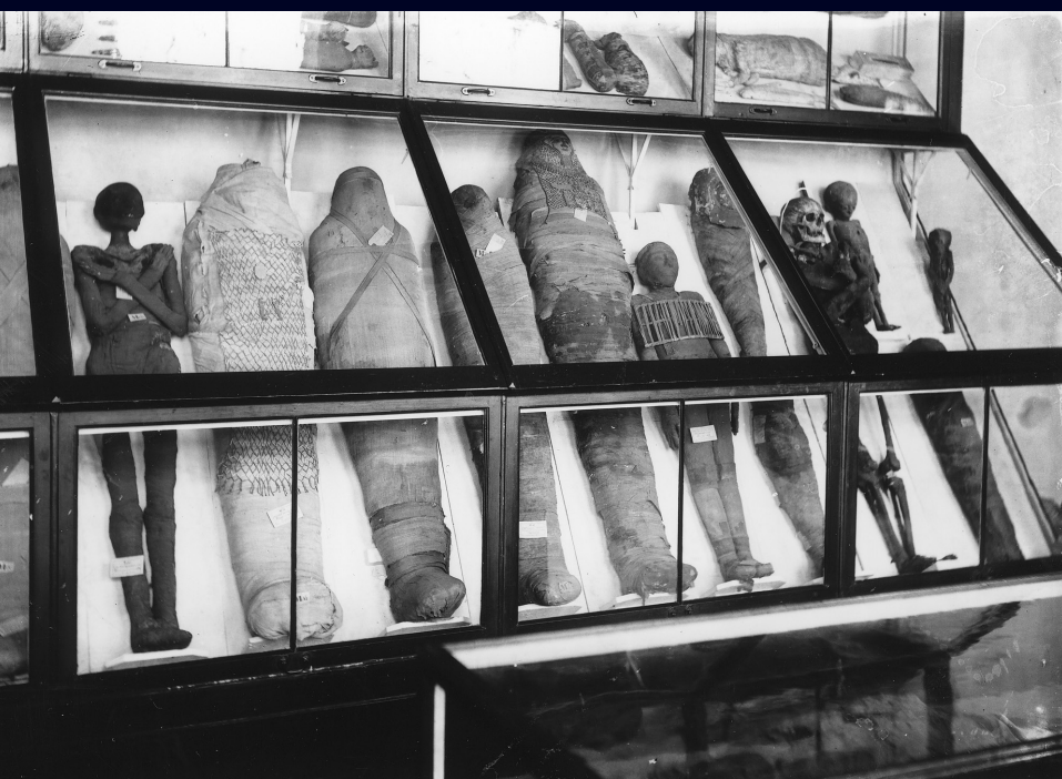
Afb. 35 Nog meer mummies, van zowel mensen als dieren, Breesstraat, circa 1900.