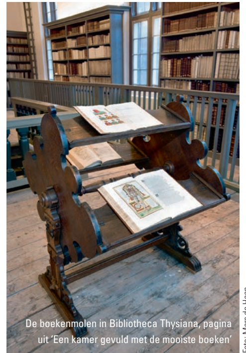
De boekenmolen in Bibliotheca Thysiana, pagina uit 'Een kamer gevuld met de mooiste boeken'