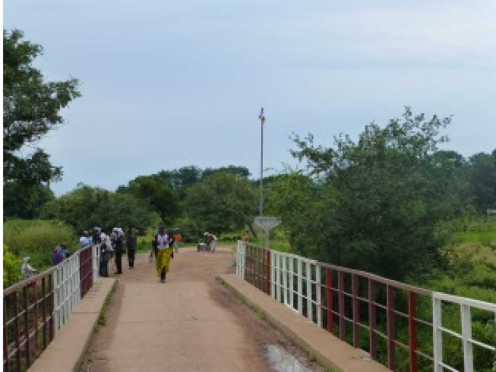
Pont Sido, à la frontière Tchad-RCA

Quant au deuxième plan quadriennal, il porta sur l'amélioration et l'industrialisation de la production. L'encadrement rural et la modernisation de la production agricole absorbaient tous les crédits d'investissement. Cependant, la construction et l'entretien des routes dont la réalisation fut directement liée à l'accroissement d'une production rentable, purent bénéficier de financements. C'est ainsi que les itinéraires Fort-Archambault-Melfi et Fort-Archambault-Am-Timane, respectivement voies d'acheminement du bétail et du coton pour l'abattoir et l'industrie textile de Fort-Archambault, ont été inscrits sur la ligne budgétaire. D'importants travaux ont été effectués sur la route Melfi-Fort-Archambault et un pont a été construit sur l'axe Fort-Archambault-Am-Timane 90 . Trois ponts furent construits sur l'axe Mongo-Ati, entre Banda-Abrèche et Douziat.