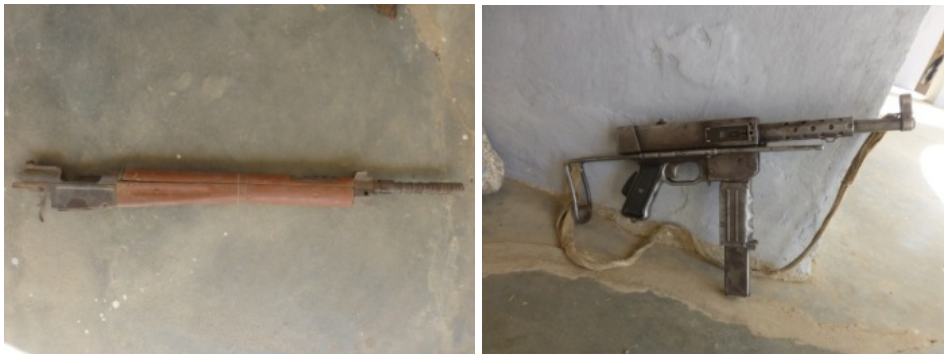
Arme de type MAS 36 Pistolet mitrailleuse (PM).

Dans l'armée coloniale, les soldats indigènes ont un rôle bien précis, celui de maintien de la paix et de la discipline parmi les masses paysannes (Elikia, 1999). Ce fut une mission d'ordre, de discipline et de répression que les soldats indigènes s'étaient vus confiée durant toute la période coloniale. A cet effet, les moyens militaires mis à leur disposition pour accomplir cette tâche répressive ne se limitaient qu'aux fusils rudimentaires de type Mas 36 et aux pistolets mitrailleurs accompagnés de la chicotte, utilisée pour les sévices corporels.