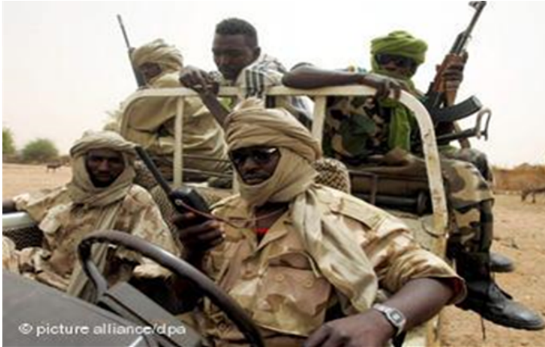
Une unité rebelle