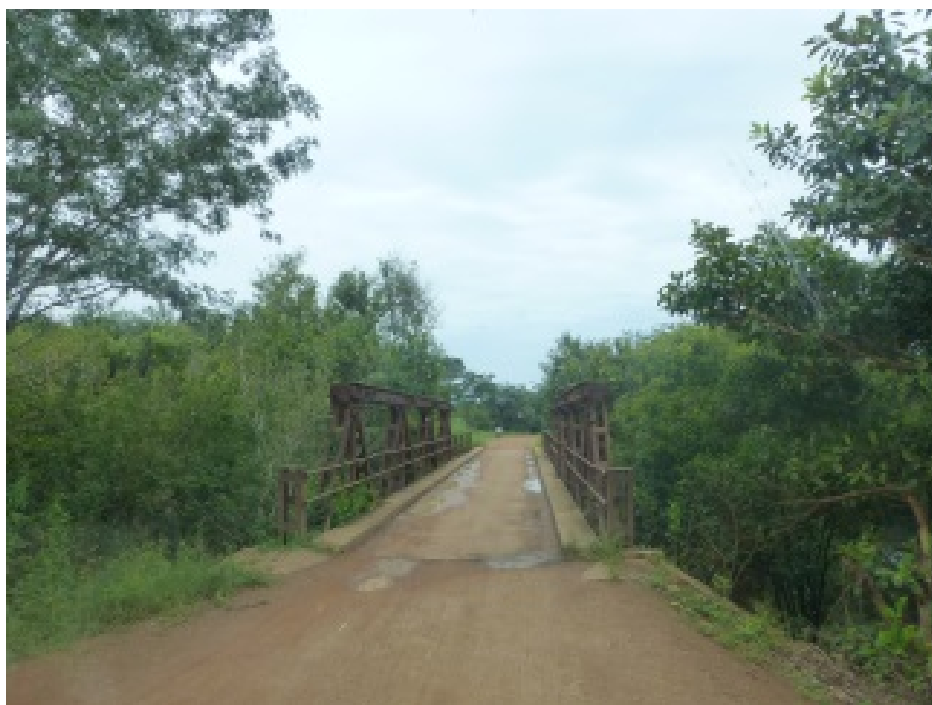
Pont sur le Sido

par le fait que sa construction avait vu la contribution de tous les villages environnants » 89 .