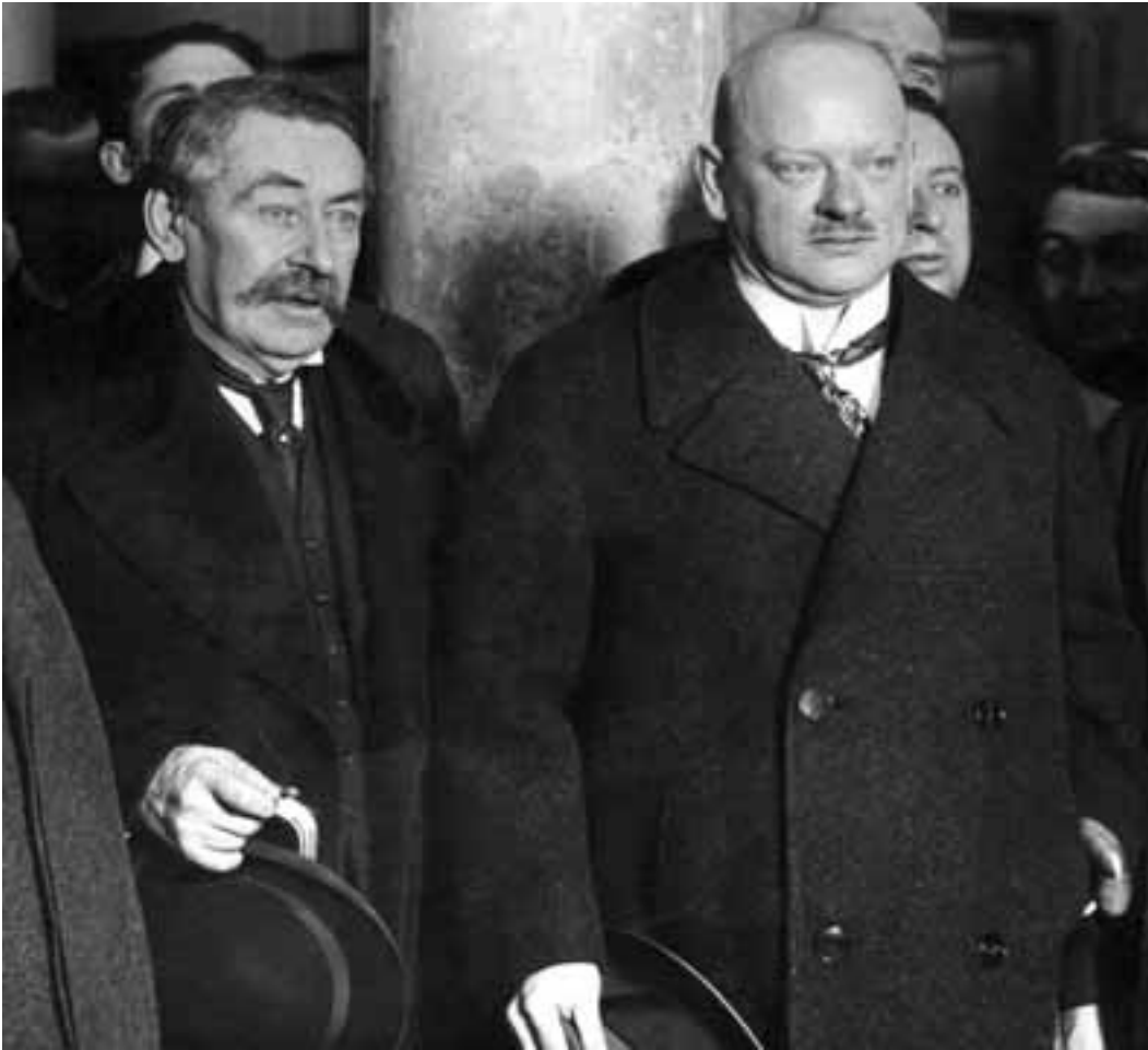
Aristide Briand (links, 1862-1932) en Gustav Stresemann (1878-1929) in 1926, het jaar waarin zij samen de Nobelprijs voor de Vrede toegekend kregen