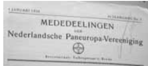
Mededeelingen der Nederlandsche Paneuropa-Vereeniging