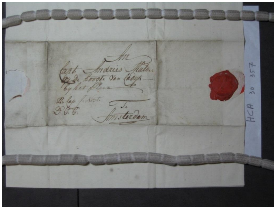
Afbeelding C.1: de adressering van de brief

Deze transcriptie is gebaseerd op de volgende foto's: