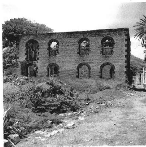
Ruïne van de synagoge, St. Eustatius