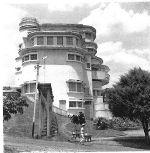
Villa Isola (Bandung)