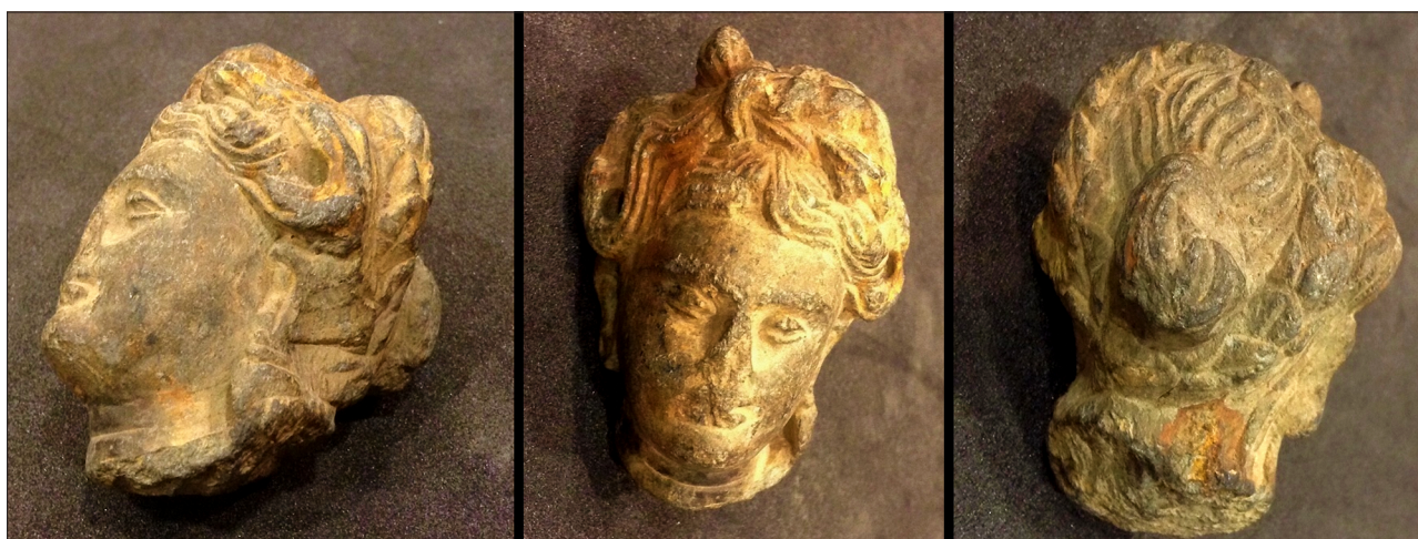
Figuur 5. Details van vrouwelijk beeldje.

sculpturen zijn het resultaat van de integratie van onderwerp en techniek, en als zodanig zijn ze kenmerkend voor de culturele dynamiek die het dagelijks leven in Taxila getekend moet hebben. Het is daarom belangrijk om er bewust van te zijn dat de categorie 'Grieks-Boeddhistisch' een interpretatie is die voortkomt uit de perceptie van onderzoekers zoals Foucher en Marshall, maar die in het antieke Taxila waarschijnlijk niet als zodanig gezien of zelfs herkend zou worden. 24