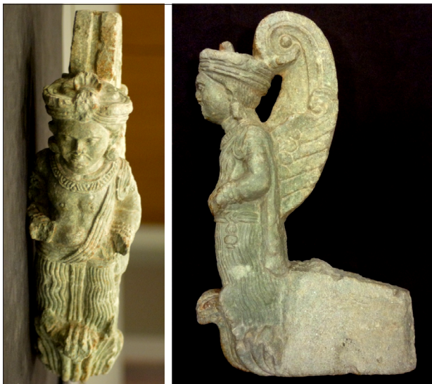
Figuur 6. Details van figuratieve haak.

of publicaties over Gandhara te vinden zijn. Twee voorbeelden zijn te zien in figuur 5 en 6.