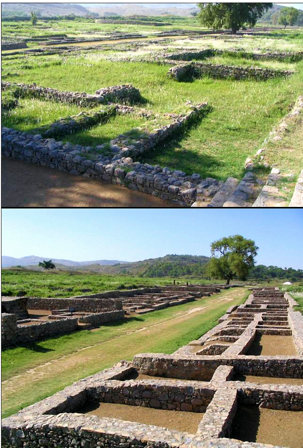
Figuur 2. Huidige staat van de Sirkap-opgraving.

geroepen tot 'protected heritage site' door UNESCO, en in 2010 kwam Taxila/Sirkap op de lijst van het Global Heritage Fund van de twaalf meest bedreigde archeologische sites ter wereld. 10 Sinds Marshalls opgravingen is er geen grootschalig archeologisch onderzoek meer gedaan in Taxila.