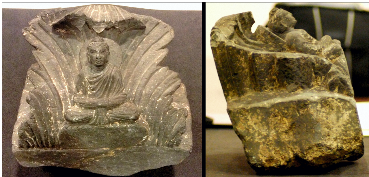
Figuur 4. Details van Corinthisch kapiteel met Boeddhafiguur.