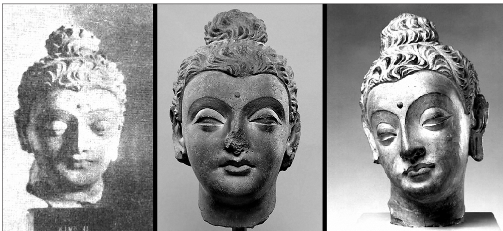
Figuur 3. V.l.n.r.: Boeddha's hoofd uit Marshalls opgravingsrapport (1975, plaat 153, n. 35); Boeddha's hoofd; Boeddha's hoofd.

Archeologen zijn vanaf de 19de eeuw uitgegaan van wat zij als de specifieke cultuurstijlen van deze vondsten zagen, en koppelden die vervolgens aan de etniciteit van hun hypothetische makers ('Grieks', 'Indisch' of 'Kushaans'). Mede om deze reden is er vaak een connectie gezocht tussen Griekse filosofie en Boeddhisme. 22 De Hellenistische stijl gebruikt voor Boeddhistische kunst moest namelijk wel een inhoudelijke koppeling vertegenwoordigen. Van alleen praktische redenen kon geen sprake zijn volgens het traditioneel uitgangspunt waarbij de categorieën 'Grieks' en 'Boeddhistisch' om culturele redenen gekoppeld moesten zijn, en waarbij de Griekse cultuurstijl bij voorbaat als superieur werd beschouwd. 23 De beelden zelf geven echter geen blijk van zo'n uitgesproken compartimentering; hun Boeddhistisch onderwerp en Hellenistische techniek maken integraal deel uit van één en hetzelfde object. Kortom, deze