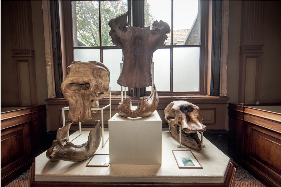
In het midden de mammoetschedel van Heukelum, in 1824 door Van Marum aangekocht voor de Hollandsche Maatschappij, in 1885 geschonken aan Teylers Museum, coll. Teylers Museum

Er zijn meerdere scenario's denkbaar waarom de verzamelactiviteiten van Van Marum gestopt moesten worden. Mijnhardt (1988) stelde dat het reeds lang sluimerende conflict als gevolg van de diametraal tegenovergestelde visies van Directeuren en Van Marum op de wetenschapsbevordering eindelijk tot een uitbarsting kwam. Dat zou echter niet stroken met Van Marums voornamelijk fysico-theologische benadering van de aardwetenschappen in zijn voordrachten uit de periode 1796-1803, terwijl alleen in de periode daarvoor zijn lessen wel utilitair getint wetenschappelijk onderzoek benadrukten. 131 Een theorie is dat de aankoopstop werd ingegeven door de verwoestende uitwerking van de Franse bezetting. 132 Directeuren waren gedwongen grote sommen geld te lenen aan de overheid, die ze later niet terugkregen. Verder werd in deze periode de economische situatie zo nijpend dat er heel veel geld naar de armenzorg ging. Uit Van Marums aantekeningen blijkt echter nergens dat hij met deze argumenten door Directeuren werd geconfronteerd. Ook toen de malaise voorbij was, werden niet alsnog gelden gereserveerd voor nieuwe aankopen