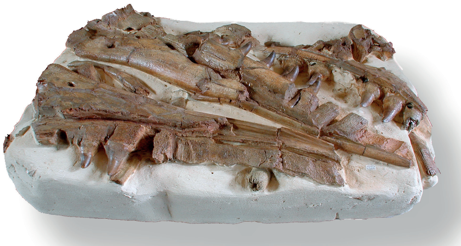
De in 1766 gevonden kaken van een Mosasaurus, die in 1784 door Van Marum voor het museum werden verworven