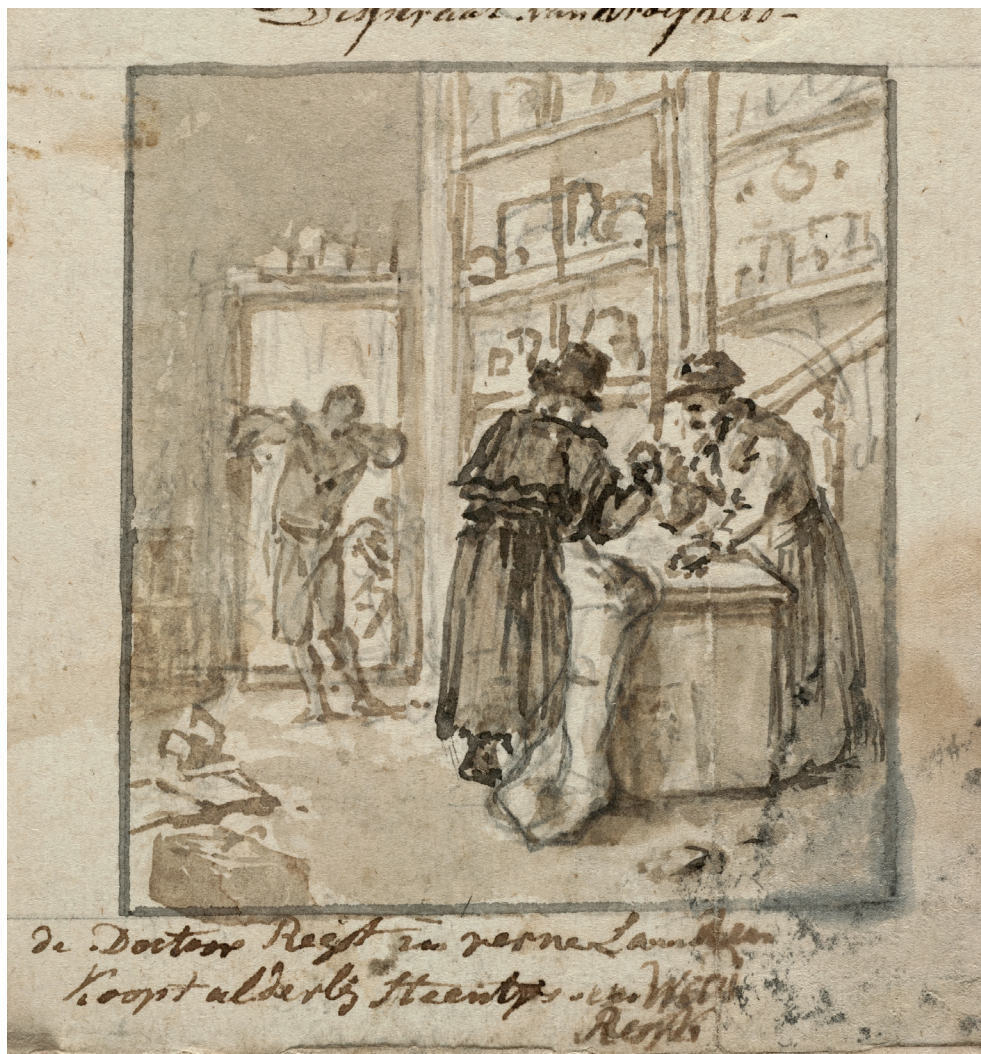
Wybrand Henriks, Uit een cartoon van het leven van Martinus van Marum, met onder andere: De Doctor Reyst na verre Landen, Koopt alderlij Steentjes [...]