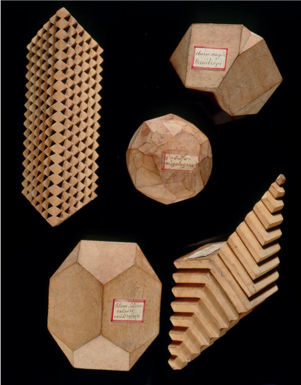
Enkele voorbeelden van de perenhouten kristalmodellen naar het ontwerp van de abt R.J. Haüy, coll. Teylers Museum