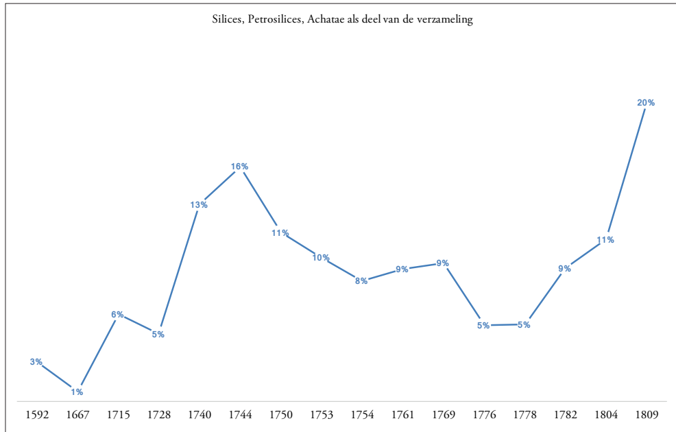
Percentage decoratieve gesteenten in geveilde mineralogische verzamelingen in de periode 1592-1809

Marmers, Spathen, Boomagtige Spek-steenen, Serpentyenen, Barnsteen en met ingesloote insecten, Florentynse steede-steenen en andere gepolyste boomsteen". 123 Natuur en kunst liepen naadloos in elkaar over. 124