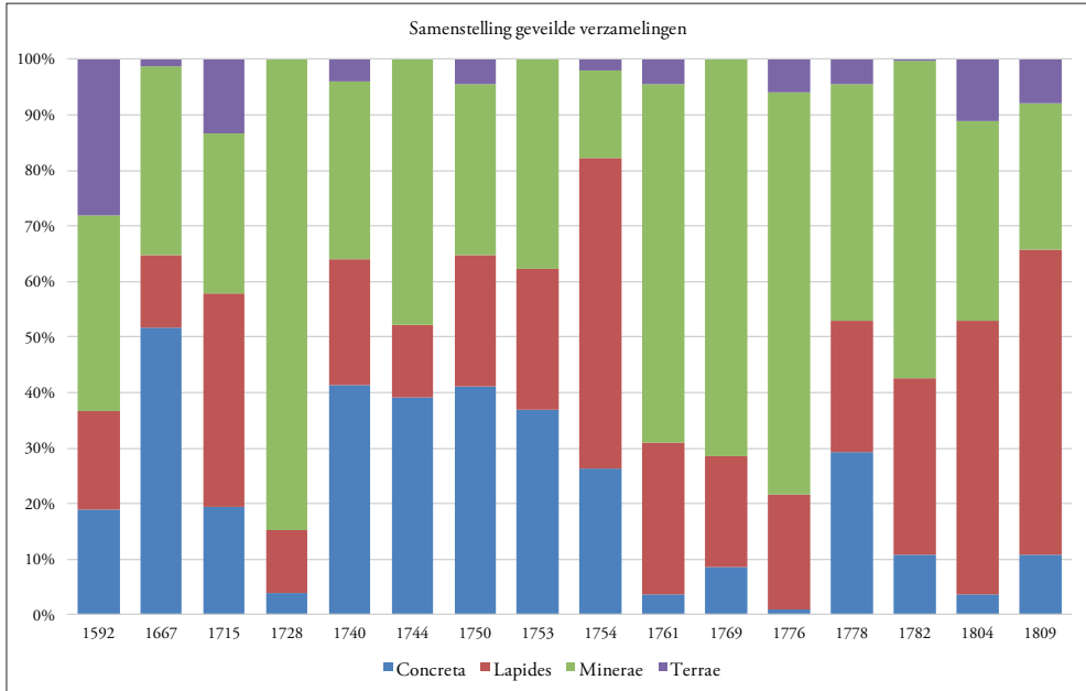
Samenstelling van geveilde mineralogische verzamelingen in de periode 1582-1809

Allereerst valt op dat het aantal fossielen, in de ruime zin van het woord, in de loop der tijd afneemt. De samenstelling van het fossielendeel is steeds zeer divers en daaruit spreekt nooit een bepaalde belangstelling, maar eerder de som van toevalligheden. De kans bestaat dat fossielen, vanwege hun onduidelijke herkomst, lang als rariteiten werden gezien en ook een overzichtelijke classificatie ontbeerden in tegenstelling tot de gesteenten en mineralen die beter en fraaier in te delen waren. Een mooi overzicht van de versteende natuur geeft Schijnvoet in zijn aanvullingen op Rumphius, met fossiele vissen (meest afkomstig uit Mansfeld/Eisleben, Monte Bolca en Solnhofen), schelpen, krabben en zee-egels. 129 In het algemeen blijft Toscane vaak het herkomstgebied voor fossiele schelpen.