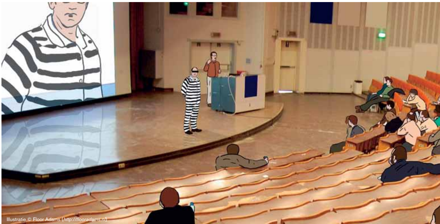
Illustratie © Floor Adams ( http://flooradams.nl )

te beginnen, en vervolgens op te bouwen; dat zag Kruseman al lang geleden: 'Geen concert opent met de negende van Beethoven.' 36