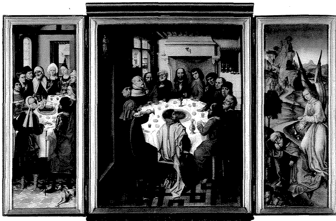
Fig. 3. Maître de la Légende de sainte Catherine, Triptyque de la dernière Cène , 163,5 x 77 cm, Bruges, Grand Séminaire.

senté offrant une église miniature. Parallèlement se développe le portrait dévotionnel, formule selon laquelle le modèle est représenté en orant, agenouillé les mains jointes ou croisées sur le torse. À partir du XVI e siècle, de légers changements sont perceptibles dans les modes de représentation des personnes portraiturees, laissant présager une évolution sémantique de cette production. Il s'agit d'une problématique que j'évoquerai à la fin de mon exposé.