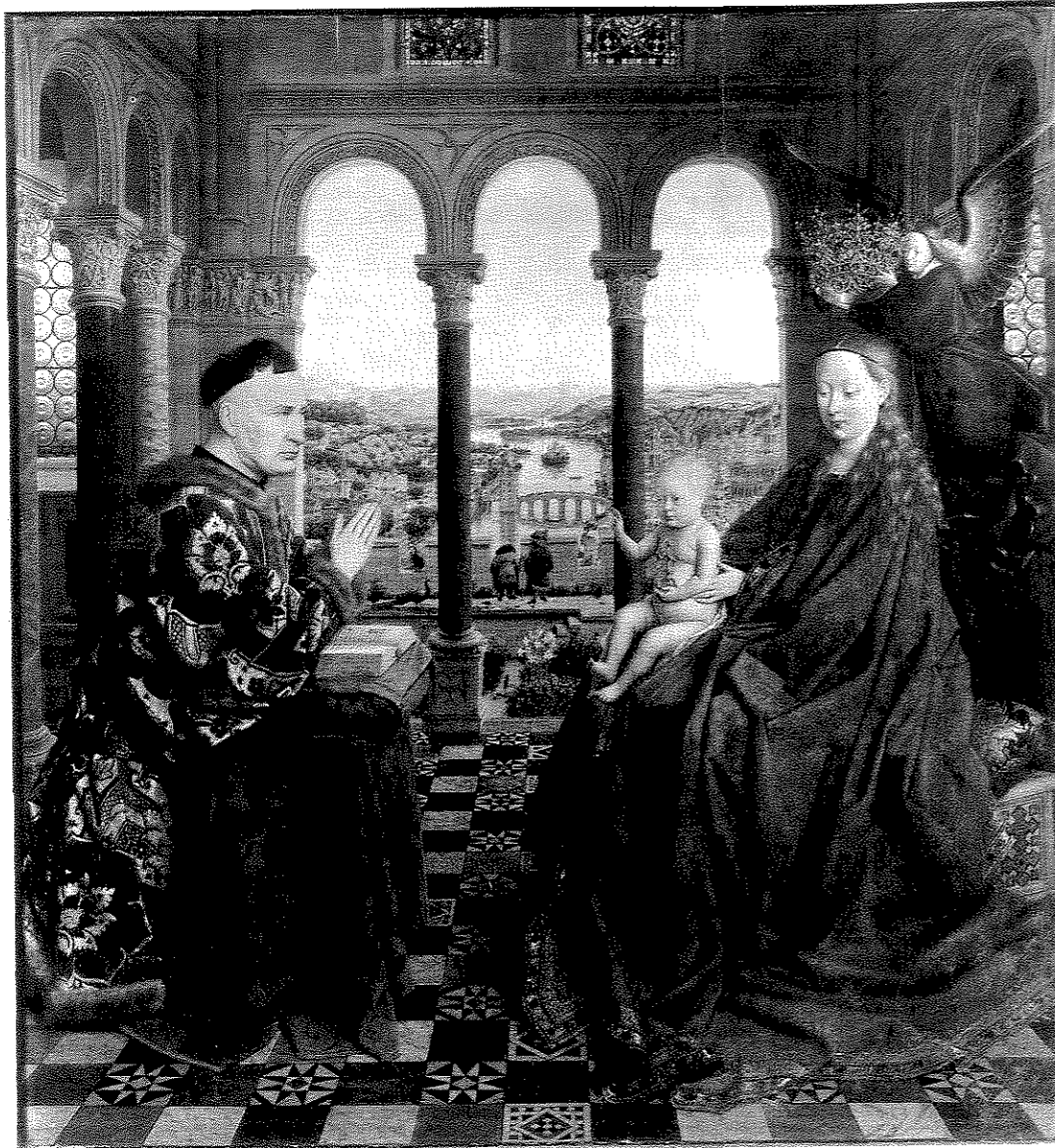
Fig. 4. Jan van Eyck, La Vierge au chancelier Rolin , 66 x 62 cm, Paris, Musée du Louvre, n° inv. 1271.

Enfin, le support en lui-même permet une plus grande variété compositionnelle et de format que les autres mediums. Ceci explique d'ailleurs partiellement la multitude de fonctions que peuvent revêtir ces tableaux.