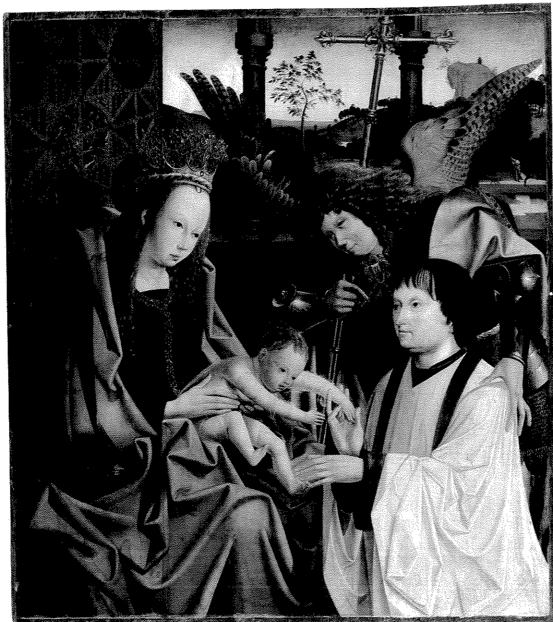
Fig. 9. Maître du Triptyque anversois de la Vierge, La Vierge à l'Enfant avec un homme présenté par saint Michel , huile sur bois, 82,5 x 73,5 cm, Berlin, Staatliche Museen zu Berlin, Gemäldegalerie, n° inv. 1631A.