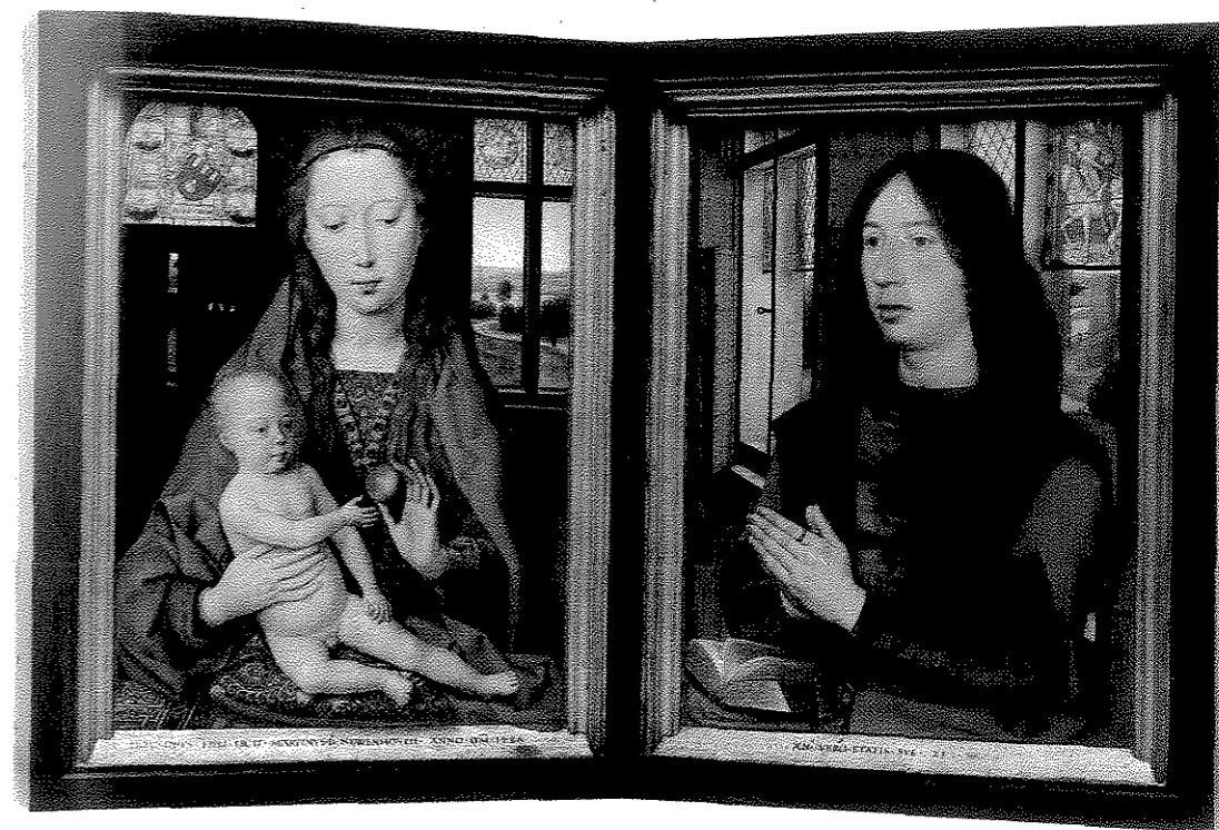
Fig. 2. Hans Memling, Diptyque de Maarten van Nieuwenhove , 44 x 33,5 cm (chaque volet), Bruges, Memlingmuseum, n° inv. O. SJ178. I.

On évitera également d'utiliser le terme « portrait de commanditaire » car les personnes dont le portrait figure dans des tableaux religieux n'en sont pas nécessairement les commanditaires. On pensera notamment à la série des vingt-quatre tableaux de dévotion commandés par Philippe le Hardi à Jean de Beaumetz en 1388 pour orner les cellules de moines de la Chartreuse de Champmol. On ne conserve que deux de ces vingt-quatre tableaux. Tous deux représentent la Crucifixion avec un chartreux agenouillé au pied de la croix. Dans ce cas, les personnes portraiturées ne sont pas les commanditaires, mais les bénéficiaires de l'œuvre.