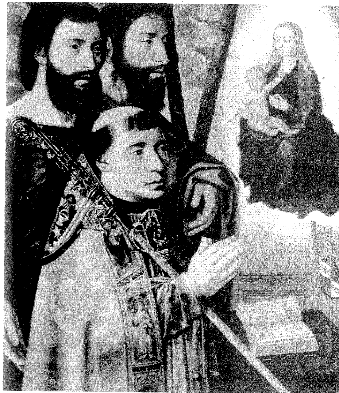
Fig. 8. Jan Provoost, Un homme en prière devant la Vierge à l'Enfant dans une nuée , 32,5 x 27 cm, localisation inconnue (anciennement Amsterdam, P. de Boer). © M. Friedländer, Early Netherlandish Painting . IXb. Joos van Cleve, Jan Provost, Joachim Patenier, Bruxelles, 1973, n° 163.