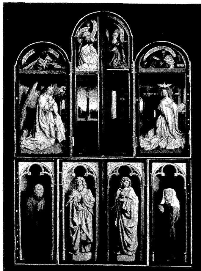
Fig. 1. Jan et Hubert van Eyck, Polyptyque de l'Agneau mystique (revers), 375 x 260 cm (fermé), Gand, église Saint-Bavon.