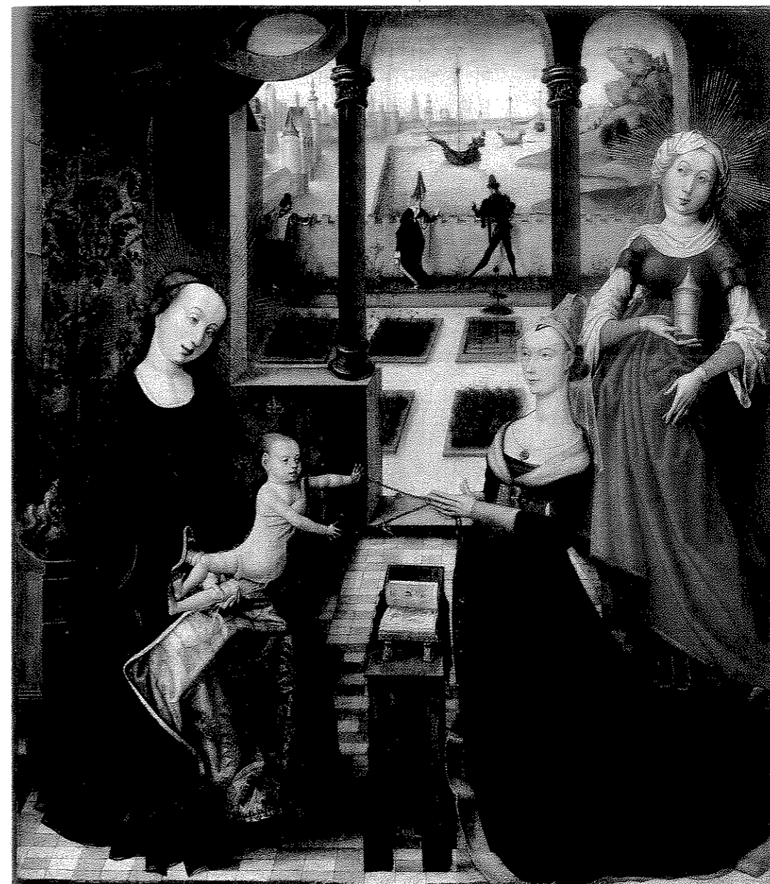
Fig. 10. Maître à la Vue de Sainte-Gudule, La Vierge à l'Enfant avec une jeune femme en prière et sainte Marie-Madeleine , 56 x 49 cm, Liège, Musée Grand Curtius, n° inv. A9.