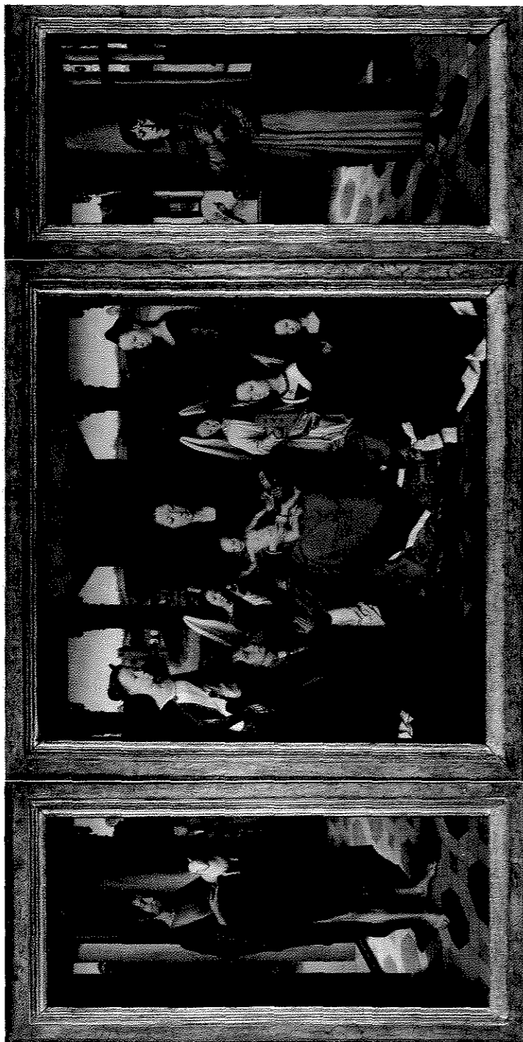
Fig. 6. Hans Memling, Triptyque de la Vierge à l'Enfant , dit Triptyque de John Donne of Kidwelly , 72,3 x 71,6 cm (pann. central) et 72 x 31,1 cm (volets), Londres, The National Gallery, n° inv. NG 6275.