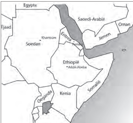
FIGUUR 2 DE HOORN VAN AFRIKA

tie eiste namelijk dat Eritreërs bewezen dat zij niet alleen slachtoffers waren van een willekeurige repressieve behandeling, maar ook individueel waren vervolgd. Bovendien moesten zij, zoals eerder vermeld, hun identiteit bewijzen.