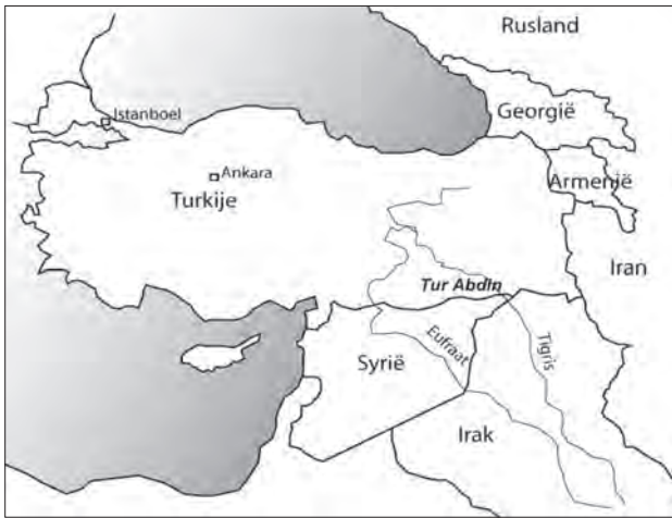
FIGUUR 1 DE REGIO TUR ABDIN

volging, bestond er een binnenlands vluchtalternatief in de grote Turkse steden en kon vervolging door mensen die geen deel uitmaakten van de Turkse overheid voor vluchtelingenschap zorgen. De Turkse Christenen spraken een eigen taal, met daarbinnen wel grote regionale verschillen, en ze gebruikten een eigen alfabet. Turkse Christenen kwamen voornamelijk uit de regio Tur Abdin in Zuid-Oost Turkije (zie figuur 1). Het waren merendeels boeren en enkele ambachtslieden. Ze hadden vee, land en wijngaarden. Turkse Christenen begonnen hun betogen veelal door te wijzen op de lange geschiedenis van vervolging in Turkije. De Turkse Christenen legden uit dat zij problemen hadden met hun Koerdische burens en met de Turkse overheid, die hen niet kon en wilde beschermen.