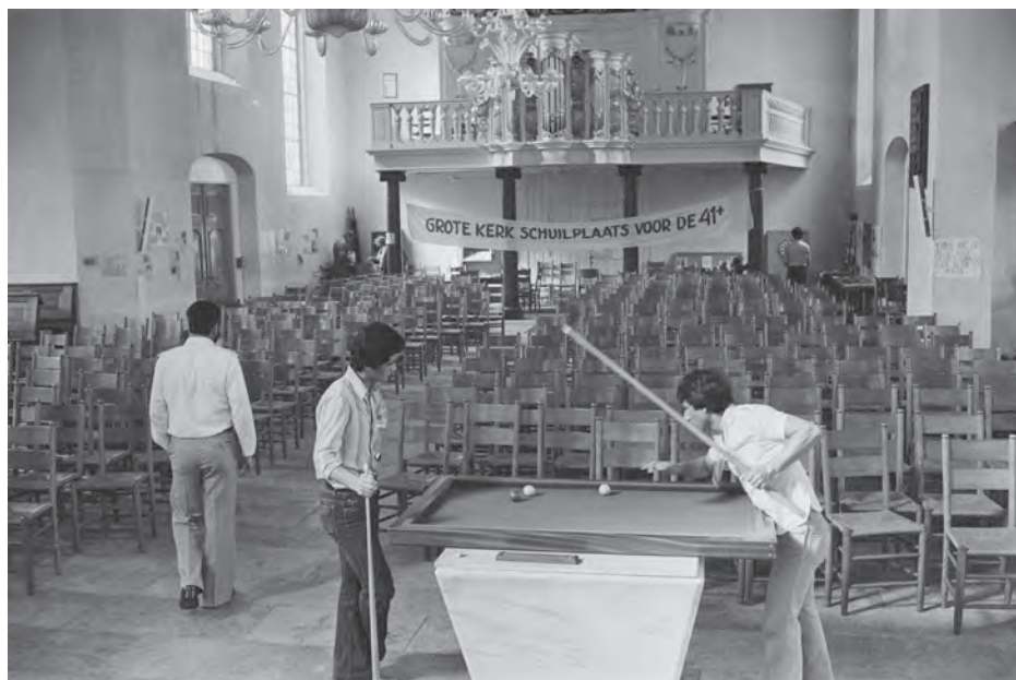
Biljartende Turkse Christenen in de Grote Kerk te Almelo. Deze kerk bood kerkasiel aan de 41+ Turkse Christenen die na heroverwegingen opnieuw werden afgewezen. Er was in kranten veel aandacht voor de Turkse Christenen die hun toevlucht tot kerken zochten.

de af te dwingen. ‘Het hoofd in de schoot werpen’ en hen toelaten, was volgens deze ambtenaar het beste. Volgens hem bezweek de Raad van Kerken onder druk van plaatselijke kerken en actiegroepen, die alles aangrepen om verblijf van de Turkse Christenen af te dwingen. De Turkse Christenen voerden aan niet te willen emigreren, omdat zij nauwe banden hadden opgebouwd met Nederlanders en Turkse Christenen in Nederland. Hun medische en psychische situatie was ook vaak bedroevend. De staatssecretaris van Justitie, Korte-van Hemel (CDA), vond echter dat het beleid al soepel genoeg was en dat ‘de rek eruit was’. 60 Als er nog maar één Turkse Christen werd toegelaten, zouden alle anderen zich volgens haar beroepen op dit precedent en weigeren te emigreren.