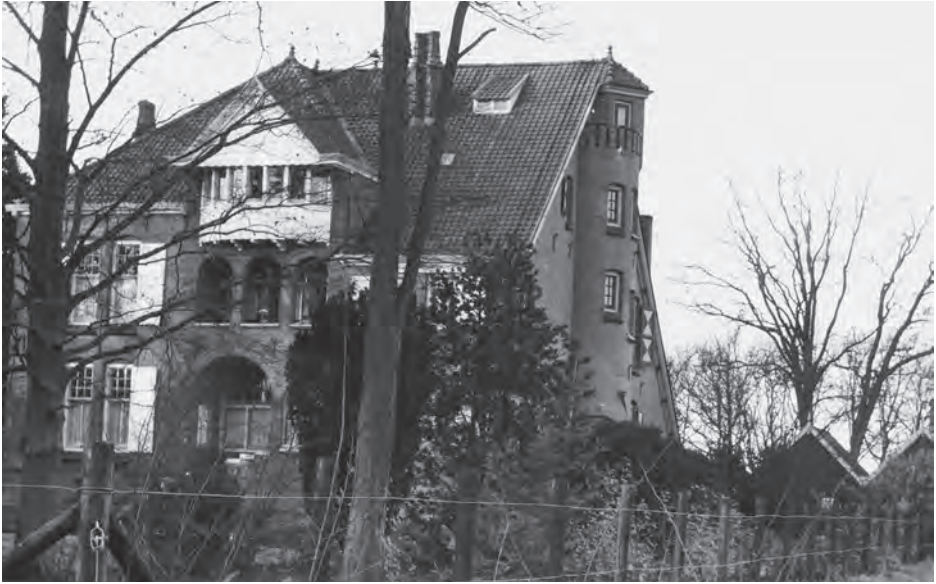
Hier zien we een van de foto's gemaakt voor de Poolse ambassadeur van het met prikkeldraad omheinde interneringskamp De Rozenhof te Almen in 1955.