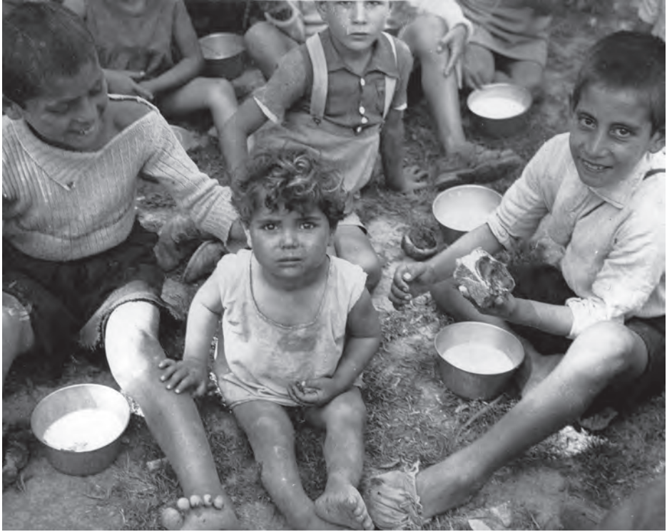
Vluchtelingenkinderen in kampen in Europa. Hun gezichten wekten medelijden op bij het grote publiek.

Een laatste factor die in deze periode meespeelde bij rechtvaardiging van het restrictieve asielbeleid, was grote angst voor een Derde Wereldoorlog. De machtsgreep in Praag (februari en maart 1948) en het begin van de Korea-oorlog (1950) wakkerden die vrees aan, evenals de Suezcrisis en de machtsgreep in Hongarije (beide in 1956). Het was ook gedeeltelijk uit vrees voor een uitbreiding van het communisme dat de Nederlandse regering, onder grote druk van de vs, met als dreigement onthouding van de Marshallhulp, instemde met onafhankelijkheid van Indonesië. De vrees voor het communisme was ook op het ministerie van Justitie aanwezig. Dit hoofdstuk laat zien dat beleidsmakers en beslissers vreesden dat zich tussen de asielzoekers die afkomstig waren uit communistische landen spionnen bevonden. Dit wantrouwen werd versterkt doordat het niet mogelijk was de antecedenten van de asielzoekers te controleren.